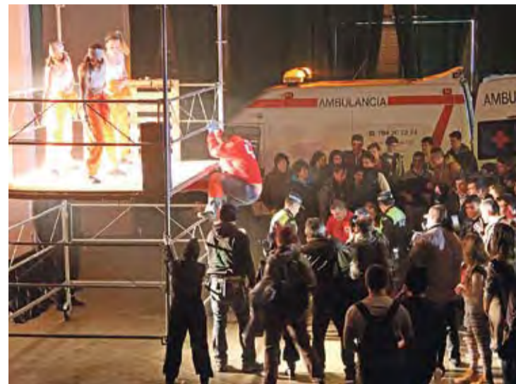
EDICIONS ANTERIORS. Una imatge de la campanya de fa quatre anys

La campanya interpel·la més de 700 joves sobre els perills del consum d'alcohol i drogues