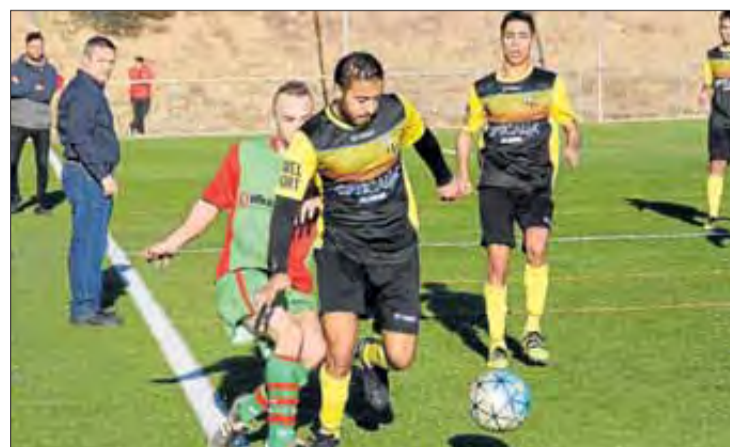
Dues jugades del Vilajuïga-Navata (0-9) i del Palau-Lladó (3-3).