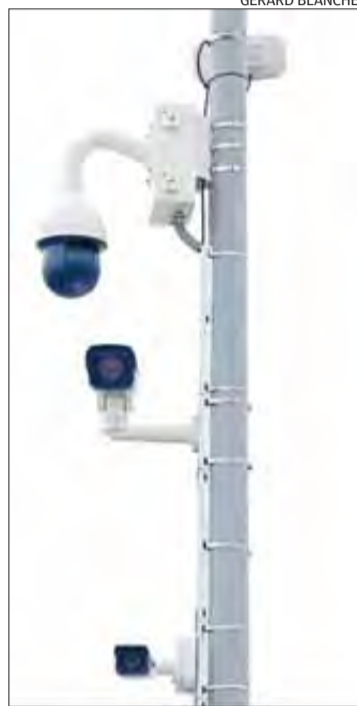
Detall del dispositiu tecnològic.

"Els llocs on es troben ubicades les càmeres de trànsit són a la rotonda de l'Oficina de Turisme, a l'avinguda de Rodhe; a la Gran Via Pau Casals, a la rotonda dels cinemes, i a la riera Ginjolers, alçada de l'estació d'autobusos", explica Ferdy , i alerta els conductors que aquestes càmeres que s'han instal·lat disposen de la darrera tecnologia: "Permeten una captació d'alta qualitat, així com la recerca automàtica de vehicles amb interès policial."