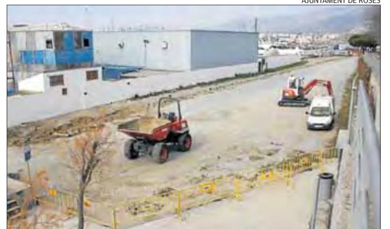
Les màquines van començar a treballar la setmana passada.

fins a la mateixa platja. L'accés i l'aparcament es pavimentaran amb aglomerat asfàltic, així com l'espai destinat als vianants amb formigó rentat a l'àcid, que harmonitzarà la imatge amb les voreres del Far i del camí de ronda adjacents. Es plantaran arbres i arbusts i s'instal·laran els sistemes de reg, l'enllumenat i el mobiliari urbà necessaris.