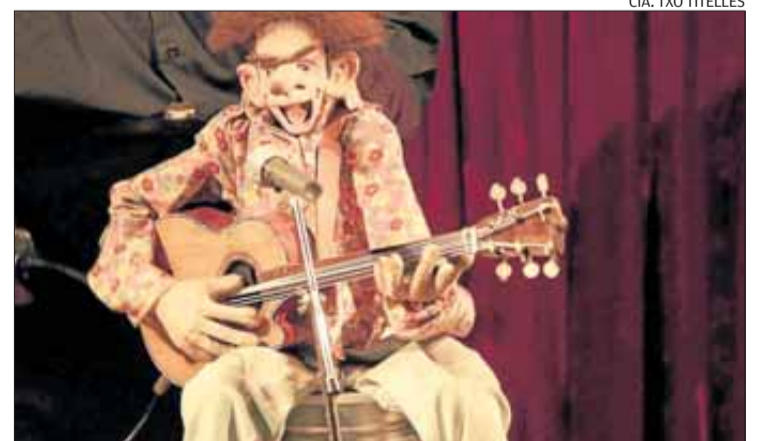
CIA. TXO TITELLES

ges mostrant les seves habilitats, proeses i rareses, genialitats i destreses. La desfilada s'amenitza per una còmica i caricaturesca veu en off. El ritme de l'espectacle, que farà les delícies del petit auditori, passa de tranquil a animós, de trepidant a relaxant i sempre marcat pel caràcter i l'energia dels protagonistes que enamoraran a petits i grans.