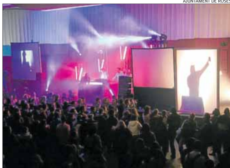
Imatge d'una de les campanyes anteriors.

Els bons resultats obtinguts, des de la posada en marxa de la campanya, es fan palesos amb cada nova edició. Fets que mostren la conscienciació assolida entre la ciutadania de Roses són, per exemple, la decisió de les colles de Carnaval d'evitar el consum d'alcohol durant les passades, o el clar descens del nombre