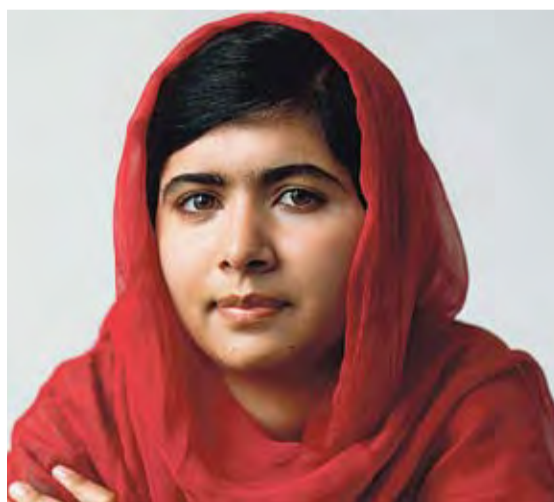
MALALA YOUSAFZAI. És activista per l'educació