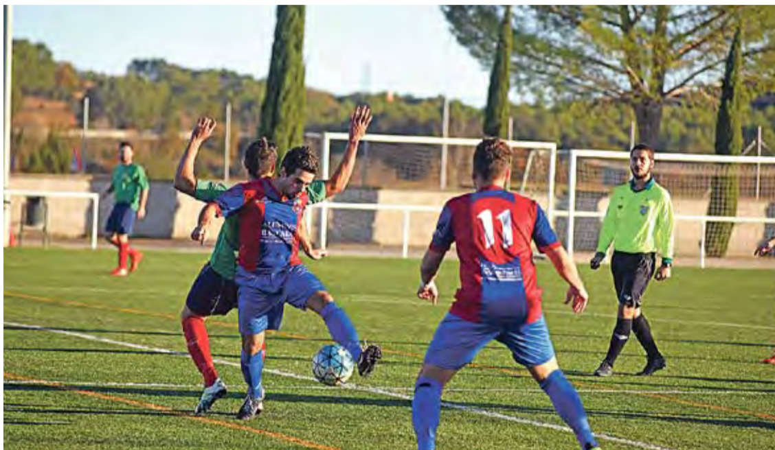
BÀSCARA. Els blaugrana, en una imatge d'arxiu, van perdre amb claredat a Agullana (5-1)

■ El Base Roses continua comandant la classificació del grup 15 de Tercera Catalana després de superar diumenge un rival directe a la part alta de la classificació, l'Empuriabrava-Castelló, per 2 a 0, en el marc d'un partit equilibrat que es va escliar al tram final amb dianes d'Hornos, de penal (85'), i de Plujà (89'). Els de Napo Cayuela continuen traient un punt d'avantatge respecte del Bisbalenc, que va superar el Llançà (3-0), però incrementa el coixí en relació amb el CFEC, que ja és de 6 punts, i al Bàscara, que es troba a 4 punts després de caure amb contundència contra un inspirant Agullana (5-1 i hat-trick de Torres).