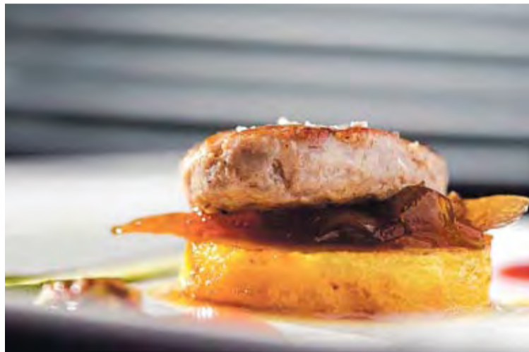
RUTA DE LA TAPA. És una iniciativa de l'Oficina de Català de Roses

Alguns establiments participants en el projecte han renovat