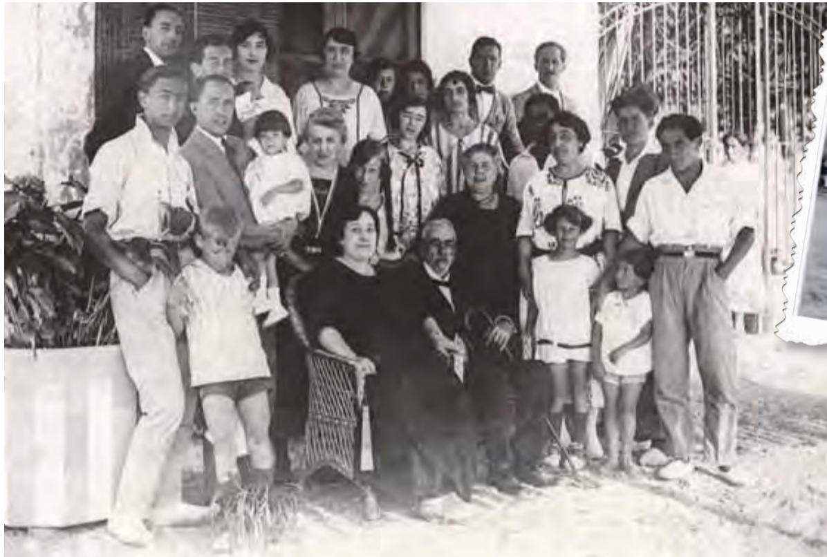
FONS AUGUST PI I SUNYER

► Un llibre editat per la Fundació Pi i Sunyer recupera textos memorialístics i inèdits de Carles Pi i Sunyer escrits als anys 50