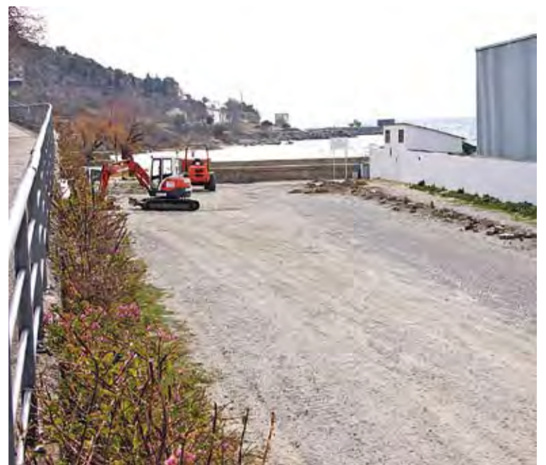
L'ACTUACIÓ. Adjudicació recent per un import de 82.000 euros

La zona on es fan aquestes actuacions és turística i també molt concorreguda pel públic local. La platja dels Palangrers, de petites dimensions, es considera la primera cala desvinculada del nucli urbà del municipi. ■