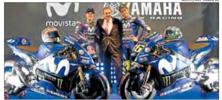
Maverick, amb Rossi, a la presentació del Movistar Yamaha, a Madrid.

Valentino Rossi en el Movistar Yamaha i que tenia una proposta per tornar a Suzuki, acaba aquest dimarts a Sepang (Malàisia) el primer test oficial de pretemporada de cara al debut que tindrà lloc el 18 de març a Losail (Qatar).