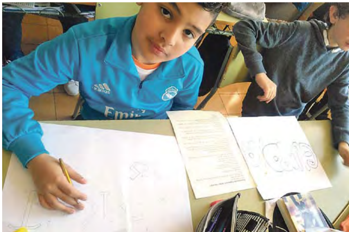
'PROTAGONISTES PER LA PAU'. La campanya commemora el Dia Escolar de la No-violència i la Pau (DENIP)

La campanya de sensibilització «Protagonistes per la pau» té com a objectiu promoure l'educació per la pau, els drets humans i els seus valors. En aquest sentit, en l'ampli llistat de vides per la pau que s'han investigat hi ha personatges molt coneguts, com la pa-