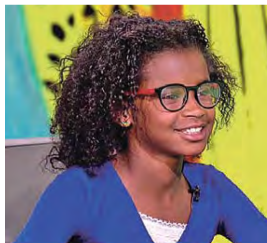
MARLEY DIAS. Impulsora de #1000BlackGirlBooks