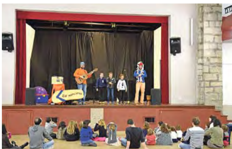
Actuació infantil de la darrera festa major d'hivern À. REYNAL

L'exposició proposa un recorregut en dos àmbits: dos primers panells, que detallen aspectes biogràfics, la seva implicació en la vida política local, etc., i un altre àmbit, que descriu el seu vessant com a compositor en diversos gèneres musicals i especialment en l'àmbit sardanístic, atès que va arribar a compondre més de dues-centes sardanes. I també els seus èxits com a músic, com ara quan era director artístic de la cobla Pe-