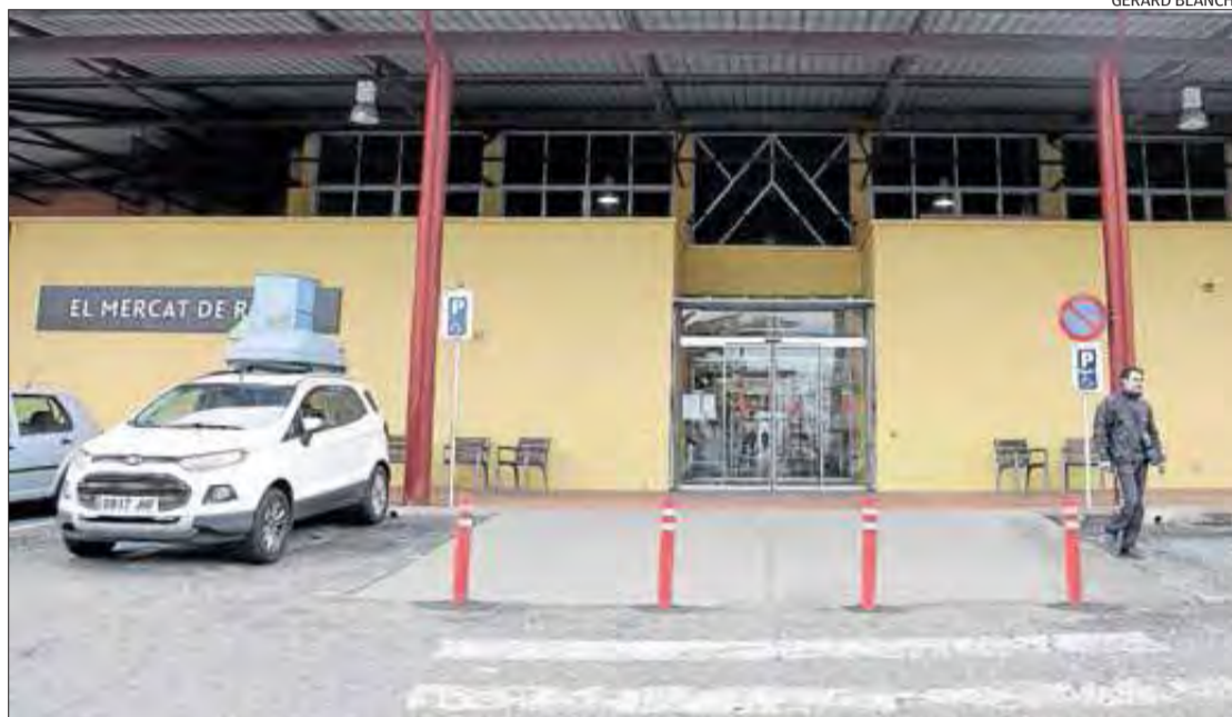
Una de les entrades al Mercat Municipal de Roses.