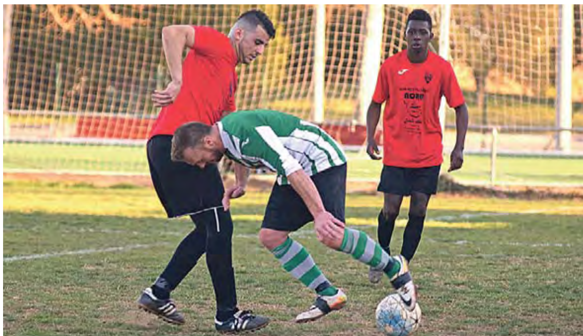
PORTBOU. Els fronterers, que han guanyat 7 dels últims 8 partits, reforçen les seves credencials a dalt