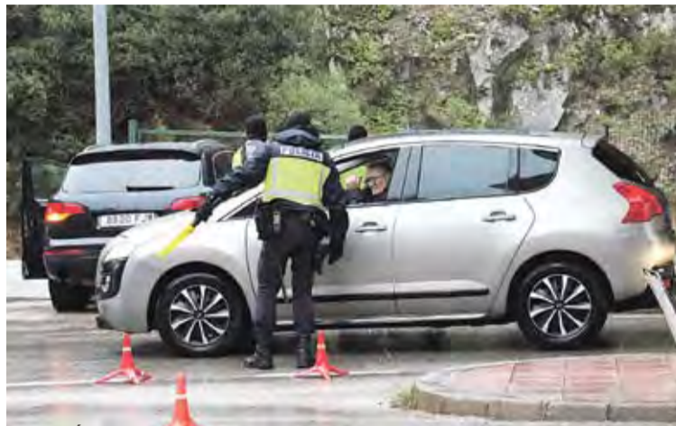
AL PERTÚS. Dilluns agents de la policia en un dels controls

Un dels controls es va instal·lar a la frontera amb França, concretament a la rotonda i al punt d'accés a l'autopista a la Jonquera, a la zona de Duanes. Els agents aturaven els vehicles procedents de França i els escorcollaven. Fins i