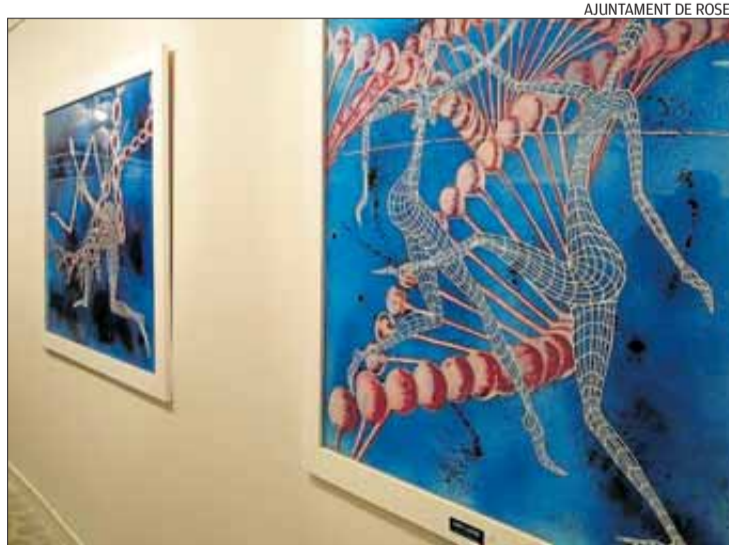
Fins al 18 de febrer es pot visitar la mostra de Jaume Mach.

Per a la nova temporada, el cicle manté el format de dos blocs de propostes, adreçades al públic adult i infantil. En l'apartat de taller per a públic adult, trobem els tallers de fotografia amb mòbil (creació, edició i publicació), de narrativa a través de les principals sèries televisives d'èxit dels darrers temps, d'astrologia, de lectura de contes i una visita guiada amb l'artista Carles Bros.