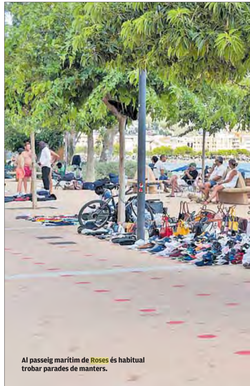
Al passeig marítim de Roses és habitual trobar parades de manters.

Molts d'ells en prou feines parlen espanyol, no tenen vehicle ni el mínim per viure. I els costa molt trobar habitatge, ja que «pel fet de ser negres i manters» no els volen llogar res. Falilou també explica que s'es-