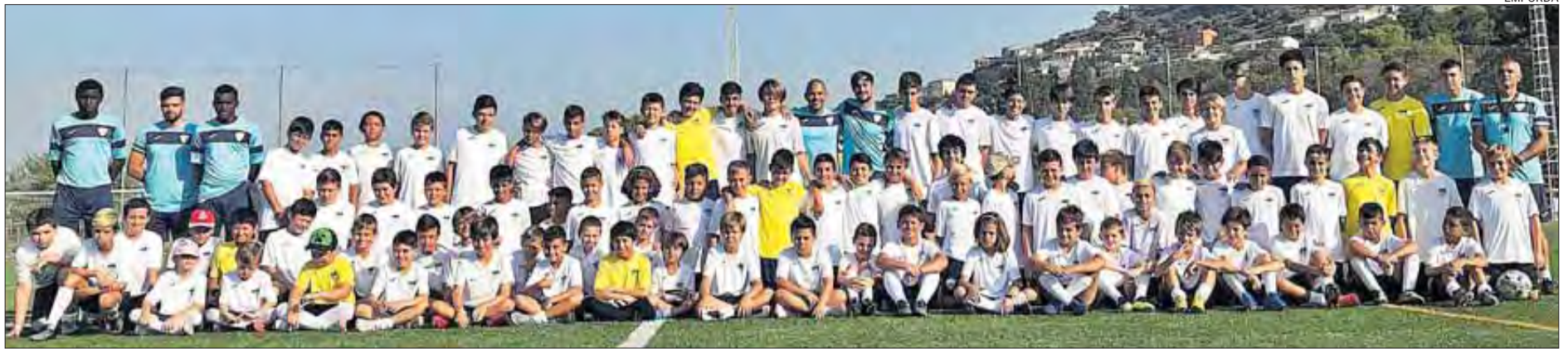
El grup que ha format la tercera edició del campus de tecnificació Dynamo Stars.