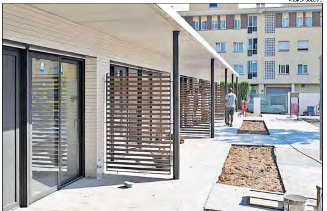
Imatge de l'ampliació de la residència.

Aquesta cooperativa va néixer l'any 1992 oferint el servei de residència assistida i per a les persones que eren autònomes i podien viure independentment es van construir 8 bungalows que, en un principi, no s'omplien fins que es va poder pagar mensualment, i des d'aleshores està al 100%.