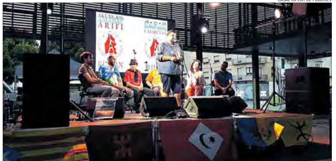
CASAL RIFENY DE FIGUERES

A dalt, recepció i acollida dels participants al Congrés. A sota, conferència política a la plaça Catalunya.