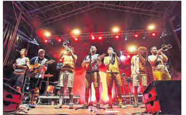
Centenars de persones van ballar les millors cançons del grup.

Oques Grasses ha començat una nova era des que ha tornat als escenaris amb el seu últim disc. Centenars de Fans del sol van poder gaudir i xalar divendres passat amb la seva música a la Ciutadella de Roses en un exquisit concert, que formava part de les propostes de Sons del Món. I és que la localitat rosina va convertir-se en un pol d'atracció per a un bon grapat de seguidors i seguidores que van venir d'arreu de Catalunya a veure'ls actuar. Després de l'estrena de la nova gira al festival Strenes de Girona, aquesta va ser de les poques actuacions que Oques Grasses duu a terme per la nostra demarcació. Davant d'un sol de colors intensos que feia goig de veure al mig de l'escenari, Oques Grasses va alçar el públic –que ja venia escalfat prèviament pel grup de folk-pop Sense Sal– amb la cançó Serem ocells . Ningú s'ho va voler perdre. Petits, joves, adults... Tothom va reunir-se a Roses amb l'única premissa de gaudir del concert i deixar-se portar. «I què importa si ningú ho entén?». Doncs bé,