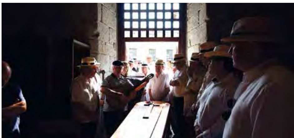
MOMENT DE LA CANTADA D'HAVANERES. A l'entrada de l'església