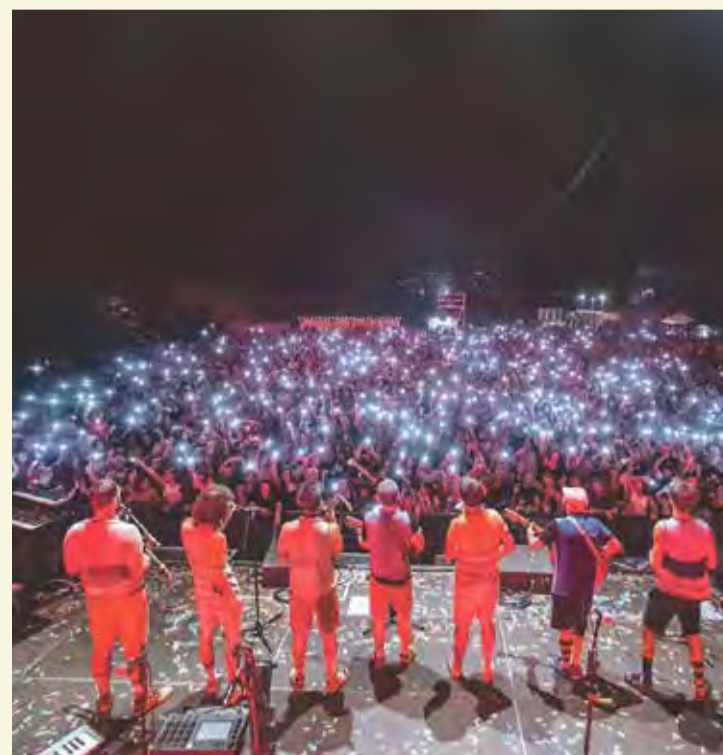
FANS DEL SOL, és l'últim treball dels osonencs

■ La Ciutadella de Roses va vibrar divendres amb una festa musical que feia ballar grans i petits. El concert d'Oques Grasses, que no va començar abans de la mitjanit, va desplegar el bon rotllo dels osonencs amb notes potents i el seu ampli ventall d'instruments. Sense cadires, com en altres concerts de Sons del Món, el públic es va encomanar de seguida de l'ambient festiu. Amb l'arrencada del tema Serem ocells es van anar succeint els hits d'aquesta banda de pop català que tant sona a les emissores musicals del país. L'himne In the night va ser el més esperat i, sens dubte, Els passos importants va emocionar els seguidors. Els Oques Grasses van tenir com a teloners els terrassencs Sense Sal. Doble festa a Roses. ■