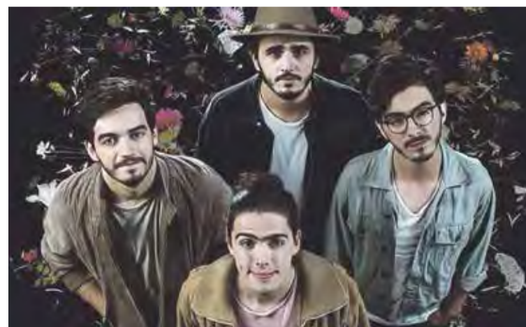
CONCERTS. Seran la nit del dijous, divendres i dissabte