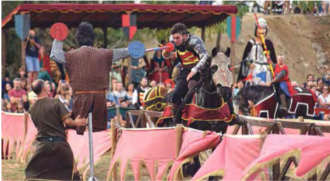
GRAN TORNEIG DE CAVALLERS. És una de les activitats que concentra més nombre de públic