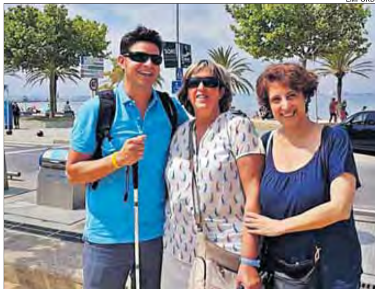
Multicapacitats va visitar Roses per comprovar l'accessibilitat.

com la piscina, disposen d'elements d'adaptació per a persones amb discapacitat.