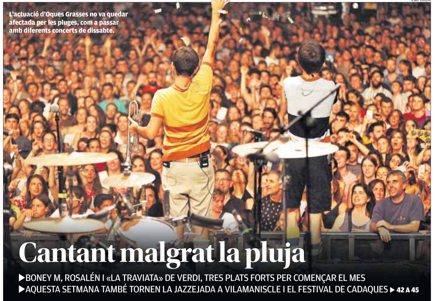
L'actuació d'Oques Grasses no va quedar afectada per les pluges, com a passar amb diferents concerts de dissabte.

▶ Els seus excrements corrossionen el material urbà, vehicles i teulades ▶ 14