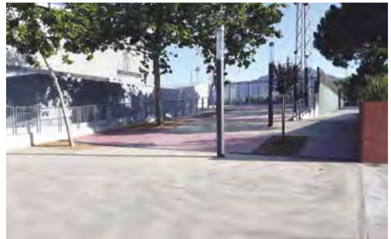
RENOVACIÓ. La nova rampa millora l'accessibilitat

■ La pista poliesportiva de Roses compta amb un nou edifici de serveis de 120 m 2 . Està situat a la façana lateral de la pista, i consta de 4 mòduls sanitaris capaços de funcionar de manera independent. Cada mòdul està equipat amb 6 cabines, 1 bany adaptat i 2 lavabos. Amb aquesta construcció es millora la quantitat i la qualitat dels serveis higiènics, que permetrà a la pista poliesportiva acollir esdeveniments de major capacitat. L'accés al camp d'esports anterior s'ha enderrocat, i el seu lloc l'ocupa una rampa que en millora l'accessibilitat.