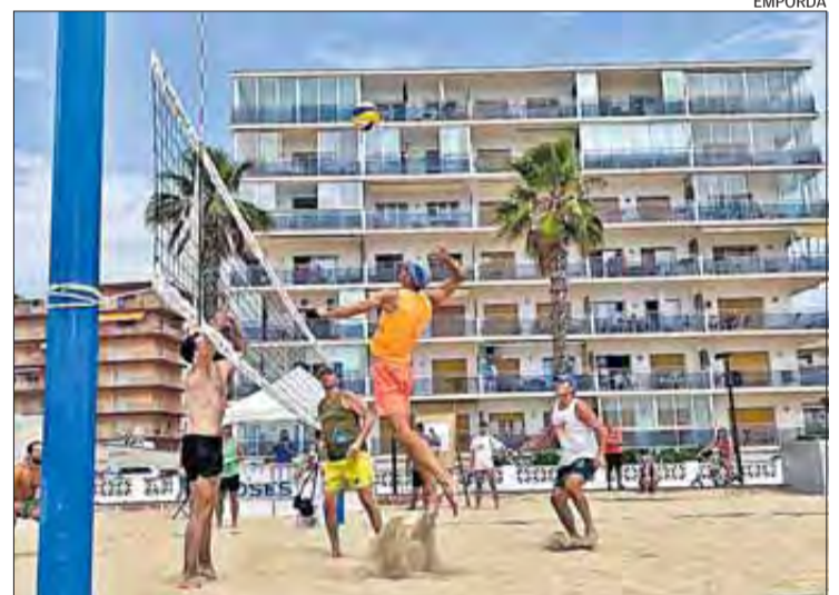
La cita és dissabte a partir de les nou del matí.

Des de l'organització, demanen als participants que facin la inscripció online, ja que és molt més còmode i pràctic perquè el mateix dia del torneig ja hi ha els enquadraments fets, i no cal esperar a