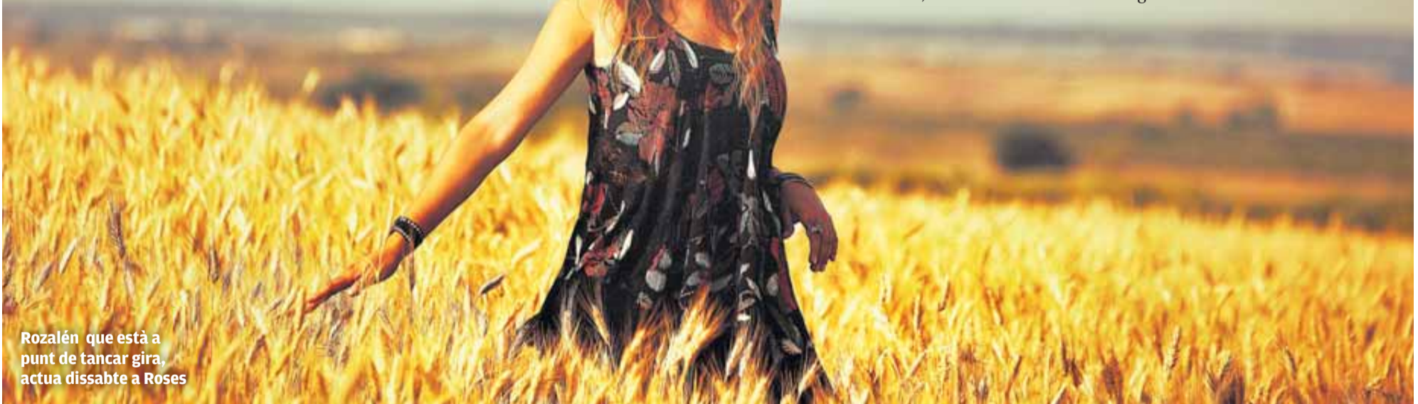
Rozalén que està a punt de tancar gira, actua dissabte a Roses

■ M'agrada quan la gent em diu activista o destaca això, en realitat em surt així perquè ho sento de veritat, és part de mi, m'han educat en això, en preocupar-me pel veí. Volia dedicar-me a la psicologia social i a la música i sempre m'han agradat els artistes compromesos. Soc el que volia ser i m'omple d'orgull.