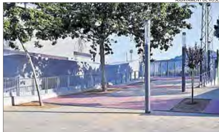
El nou edifici de serveis públics annex a la Pista Poliesportiva.

El nou edifici de serveis té una superfície de 120 metres quadrats i està distribuït en quatre mòduls sanitaris, cada un dels quals conté sis cabines, un bany adaptat i dos lavabos. El pressupost destinat a