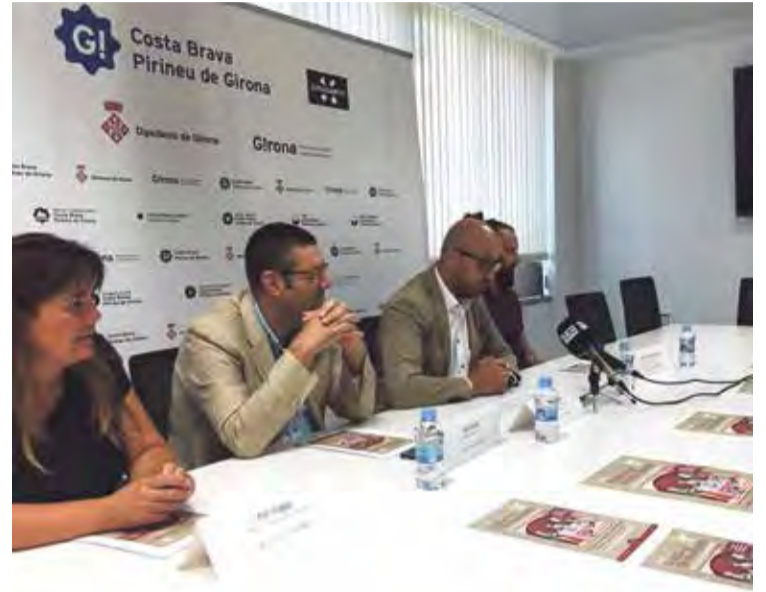
PRESENTACIÓ. Es va fer ahir, dilluns, al matí