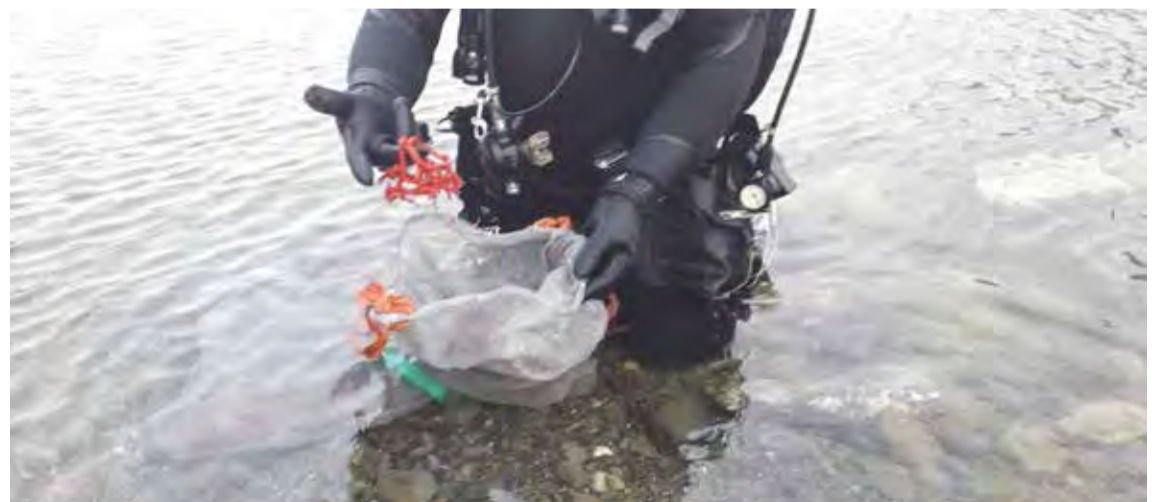
AMAGAT. Un agent mostra un exemplar de corall vermell