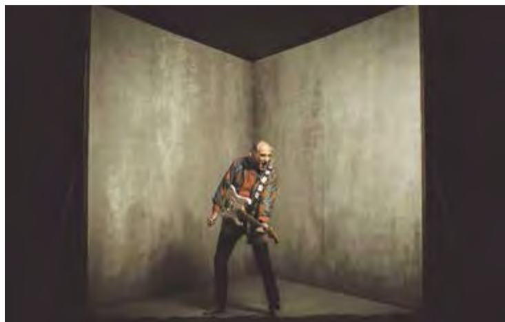
PAU RIBA. Serà la primera vegada que el cantant actuï al festival PORTALBLAU