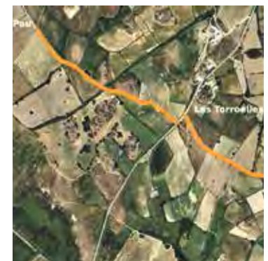
EL TRAM. Recorregut de millora AJ. P-S

ment del ferm, la creació de cunetes i la millora dels encreuaments amb les carreteres que el travessen, però l'Agència Catalana de l'Aigua, el Parc Natural dels Aiguamolls i la Diputació de Girona hi van presentar esmenes. En el projecte final s'hi afegiran esquesnes d'ase, daus de formigó en les zones d'encreuament amb recs, tubs de desguàs i senyals d'estop a les interseccions que creuen amb les carreteres. ■