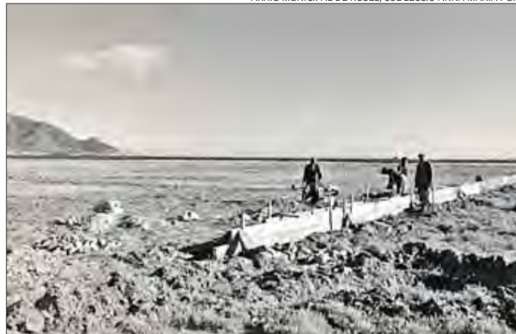
Obrers fent l'obertura dels carrers de Santa Margarida el 1960.