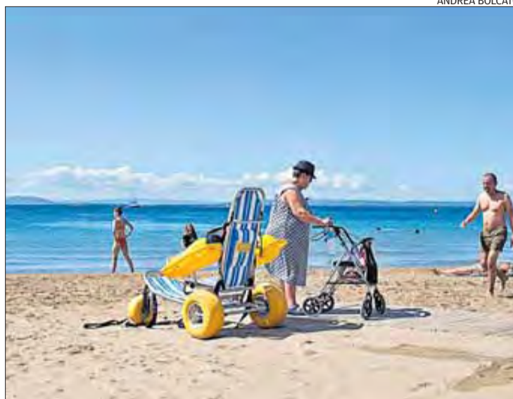
Ja es disposen d'elements, com cadires amfibies o passeres segures.

Durant la reunió, l'alcaldesa va explicar a l'entitat el projecte Saltem les barreres , que ha dut a terme l'Ajuntament, en el qual s'ha destinat pressupost per arranjar carrers i voreres per fer-los accessibles a la gent amb minusvalideses, i altres equipaments públics,