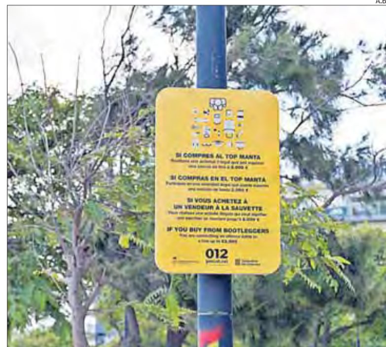
L'Ajuntament ha col·locat panells informatius sobre les sancions.

tan sis mesos a Roses i sis mesos a Andalusia, on fan de jornalers en unes condicions de treball pèssimes.