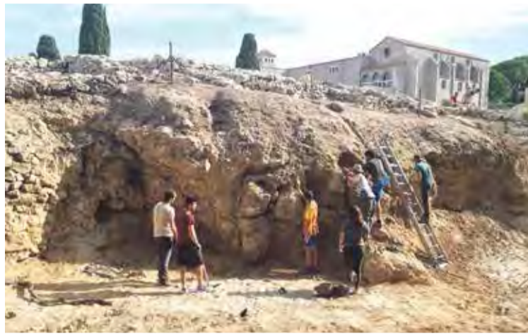
TOMBES. La troballa ha permès completar el coneixement de l'espai funerari ACN

■ Els treballs realitzats per una trentena d'estudiants de diverses universitats, en el marc les excavacions del 73è curs d'arqueologia d'Empúries, han deixat al descobert la façana portuària de la ciutat grega. Tal com detallen, l'actuació ha permès fer visible la part superior del penya-segat que marcava el límit de la zona amb la fondalada de l'antic port. Els sectors on s'ha treballat, a més, han permès documentar construccions i nivells que pertanyen a la primera ocupació del nucli durant la segona meitat del segle VI aC, a banda d'altres edi-