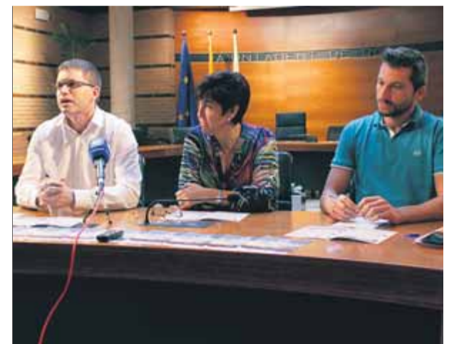
El govern de Roses va donar ahir el tret de sortida a una nova edició dels pressupostos participatius

■ L'Ajuntament posa en marxa els tercers pressupostos participatius