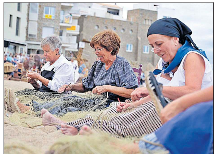
La Festa de la Sal reviu el passat mariner de l'Escala.

La Festa de la Sal va néixer l'any 1997 per commemorar el tercer centenari de l'Alfolí de la Sal i és una rememoració històrica dels orígens de l'antic port de l'Escala, escenificada per la mateixa gent