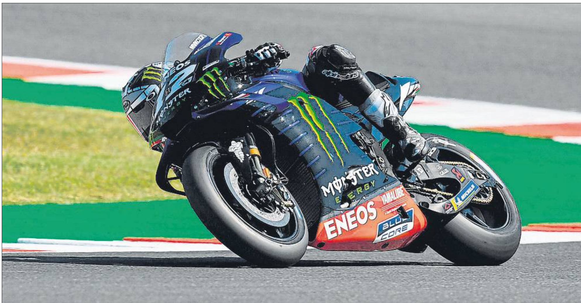
Maverick Viñales se llevó por 57 milésimas el pulso de los libres del viernes con Fabio Quartararo. El de Roses intentará sumar este sábado su segunda pole de la temporada tras la del Gran Premio inaugural en Qatar.