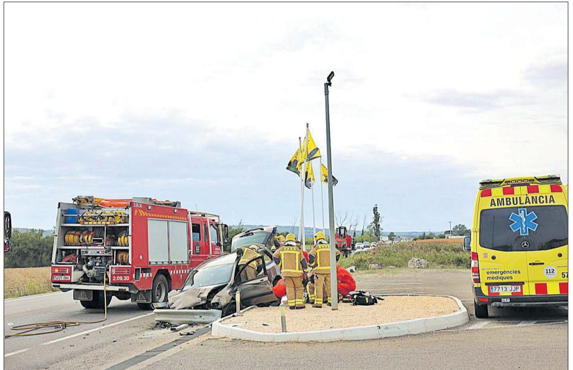
Els serveis d'emergència treballant al lloc de l'accident.