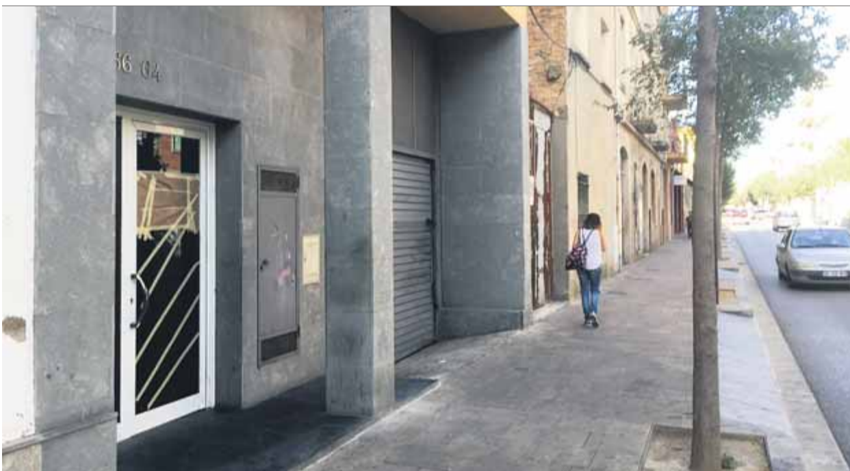
A l'esquerra, el portal amb els rastres visibles d'alguns dels trets del tiroteig de dijous ■ E.C.