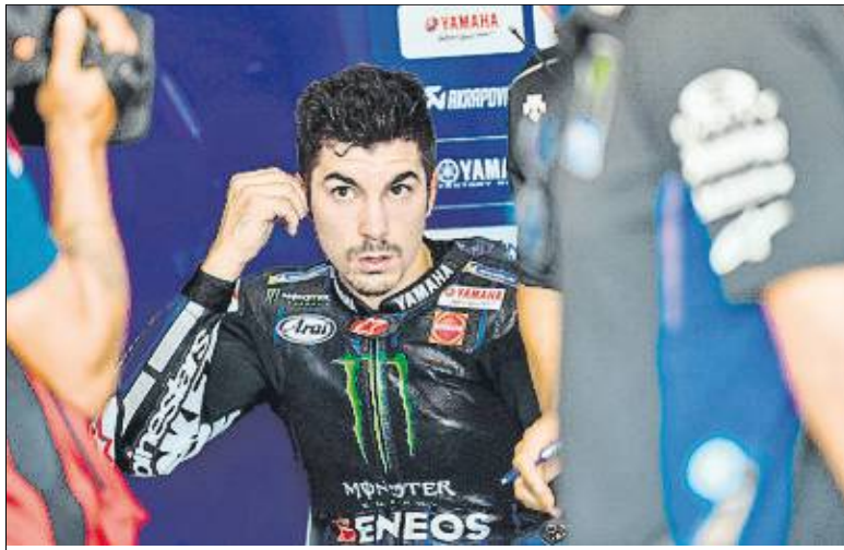
Viñales Encabezó la gran jornada de Yamaha en el circuito de Misano