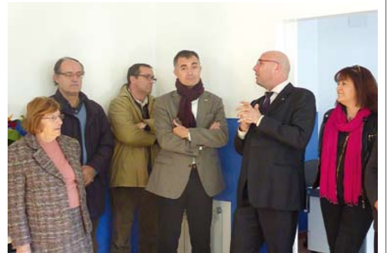
INAUGURACIÓ. Al centre de la imatge l'alcalde i el delegat de Benestar HORA NOVA