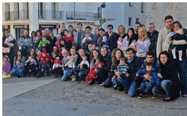
FOTO DE FAMÍLIA. Els escalencs del 2102 i els seus pares amb l'alcalde

Segons les dades de l'Idescat (Institut d'Estadística de Catalunya) l'Escala té 10.508 habitants. El 2009 el municipi va superar el sostre dels 10.000 veïns. ■