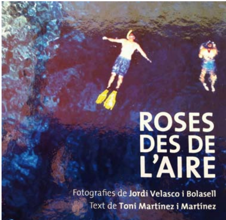
ROSES DES DE L'AIRE. Una de les imatges del llibre