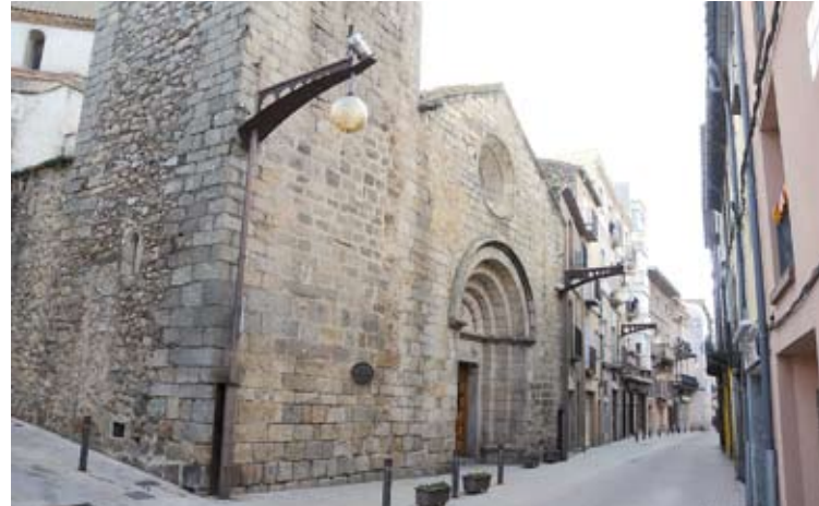
SANTA MARIA. Necessita reformes i els veïns s'han agrupat per impulsar-les À. REYNAL