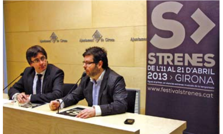
PRESENTACIÓ. Xavi Pascual i Carles Puigdemont a Girona

A banda dels concerts, des d'un mes abans de l'inici del festival es faran un seguit d'activitats culturals: taules rodones, actes adreçats a grups de música i professionals del sector, xerrades, masterclass o projeccions. El festival tindrà diferents ubicacions establertes a la ciutat: l'Auditori de Girona, la Casa de Cultura, la sala La Planeta i, com a novetat, es recupearà el Teatre Municipal.