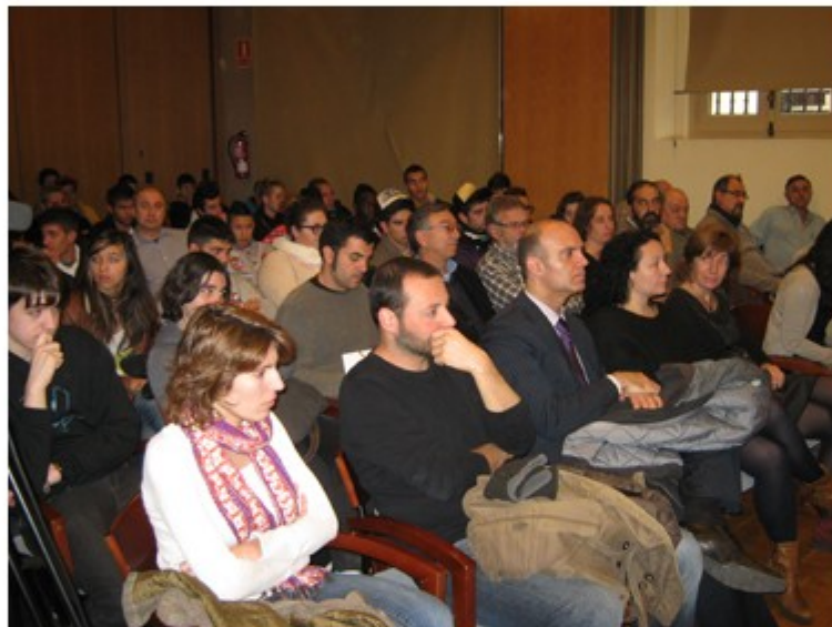
Moment de la presentació del projecte Okup'Alt 2013

Aquest dimarts s'ha celebrat la presentació del projecte Okup'Alt 2013 a la sala d'actes del Consell Comarcal de l'Alt Empordà. Es tracta d'una iniciativa adreçada a 42 joves de la comarca, que tenen entre 16 i 19 anys i que no estudien ni treballen, per tal d'oferir formació d'oficis gratuïta amb el suport dels ajuntaments i del teixit empresarial del territori. En concret, la formació que s'oferirà està relacionada amb tres temàtiques (forestal, manetes i administratiu).