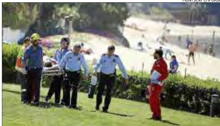
Membres dels cossos d'emergències traslladant la dona a l'helicòpter.

L'helicòpter del Servei d'Emergències Mèdiques (SEM) la va rescatar amb símptomes de preofegament cap a dos quarts d'onze a la zona de la cala de l'Almadrava de Roses, on va poder aterrar. En un inici se la va traslladar fins a l'hospital de Palamós per ingressar-la a la cambra hiperbàrica. Però, segons fonts del centre de salut, fi-