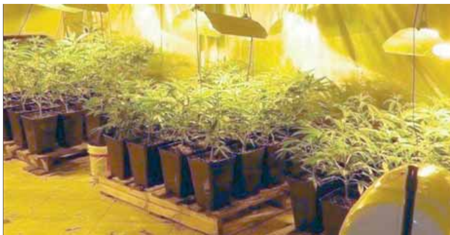
La plantació estava en els baixos d'un edifici, que van quedar precintats ■ EL PUNT AVUI

Els policies van muntar una operació de recerca