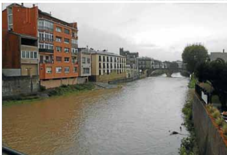
Tres imatges de pluja d'ahir: a dalt, temporal de mar a l'Estartit; a baix, a l'esquerra, els bombers treballen a Vilablareix, i el riu Daró a la Bisbal