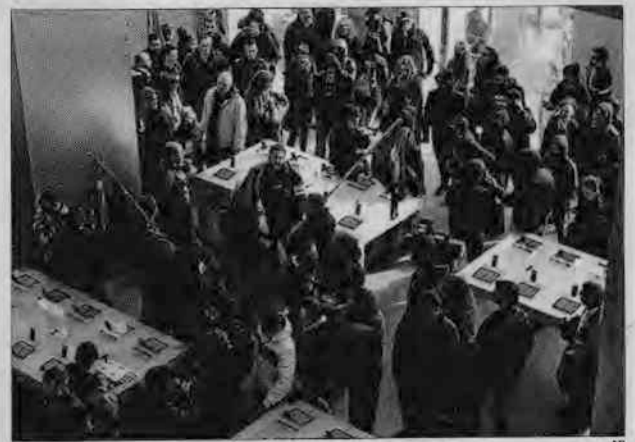
El grup de sindicalistes, a la botiga d'Apple de Barcelona