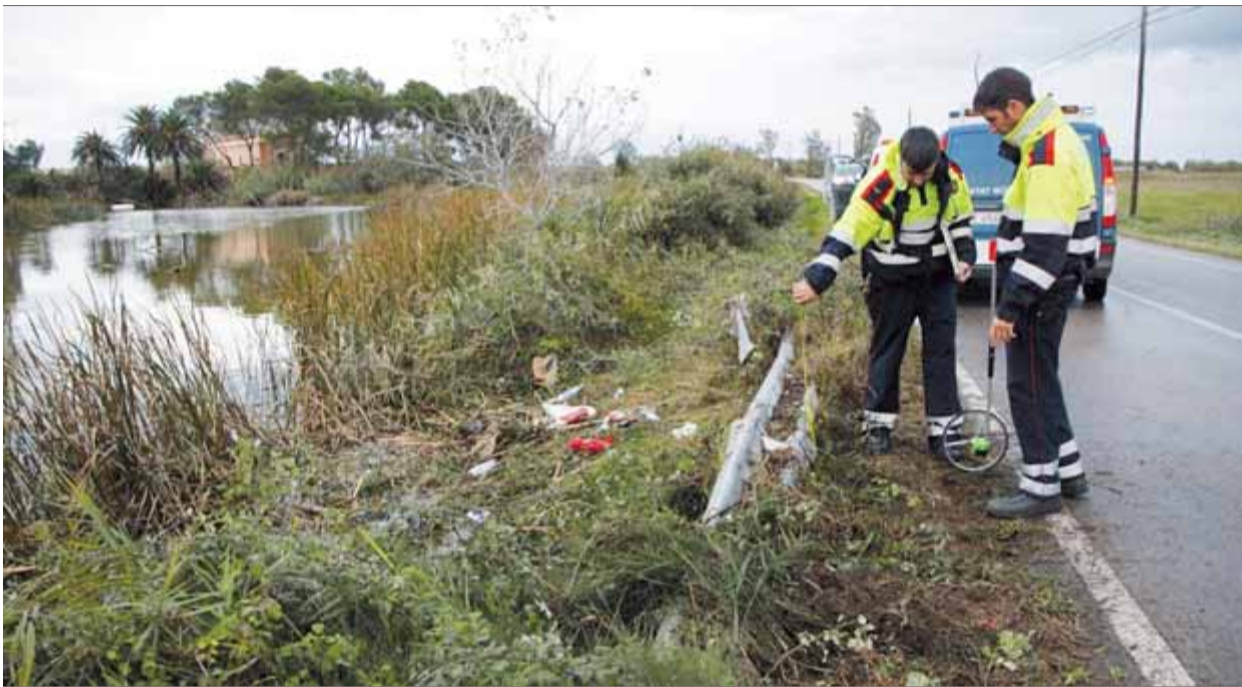
Uns mossos, inspeccionant ahir el tram de la via on una conductora d'un cotxe va anar a parar en un canal