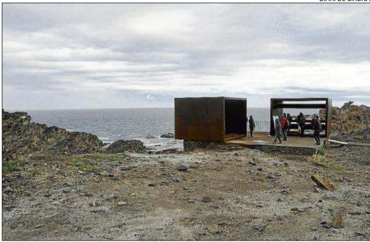
El paratge de Tudela amb un grup visitant l'espai.