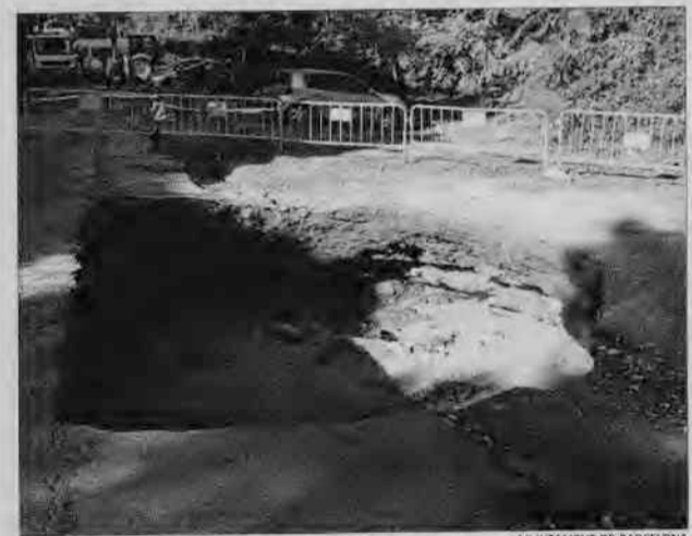
AJUNTAMENT DE BARCELONA

de la víctima, espanyola de 39 anys i veïna de Sant Miquel de Fluvià, rellisqués després d'un revolt, ja que la pluja havia mullat la calçada. Una grua va retirar el cotxe de la riera, que a causa de les precipitacions havia augmentat de cabal.