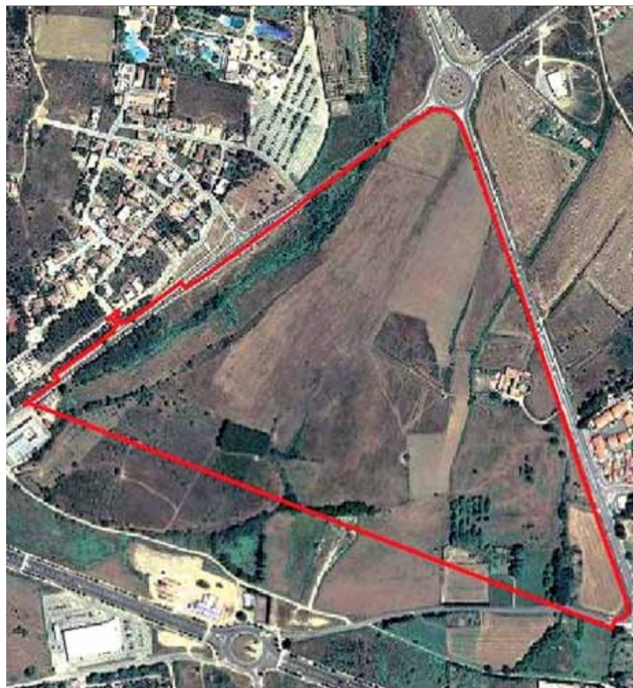
Fotomuntatge d'una part de l'àrea de Roses que es preveia urbanitzar, compresa entre les carreteres de Palau a Roses (GI-610), la de Cadaqués (GI-614) i la de Figueres (C-260)