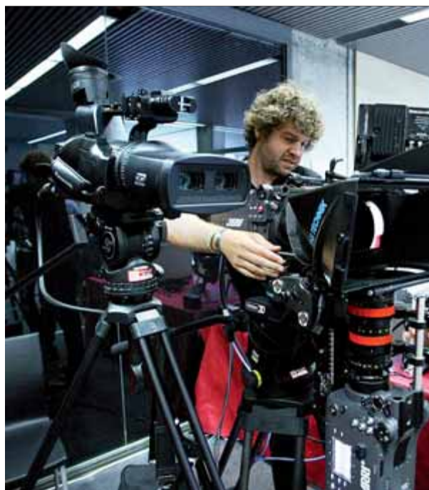
El Laboratori BLOOM de Tecnologia avançada, situat al Parc Tecnològic, és un dels centres on s'impartirà el màster ■ LL.S.

Amb el màster es pretén professionalitzar els alumnes i, per tant, va dirigit tant a estudiants com a professionals del sector. Per aquest motiu, s'impartirà divendres i dissabte a