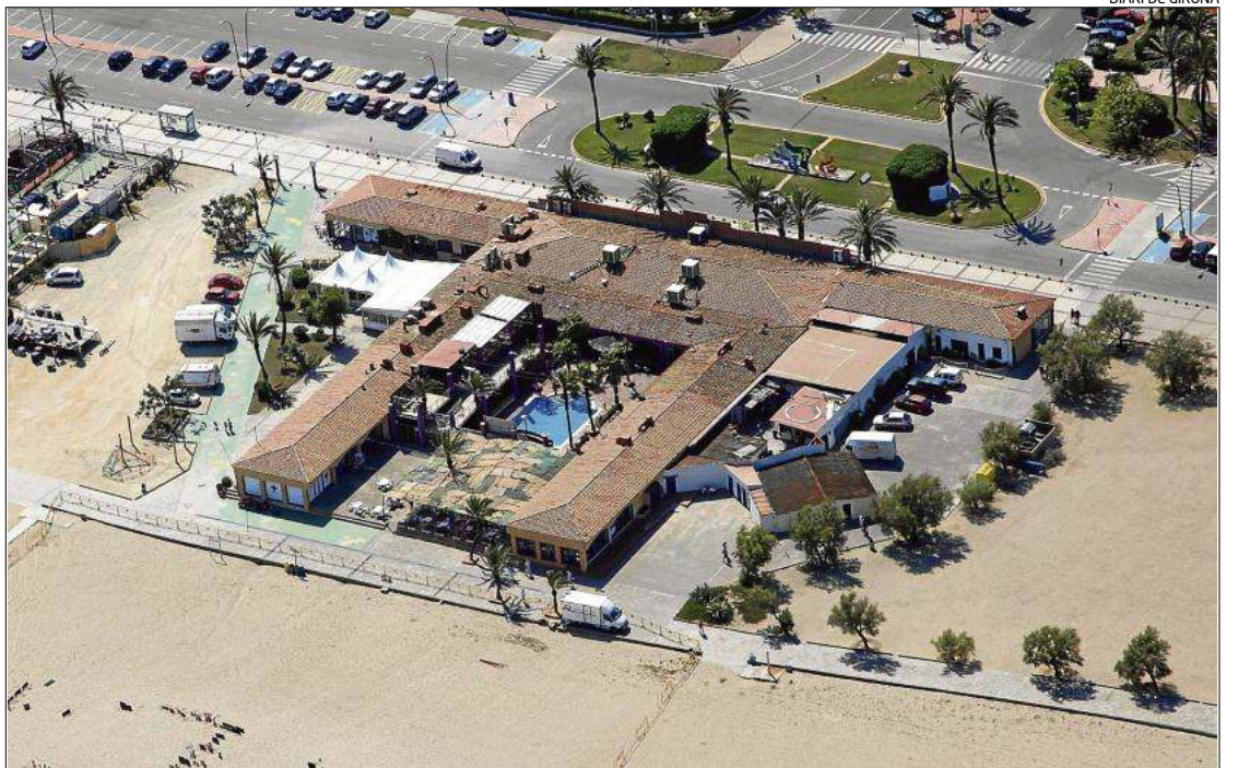
Part dels edificis del passeig d'Empuriabrava que podrien salvar-se de l'enderroc.

La Generalitat que actualment és qui té competències sobre el front litoral va ordenar el tancament definitiu fa uns mesos de les activitats del passeig. A més, va donar llum verda al pla d'usos de la platja i el passeig que gestionarà