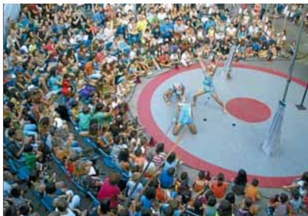
Un moment de 'Cabaret Elegance', a l'EscèNit ■ EL PUNT

La programació de circ, rebuda també com la resta