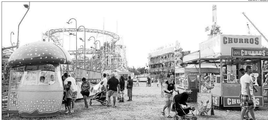
El parc infantil de Roses, situat a peu de la C-260, a l'entrada de la població.