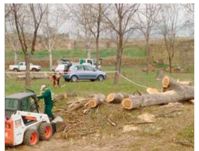
Els operaris talant els arbres ahir a Roses

i respon a la necessitat de cuidar l'entorn i potenciar el valor paisatgístic de la Ciutadella." L'alcalde va xifrar en 25 el nombre d'exemplars afectats, i els va contraposar als "més de 4.000 que els diferents governs de CiU han plantat a Roses". ■