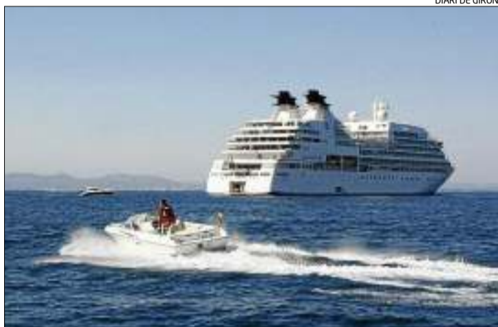
El primer creuer que va estrenar el 2012 la temporada estable.