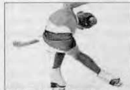
El trofeu Ciutat de Barcelona acollirà patinadors i patinadores de vuit països diferents

Les categories que hi prendran part són escola, debutants, benjamí, juvenil, veterans, alevins, mínima, infantils, infantils B, júnior 3a, debs, categoria 2a, novice advance, júnior ISU i sènior ISU.