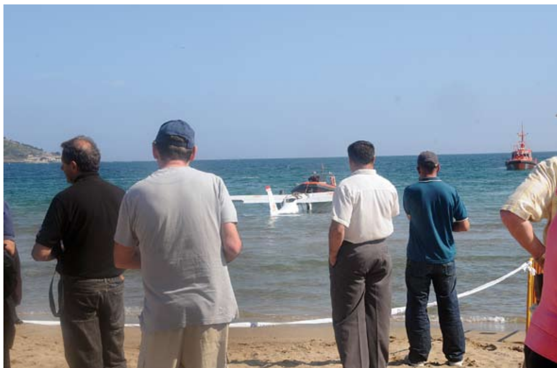
EXPECTACIÓ I ANGOIXA. A la platja del Salatar aquest dimecres