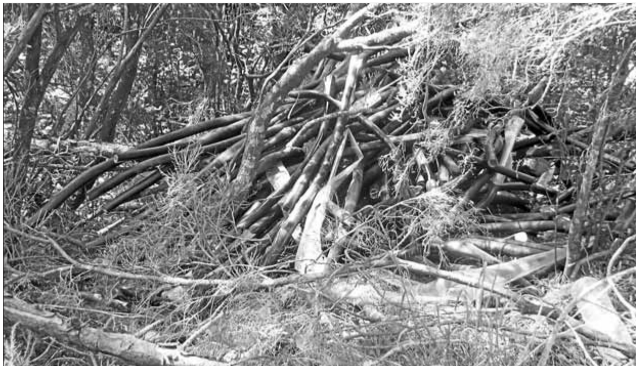
Els lladres van pelar els cables, van retirar el coure i van abandonar el plàstic en una zona boscosa de Romanyà

Els lladres de coure comencen la seva temporada de robatoris de cables telefònics a les comarques gironines. Des de dijous de la setmana passada ja han saquejat tres vegades les instal·lacions de Movistar a Santa Cristina d'Aro. En total s'han endut poc més d'1,5 quilòmetres de cable, material valorat en uns 15.000 euros, però la reposició del qual en costarà uns 28.000. El robatori va deixar incomunicada la urbanització Sant Miquel d'Aro i part de Bell-lloc. El primer robatori va tenir lloc dijous de la setmana passada, al quilòmetre 1,4 de la C-65, davant del Càmping Santa Cristina, on els lladres es van endur 250 metres d'un cable valorat en 4.000 euros. Cinc dies més tard, el 8 de maig, els lladres se'n van endur 150 metres en el mateix lloc, a la C-65, però aquest cop al punt quilomètric 1,6. L'últim es va produir dimecres, quan els assaltants es van tornar a enfilar als pals telefònics i a la GIV-6613, a tocar de Romanyà, i es van endur de dos trams un total d'1,2 quilòmetres de cable de coure telefònic. El valor del material és d'uns 7.800 euros, però la repo-