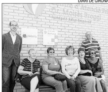
La donació ahir al matí.