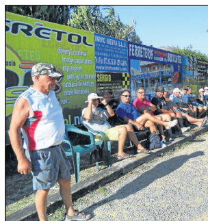
Un public attentif