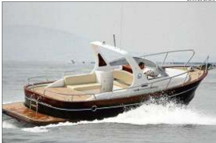
L'embarcació, tripulada pel gerent de l'empresa Ramon Girbau.