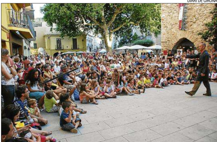
Un dels espectacles adreçat a infants ple a vessar.

L'Ajuntament de Roses entén que és impensable en qualsevol altra població com Girona o Figueres permetre que els vehicles dels músics estacionin a la Rambla. Justament, a Figueres, els músics d'una altra cobla van decidir aturar una actuació al Teatre El Jardí perquè la Guàrdia Urbana es disposava a retirar-los els vehicles que estaven estacionats a la plaça Josep Pla davant del teatre on està restringit. En aquella ocasió van demanar al públic què preferien, si suspendre l'audició, o bé esperar que els músics retiressin els vehicles per estacionar-los. El públic va optar per la segona opció i en aquell cas van poder estacionar en un quart d'hora.