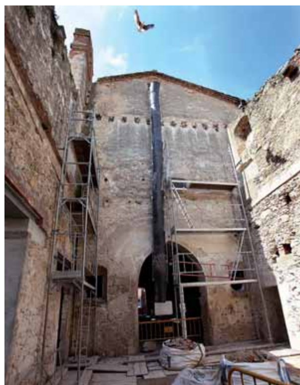
Una imatge de l'interior del convent dels Caputxins de Figueres, que s'ha de convertir en un auditori

De les inversions que s'havien de fer l'any 2011 i no es van fer, destaquen sobretot, pel seu import, les obres del carrer Pep Ventura i les contribucions especials, després que s'hagi acordat amb les veïns deixar la intervenció per més endavant. Sumen més de mig milió d'euros. ■