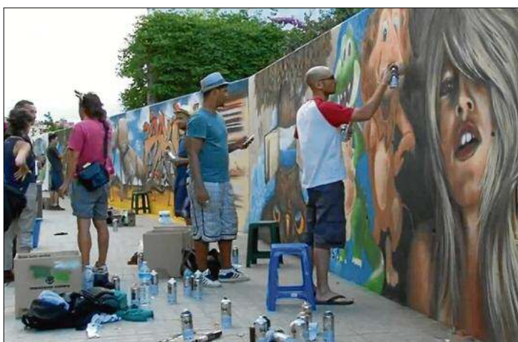
Els artistes dissabte fent les creacions a la paret del Rec Arnau.

disciplines van rebre centenars de persones omplint els diferents espais on se celebraven i aconseguint l'objectiu que s'havien marcat. L'organització del festival que ha comptat amb el suport de l'Ajuntament i la Diputació de Girona considera que ha tingut un molt bon acolliment tant per part de turistes com de veïns.