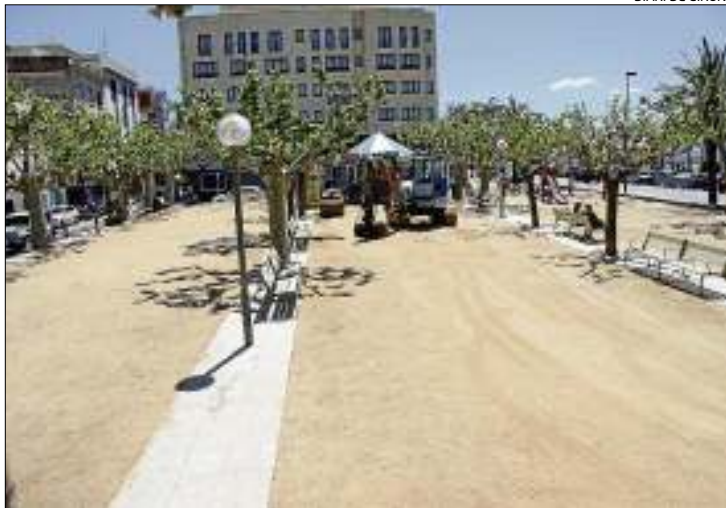
La plaça Catalunya, a la vorera de la qual es va estacionar.

El govern de Roses s'ha mostrat molt molest per la situació perquè considera que només està justificat estacionat en el cas del músic que per dimensions de l'instrument necessita descarregar-lo a