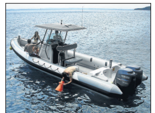
Plaisir et découverte

Et vous? Pourquoi ne pas les imiter? Venez et profitez-en aussi accompagné de votre famille, de vos enfants ou bien d'amis. Nautamarine, sur le port de plaisance de Roses, met à votre dispo-