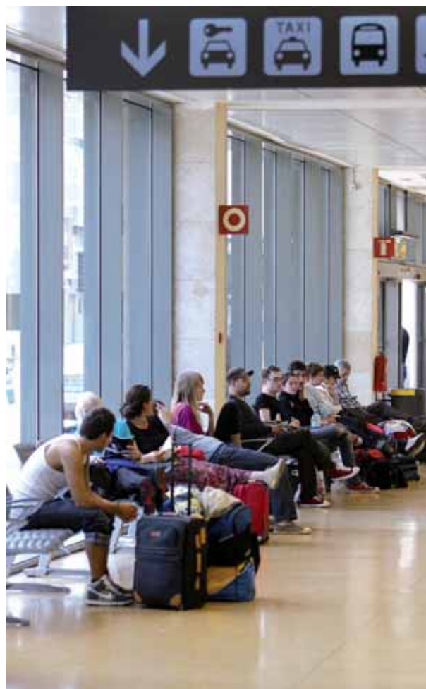
Viatgers a la terminal d'arribades de l'aeroport de Girona, en una imatge d'arxiu

En aquest sentit, Carvalho ha explicat que Wizz