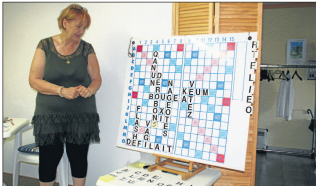
Un vrai GPS (Grande Professionnelle de Scrabble)