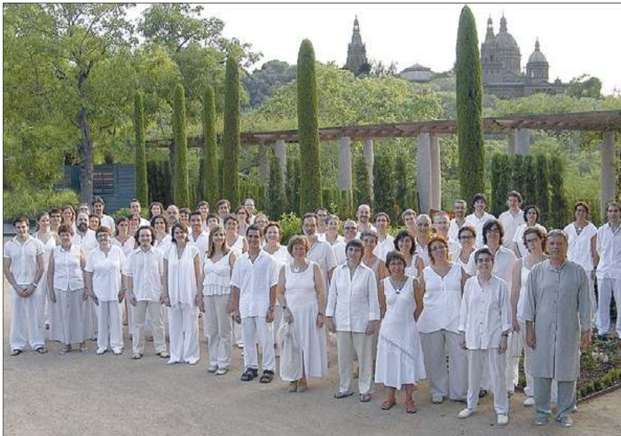
►► La Coral Cantiga interpreta un doble programa: 'La mar' i 'La tonalitat de l'infinit'.