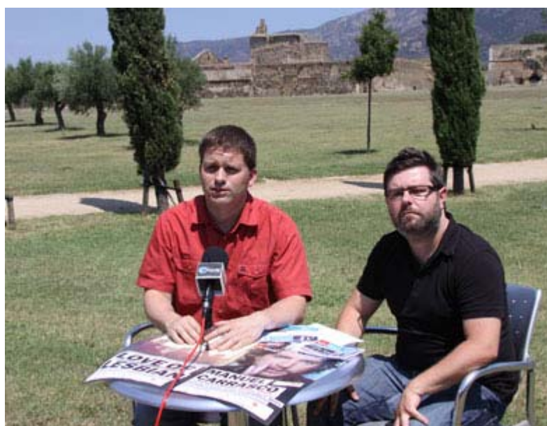
Balanç positiu de la primera part del festival.