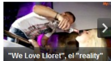
"We Love Lloret", el "reality"