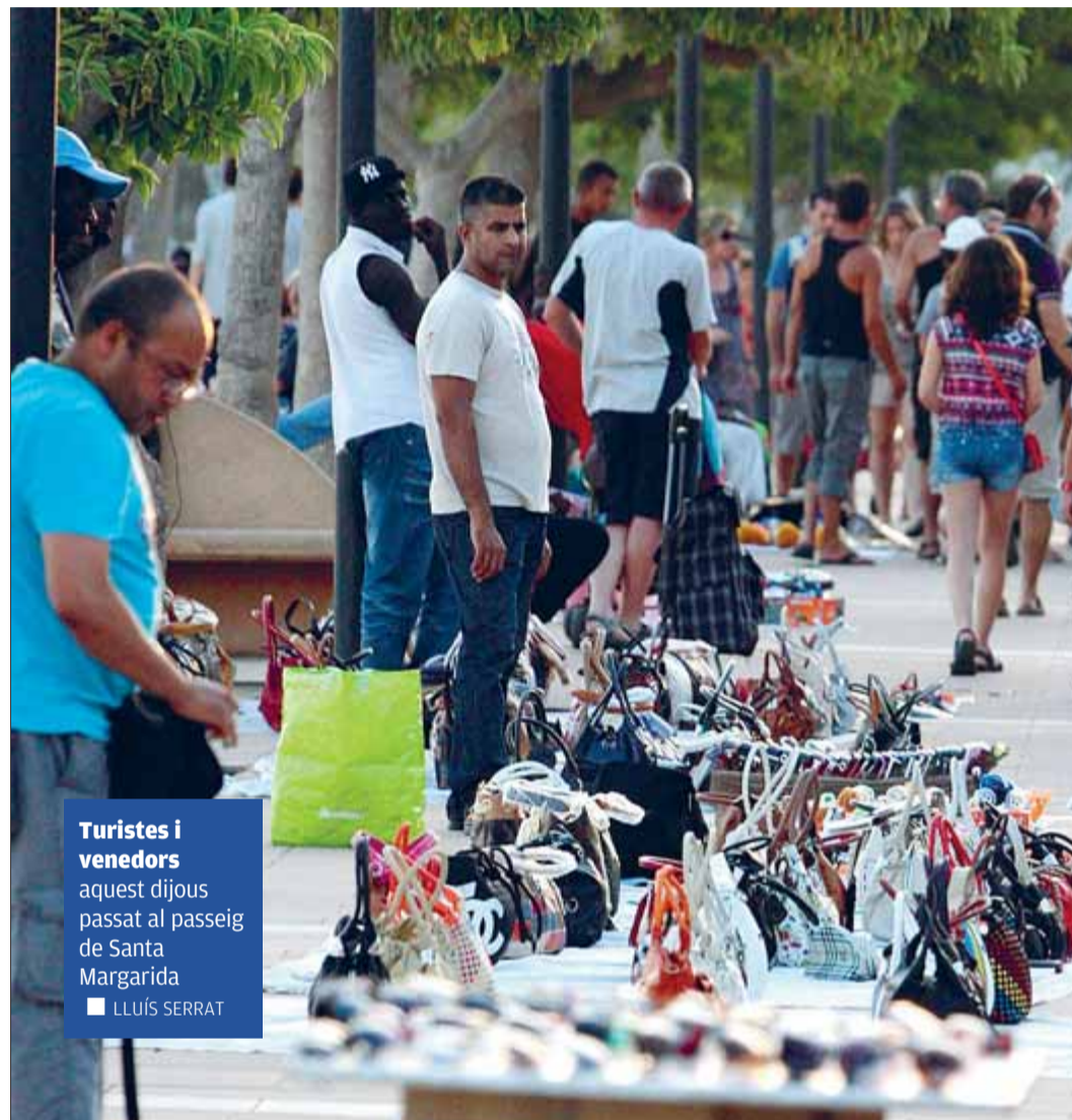
Turistes i venedors aquest dijous passat al passeig de Santa Margarida