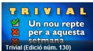
Trivial (Edició núm. 130)