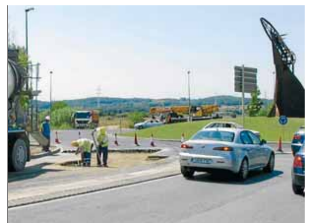
Un operari, treballant a l'avinguda de la Pau, a tocar de la rotonda Mururoa

tensa. També s'estava treballant al camí del Sitjar que, en aquest cas té poc trànsit i, per tant, no va provocar problemes. Les obres són una compensació de la UTE del TAV per tots els camions que han usat els carrers de Salt els darrers anys. ■