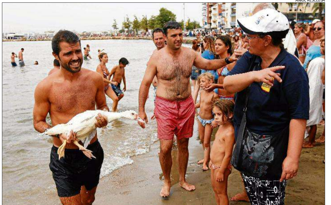
Unes 200 persones van empaitar ànecs a la platja de La Punta de Roses.