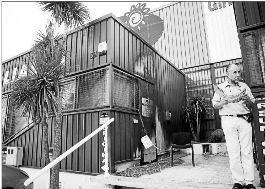
L'exterior de l'edifici, situat a Santa Margarida, no va quedar malmès per les flames. La porta d'accés, cremada.

De fet, no es van cremar ni ordinadors ni d'altres material valuós però ahir lamentava que el fum ho hagués impregnat tot. Un dels punts amb més afectació era la porta d'entrada, visiblement cremada des de l'exterior. També es van incendiar unes cortines, un sostre i d'altres desperfectes lleus