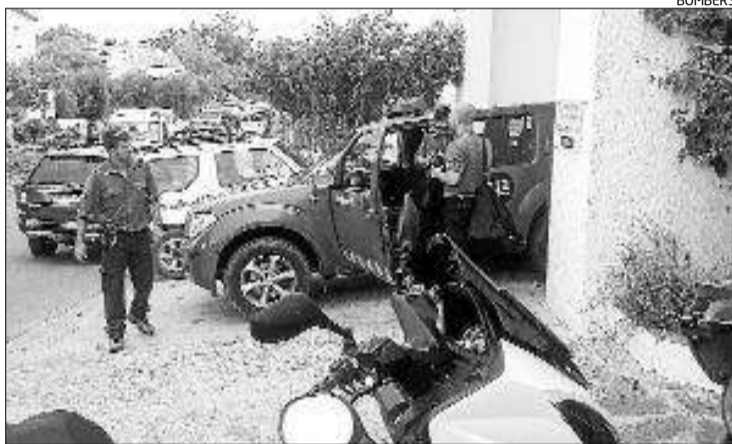
Els equips de recerca i l'home desaparegut (requadre).

També es va avisar vigilants de seguretat i es van repartir cartells a