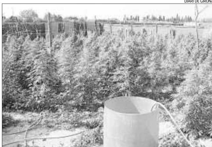
La plantació que els Mossos van localitzar al municipi.