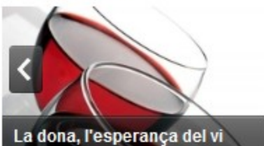
La dona, l'esperança del vi