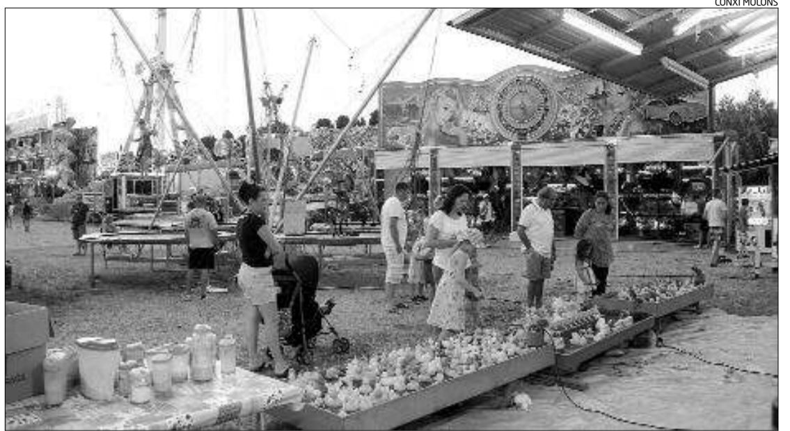
El parc d'atraccions que va començar a funcionar sense disposar de tots els permisos.

Fonts policials i municipals asseguren que es tracta del primer cas d'assalt d'aquesta mena a la zona.