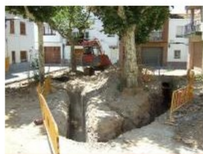
Roses no recuperarà el refugi antiaeri que hi ha al subsòl de la plaça Prim perquè està molt deteriorat

L'Ajuntament de Roses (Alt Empordà) no recuperarà el refugi antiaeri descobert al subsòl de la plaça Prim perquè està molt deteriorat. Un informe rebutja rehabilitarlo, perquè els murs estan molt malmesos, el passadís és massa estret i el seu estat de conservació no ho fa aconsellable. De fet, gran part del passadís no té sostre, perquè les arrels dels arbres o les obres d'edificis que s'han fet a la plaça l'han enrunat. Per això, després d'estudiar-lo, s'ha tornat a recobrir de terra i, aquest mes de setembre, es reprendran les obres d'urbanització de la plaça. Tot i això, ara el consistori es planteja senyalitzar aquest vestigi de la Guerra Civil un cop es col·loqui el nou paviment a l'espai.