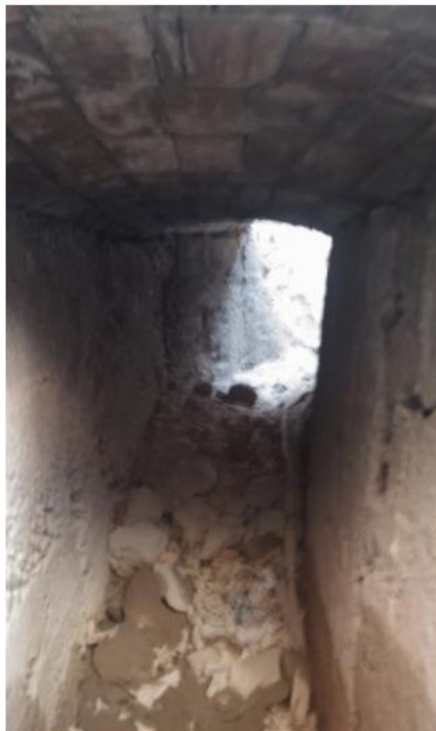
L'interior del refugi antiaeri de la Guerra Civil que hi ha al subsòl de la plaça Prim, i que ara s'ha tornat a recobrir Ajuntament de Roses

No obstant això, l'Ajuntament es planteja incloure en la urbanització de la plaça alguna actuació urbanística que marqui en el paviment el traçat del refugi, així com les seves entrades. A més, també estudia col·locar un panell informatiu que testimonii la seva existència i història.