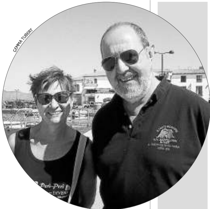
ORIGEN: BARCELONA ESTIUENEN A: EL PORT DE LA SELVA