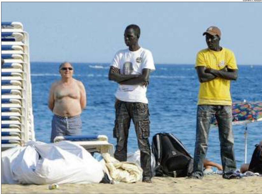
Els venedors ambulants al llarg del passeig marítim de Roses.

Quan els agents de la Policia Local veuen venedors al passeig, se'ls acostia, se'ls aixeca una acta administrativa per incomplir l'ordenança i se'ls identifica. Tenen uns dies per demostrar que el material és de procedència legal -i retirar-lo, un fet que no passa mai. Si no el recullen, passat un termini legal durant el qual es publica al Butlletí Oficial de la Província per si hi ha alguna reclamació, i després es destrueix.