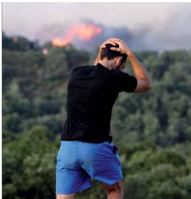
Una imatge del dia de l'incendi al sector de Boadella ■ LL. S.