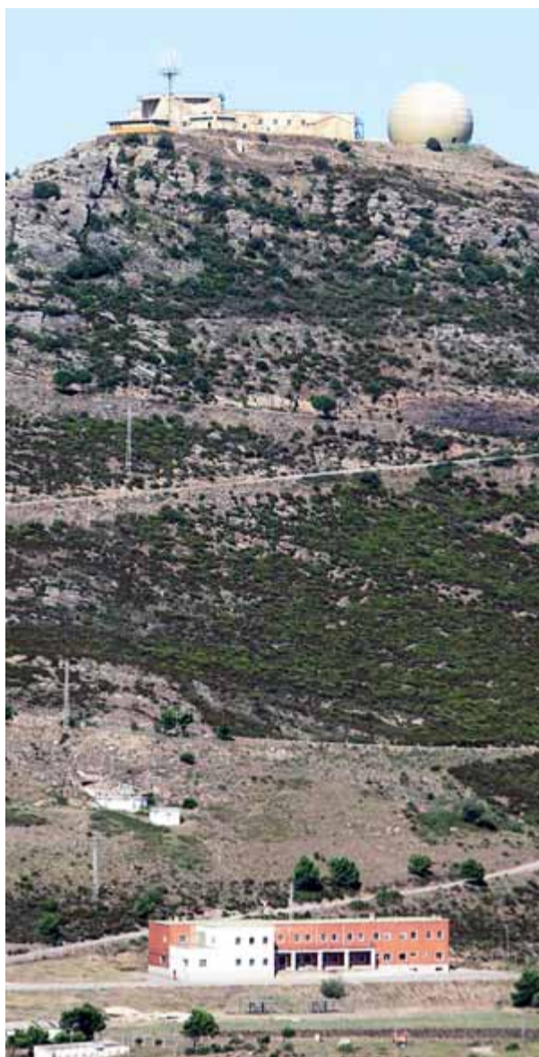
A la part baixa de la imatge, els edificis de la base militar del Pení que quedaran buits properament, quan el personal de la base es reagruparà a les instal·lacions de la carena, on hi ha el radar

Això significarà que els edificis al peu de la muntanya, al bell mig del parc natural, al terme municipal de Roses i a mig camí de Cadaqués, quedaran buits. “Es tracta d'edificis en perfecte estat, però que es degradaran si queden inutilitzats. Per això ens anticipem i fem aquesta proposta de posar-los a disposició del parc, tot i que continuarien sent de titularitat de l'Estat a través del Ministeri de Medi