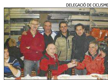
DELEGACIÓ DE CICLISME

■ Rafa Nadal va anunciar ahir que té «moltes ganes» de tornar a les pistes. Serà a Abu Dhabi, on a finals de mes es disputarà un torneig d'exhibició (del 27 al 29 de desembre). «Tinc moltes ganes de tornar a la pista, a Abu Dhabi. Vaig guanyar el Mundial de Madrid el 2009 i el 2010, aquest any m'agradaria aixecar un altre cop aquest trofeu», va confirmar a través de les xarxes socials. El mallorquí tornarà a competir el 28 de desembre contra el vencedor del duel entre Andy Murray i Janko Tipsarevic després d'estar retirat des del juny passat, quan va ser eliminat pel txec Lukas Rosol a la segona ronda de Wimbledon, per una lesió al genoll esquerre.