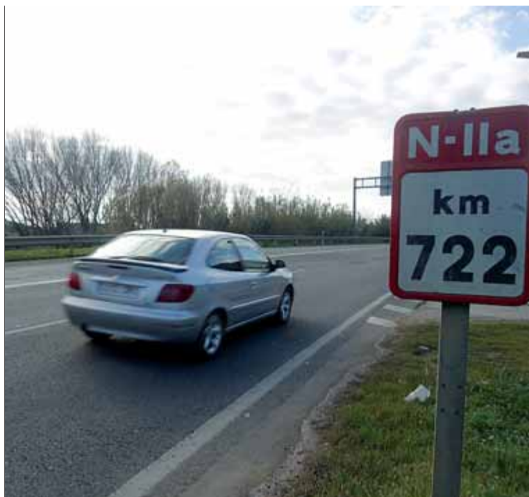
L'accident va tenir lloc ahir al matí en un tram per on abans passava l'antic traçat de l'N-II, a l'altura de Sant Julià de Ramis ■ MANEL LLADÓ / GISELA PLADEVAYA