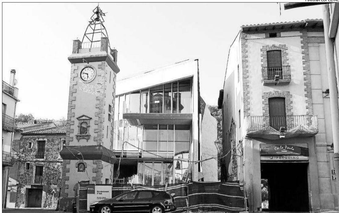
Imatge de l'edifici en obres, i encara sense sentència ferma, el mes de setembre del 2010.