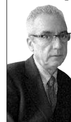
Juan José Millás

Molts pensaran que el que es guanya en tolerància d'una banda es perd en rigor científic per l'altra. Però aquest argument estava bé quan creïem que la història era una ciència. Ara és un passatemp de ficció, com l'economia. No és que no es pugui predir el que passarà, és que ja no hi ha manera de postdir el que ha passat. Per part meua, em complauria molt figurar en algun manual com l'autor de La metamorfosi . A qui faig mal?