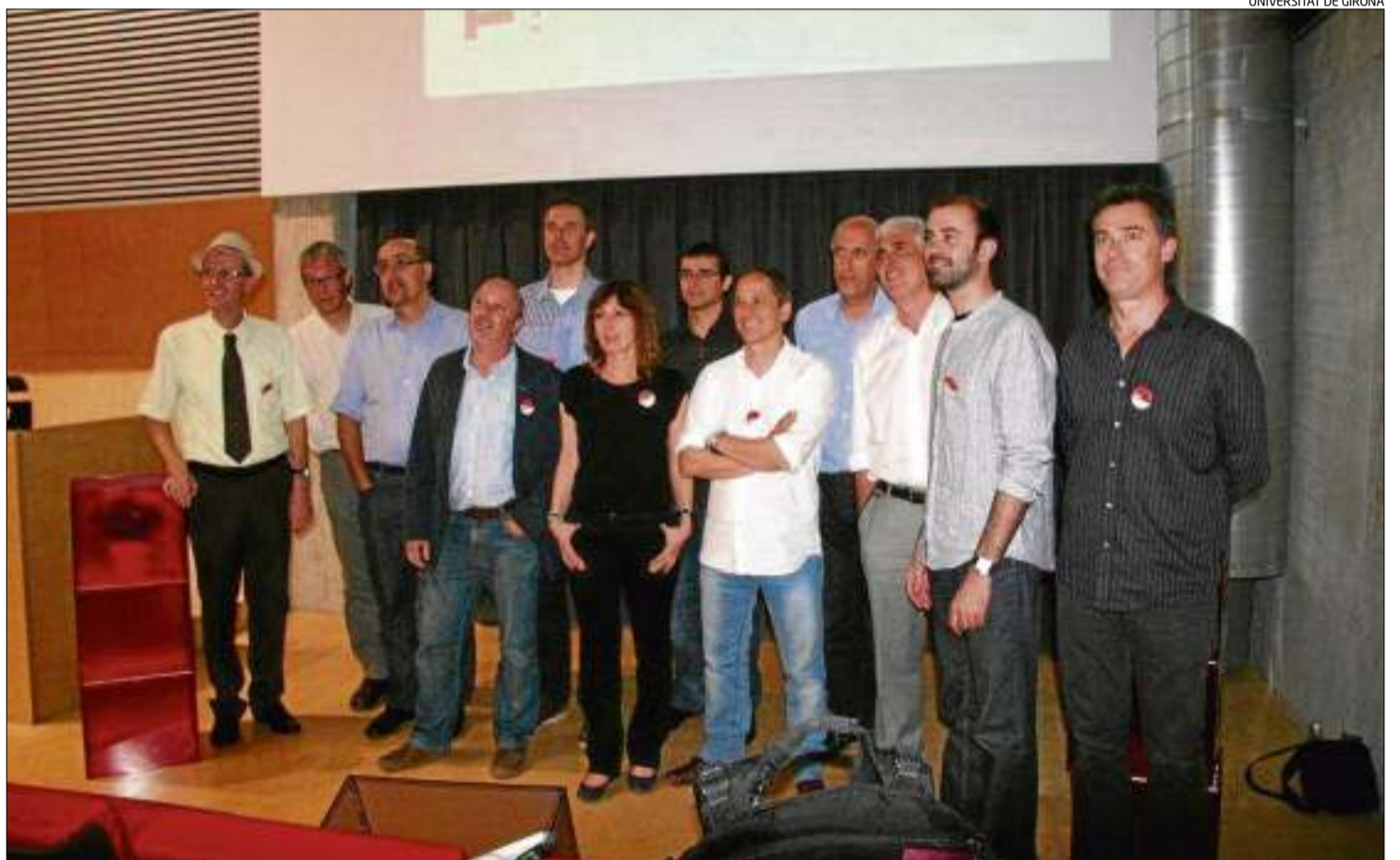
Els onze ponents del primer TEDxUdG que van compartir el seu coneixement a la xarxa des del Parc Tecnològic de Girona.

Però encara els devia sorprendre més que l'eminent cardiòleg expliqués que la demarcació de Gi-