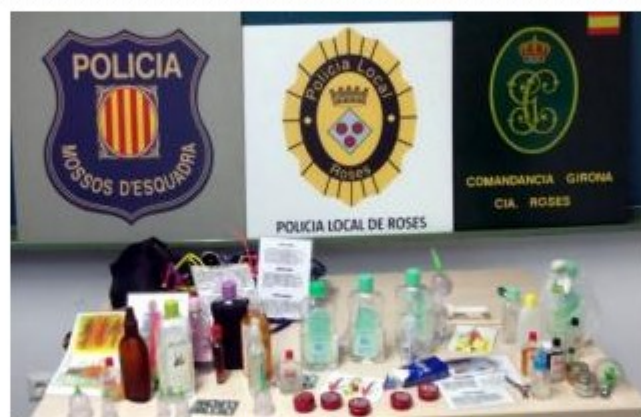
Comís de material a Roses Ajuntament de Roses

ACN Nou dispositiu policial per combatre el 'top manta' i els massatgistes il·legals a Roses. Un operatiu conjunt de Policia Local, Mossos d'Esquadra, Guàrdia Civil i CNP s'ha saldat amb una vintena de persones identificades i expedientades per incomplir l'ordenança que regula els usos i activitats permeses a les platges del municipi. A més, també els han decomissat el material. En total, han localitzat 12 massatgistes d'origen asiàtic, 2 persones del Senegal que feien trenes i 6 venedors ambulants -4 originaris de Bangladesh i 2 del Senegal-. Els 12 massatgistes encara estan a comissaria a l'espera d'identificar-los i comprovar que tinguin els permisos en regla.