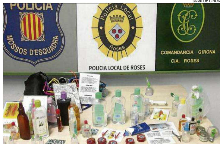
DIARI DE GIRONA

L'actuació se centrava ahir en l'activitat de massatges a les platges, que es considera que suposa un perill per als usuaris perquè la porten a terme persones sense la formació adequada, ni cap tipus de control ni garantia sanitària. Segons han informat, van detectar dotze massatgistes d'origen asiàtic practicant els massatges en diferents punts de les platges, dues persones del Senegal que feien trenes, i sis