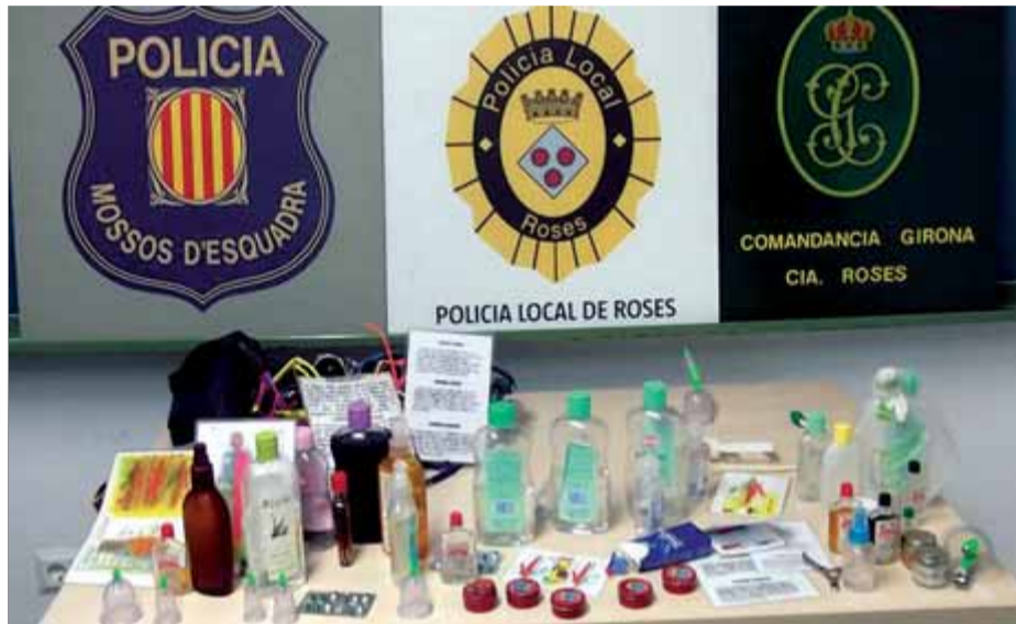
Els productes que van comissar els cossos policials ahir a Roses

Els agents es van situar a les platges urbanes del terme municipal de Roses -des de la bocana de Santa