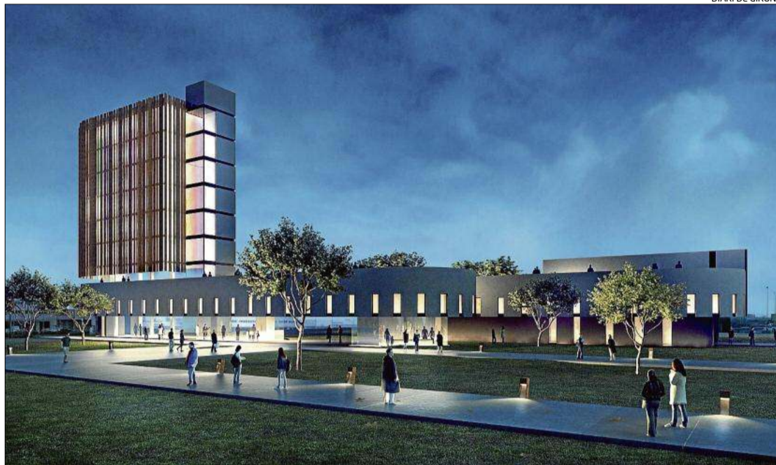
Les imatges virtuals de la proposta presentada per CiU durant la campanya electoral.