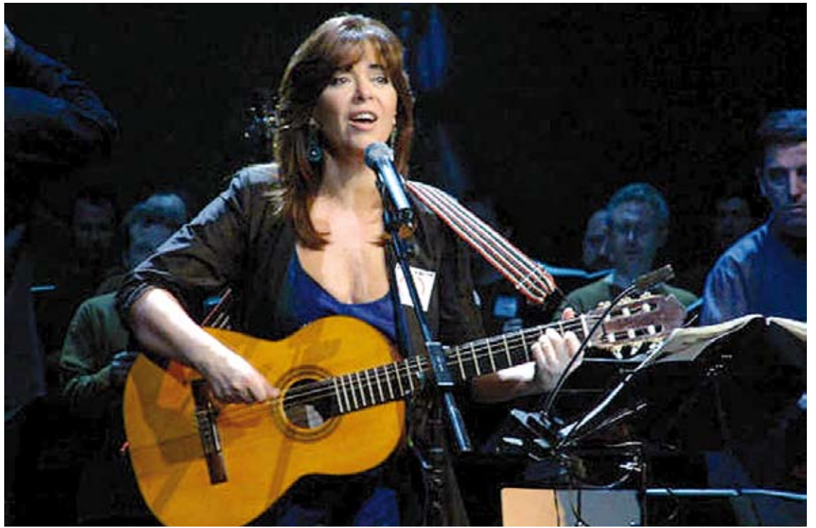
LA BONET. L'artista presenta els seus grans èxits aquest vespre a Vilafant

El grup de mariachis Viva México és la tercera aposta del cicle. Es tracta d'un quartet de músics acompanyats de ballarins que presenten l'espectacle "Ándele". El concert serà el 27 de juliol (22 h) a la plaça de les Hores. L'entrada també serà lliure. ■