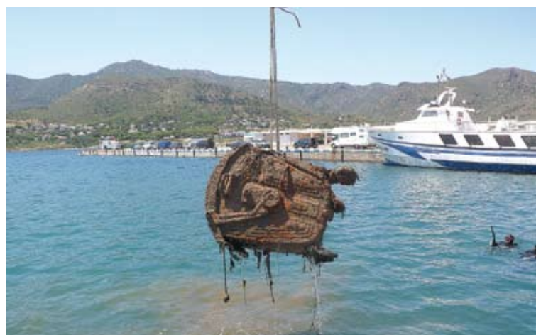
LITORAL PROPER. L'actuació es va fer a la zona portuària, l'escullera i la bocana HN