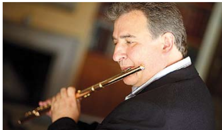
ARIMANY. El flautista, fidel a la tradició, torna a Sant Pere de Rodes HN