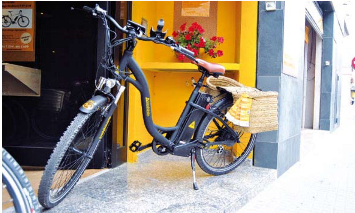
DISSENY. La Burricleta té un disseny retro però alhora modern i incorpora dues sàrries per portar equipatge

Es tracta d'una e-bike elèctrica amb un sistema GPS instal·lat per tal que l'usuari estigui situat en tot moment i pugui seguir una ruta establerta. A més, aquest dispositiu funciona com una audioguia en diferents idio-