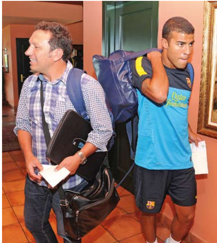
ARRIBADA. La comitiva del Barça B dimecres a TorreMirona

■ Cada estiu algun dels clubs de la Lliga de Futbol Professional (LFP) es decanta per l'Alt Empordà per fer-hi la seva primera estada de pretemporada. Per la comarca hi han passat durant anys l'Espanyol, el Vila-real, l'Almeria, el Girona, el Barça B i d'altres clubs internacionals, tots ells atrets per les instal·lacions de l'Hotel Golf de Peralada o del TorreMirona Golf & Spa Resort de Navata. Aquest any repeteixen l'Espanyol -la seva estada a Peralada ja s'ha convertit en una tradició estival- i el Barça B, que per segona vegada consecutiva ha es-