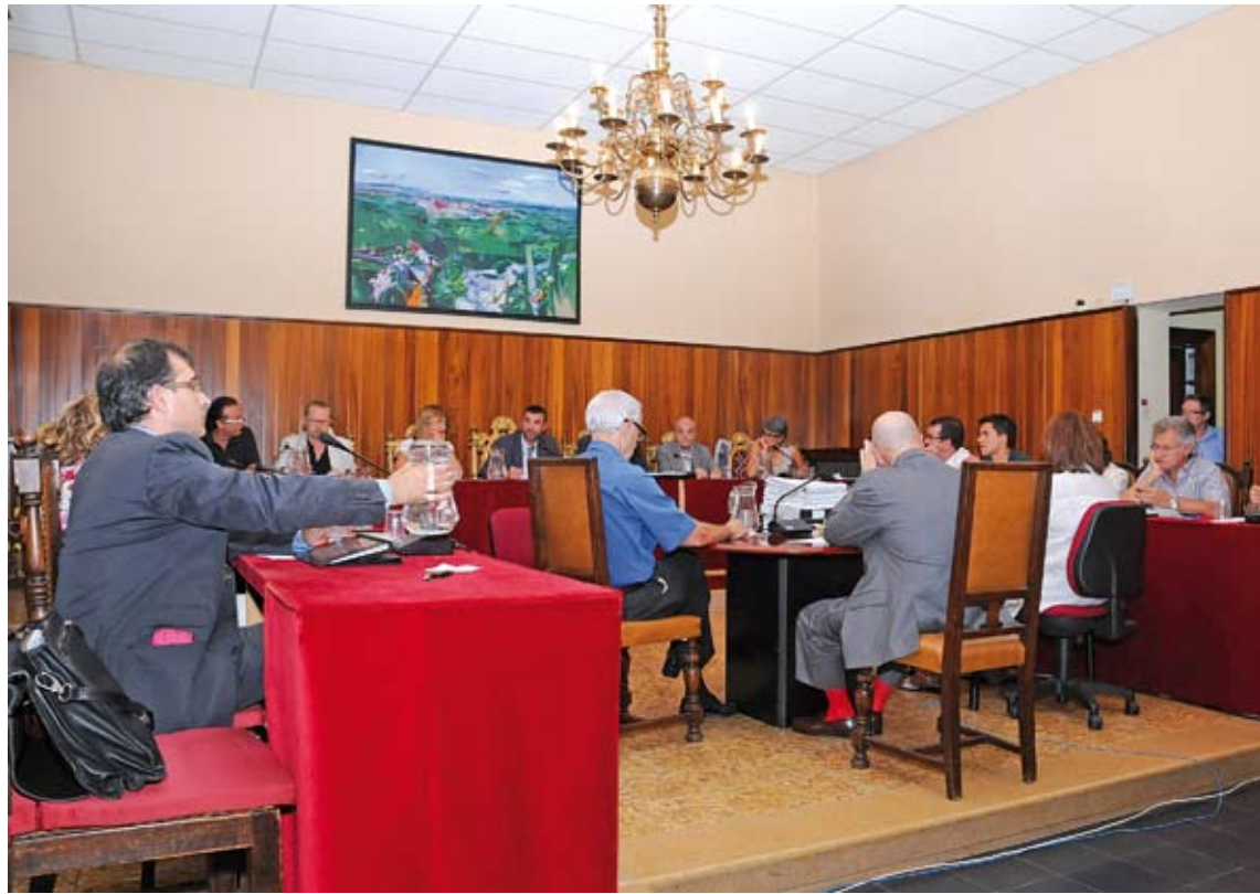
CADIRES BUIDES. A partir del 2015 el saló de sessions figuerenc tindrà sis cadires buides, en passar de 21 a 15 regidors ÀNGEL REYNAL

A la pràctica, però, si a les eleccions del 2015 -que és quan entra-