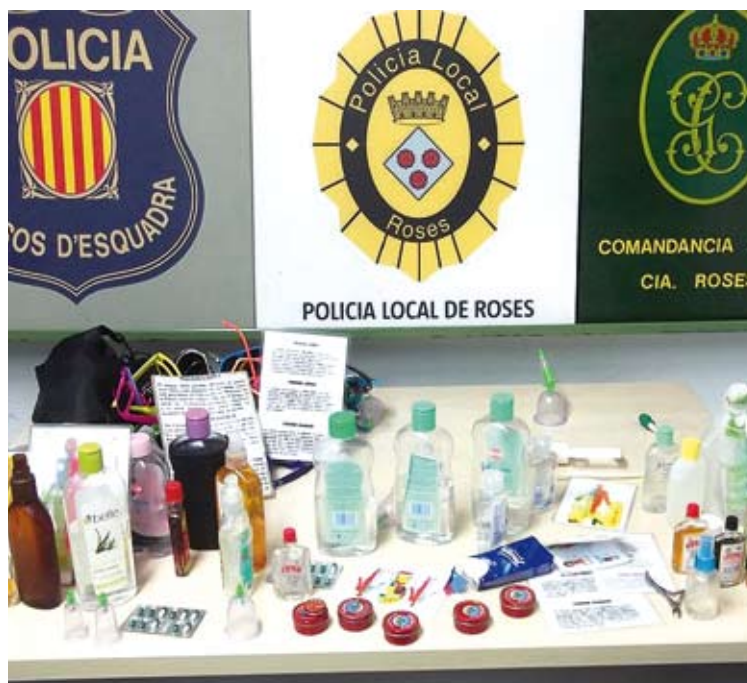
COMISSAT. Hi havia tant articles per vendre com productes cosmètics HORA NOVA

Durant el dispositiu, els efectius policials es van centrar especialment a localitzar i denunciar les persones que fan massatges a la platja i cobren per aquest servei. I és que es tracta d'una activitat prohibida per la normativa municipal que ha anat proliferant en les darreres temporades turístiques i que representa un perill per als usuaris, ja que són realitzades per persones que no disposen de la titulació ni la formació corresponents, i sense cap tipus de control ni garantia sanitària. Per això, diversos efectius de paisà i uniformats dels quatre cossos policials es van distribuir per les platges urbanes del terme municipal (des de la bocana de Santa Margarida fins al port esportiu, així com a les platges de Canyelles i l'Almadrava) per tal de detectar