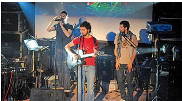
AMICS. La banda barcelonina segueix empenant auditoris arreu de Catalunya HN