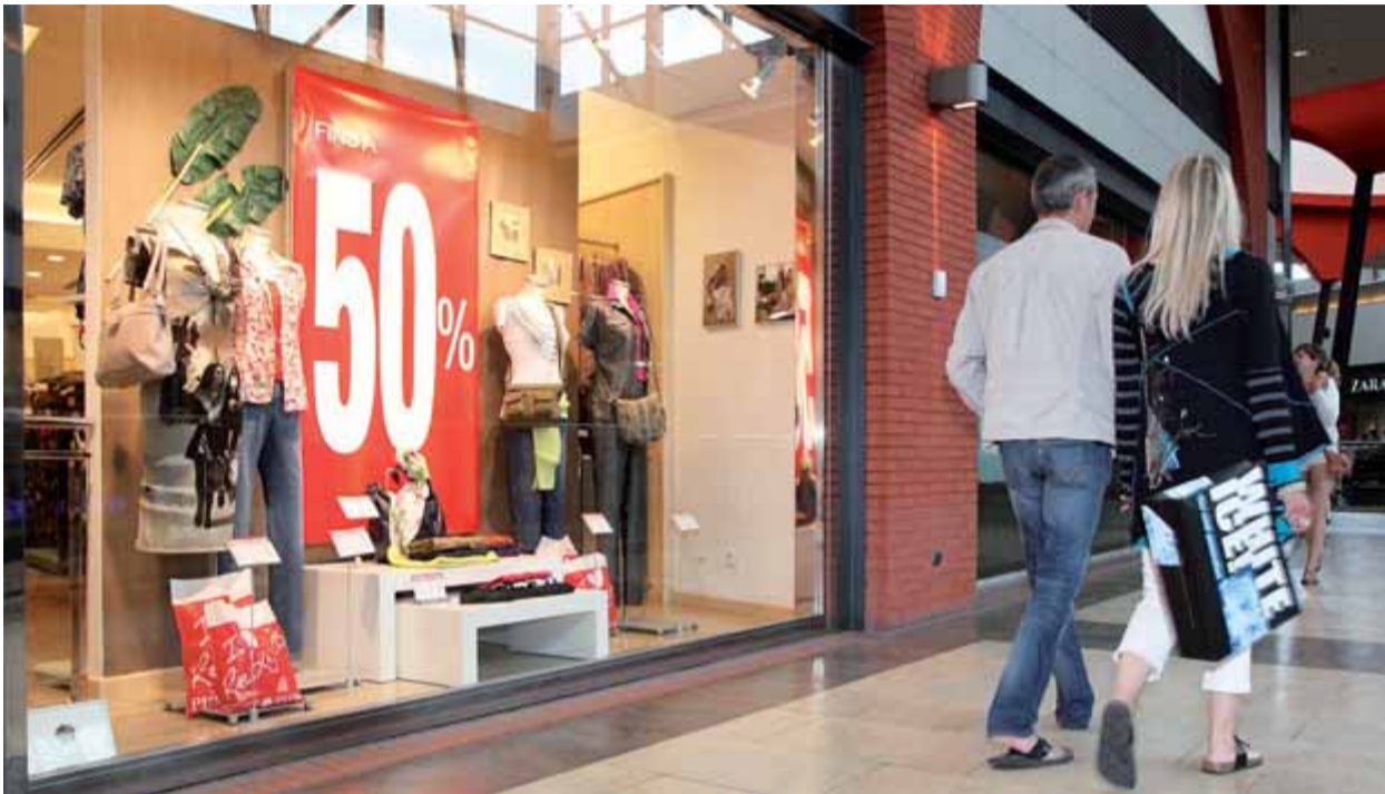
Un aparador d'una botiga de l'Espai Gironès, el primer dia de rebaixes, en què s'anuncien descomptes del 50% ■ JOAN SABATER