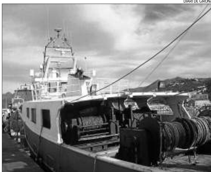
L'embarcació atracada al port pesquer de Roses.

La Gloria Mar Dos té 6,7 metres de màquena, 3,3 de puntal i un ca-