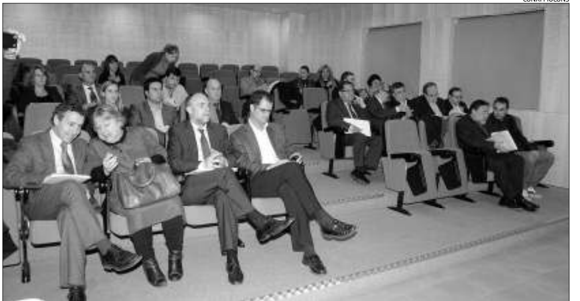
Els assistents a l'acte per abordar la situació econòmica.

l'observatori econòmic de la ciutat, els negocis del sector industrial van créixer un 4,17% al segon trimestre d'aquest any. També va haver-hi un increment en el nombre de turistes amb un 17% més de visites a l'oficina de turisme durant els primers mesos de l'any. «Hi va haver una davallada dels visitants de la resta del país però un augment d'un 50% de la resta del món i això és molt positiu pel sector», va afegir. En aquest sentit, el document de la situació a la comarca constata que el nombre d'establiments i places hoteleres a la comarca ha augmentat respecte de l'any anterior. En total, un 1,91% i un 1,61%, respectivament. Toro també va destacar que la