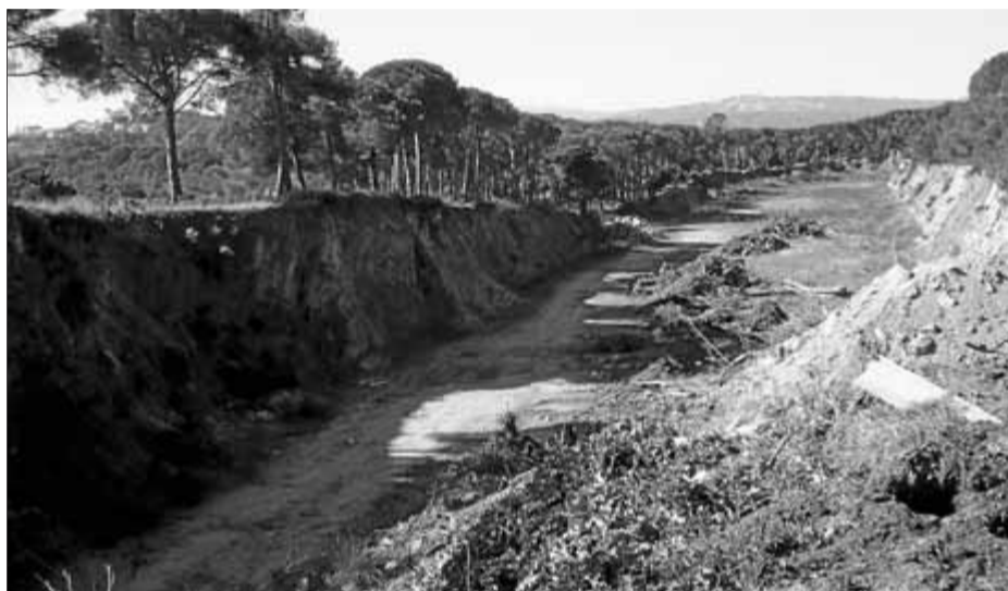
Els terrenys de la zona de les Serres de la Fosca on està previst l'hotel