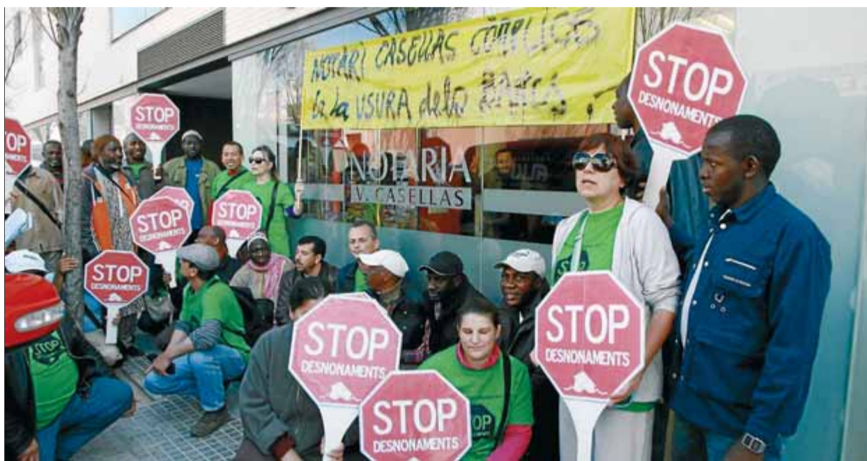
Acció de protesta davant la notaria de Salt ahir al migdia.

Fins a finals de gener es permetia que en les subhastes extrajudicials es pogués arribar a subhastar un pis –en tercera con-