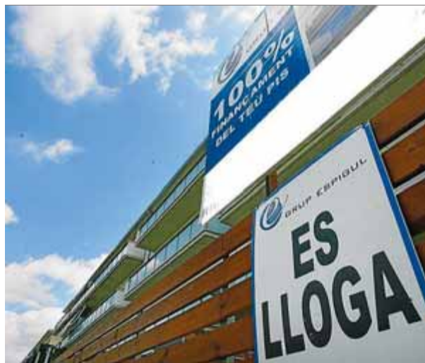
Anunci de pisos de lloguer a la ciutat de Girona en una fotografia d'arxiu

Barcelona, amb un preu mensual de lloguer de 12,16 euros/m 2 , només superat a tot l'Estat per Sant Sebastià, amb 12,41 euros/m 2 al mes. A tot Catalunya el preu de l'habitatge de lloguer va caure un 0,4% al febrer i la major caiguda va ser a Gavà, amb un 5,7%, una xifra que representa el major descens de l'Estat. ■