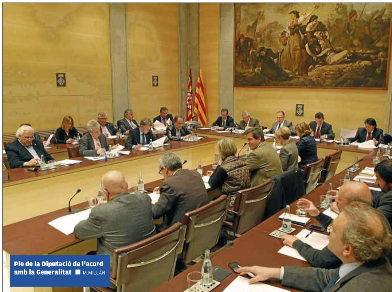
Ple de la Diputació de l'acord amb la Generalitat