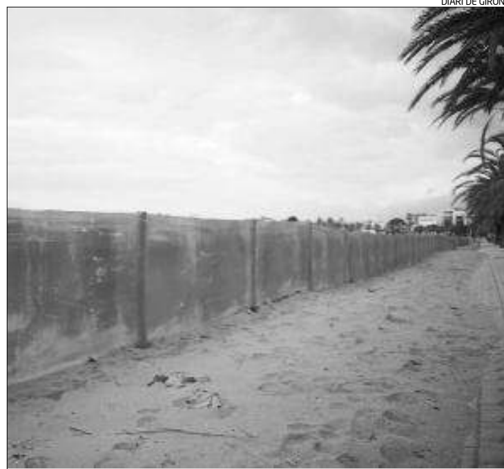
Les pantalles instal·lades per reduir l'efecte dels llevants.