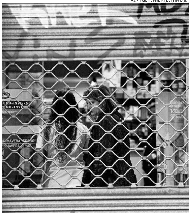
Clienta i botiguera a l'interior d'una botiga tancada al pas d'un piquet.