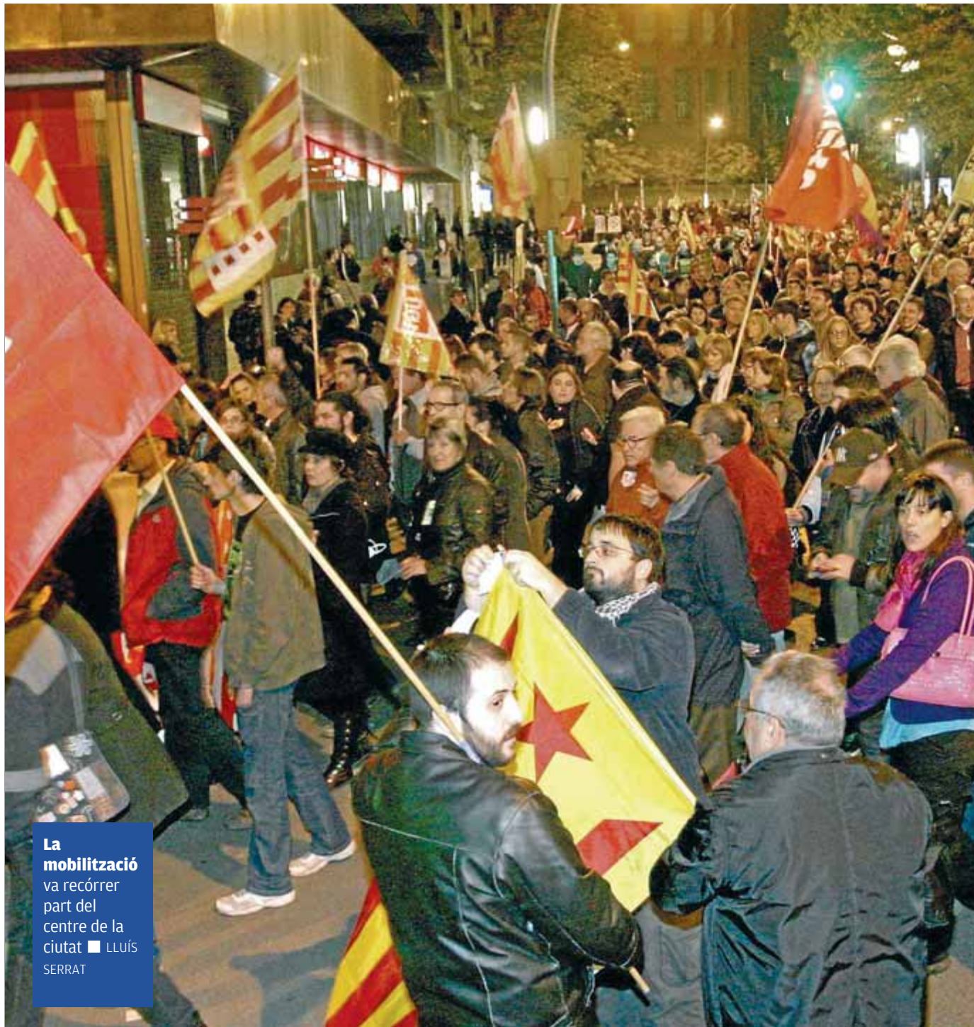
La mobilització va recórrer part del centre de la ciutat