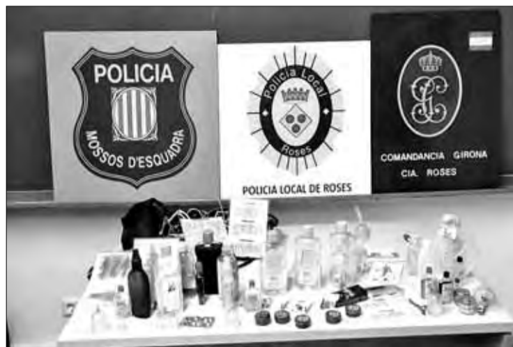
Una imatge del material commissat. EMPORDÀ