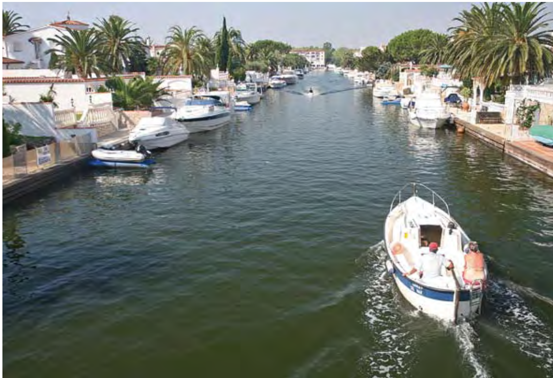
DESAFECTATS. Els propietaris d'Empuriabrava i Santa Margarida podran tornar a vendre cases i amarradors sense limitacions