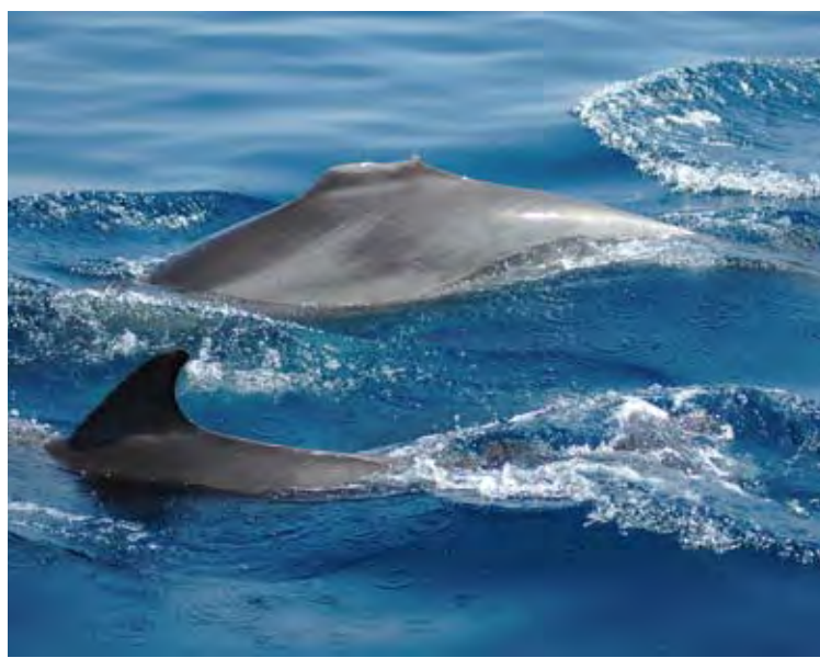
ELS EFECTES. Les hèlices d'embarcacions recreatives els fereixen les aletes

■ Els responsables del Projecte Ninam (plataforma d'estudi dels cetacis de la conca nord del Mediterrani) han iniciat una campanya per mentalitzar el sector nàutic i, en especial, la nàutica recreativa, del mal que estan fent als dofins mulars, que són l'única espècie que viu durant tot l'any a la Costa Brava. Per això han convocat una primera xerrada informativa que, amb la col·laboració de l'Associació de Naturalistes de Girona (ANG), impartiran dimecres al vespre (19 h) a la casa de cultura de Girona. Sota el títol "Els perills de la nàutica d'esbarjo: eines per garantir la protecció dels cetacis de la Costa Brava", a la sessió els oferiran informació sobre la situació actual d'aquests animals i els perills que pot comportar per a ells circular-hi massa de pressa.