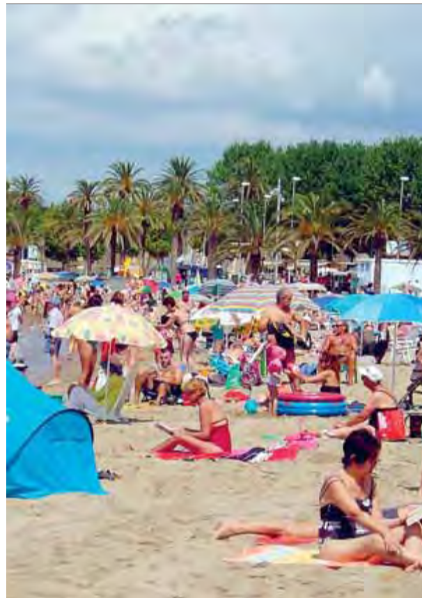
Pràcticament la meitat dels turistes que visiten Roses són de nacionalitat francesa ■ MAR VICENTE

Però a Roses no només hi ha turisme estacional perquè, segons Mindan, a la població hi ha uns 2.000 francesos que hi estan empadronats i "hi fan llargues estades al llarg de tot l'any". Això provoca una relació de convivència entre els veïns del municipi i els visitants francesos fins