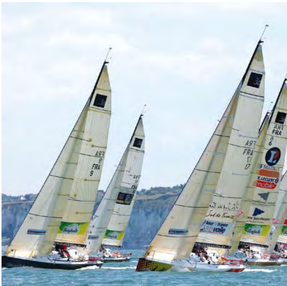
TOUR DE FRANCE À LA VOILE 2011.