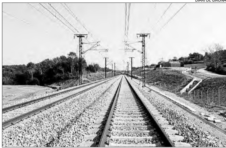
La catenària i la via ja estan muntades fins a Figueres.