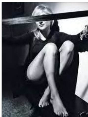
Melody Gardot actua dissabte; a la dreta Angela Meade, una de les veus de l'òpera.

El cartell de la 26a edició del Festival continua fent una aposta important per l'òpera amb «Il trovatore»