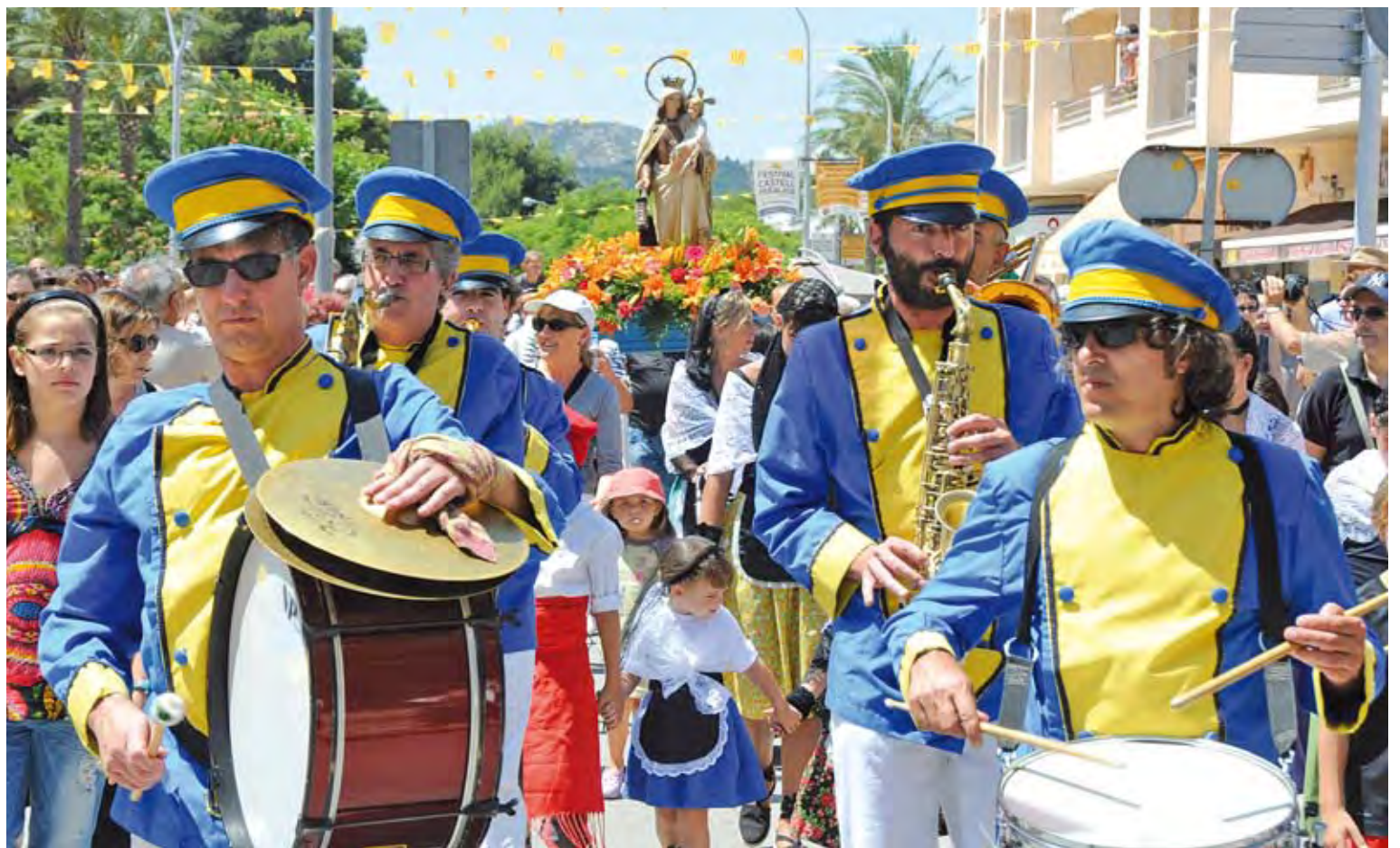
LLANÇÀ. Un any més, la processó del Carme de Llançà és un dels actes centrals de l'estiu