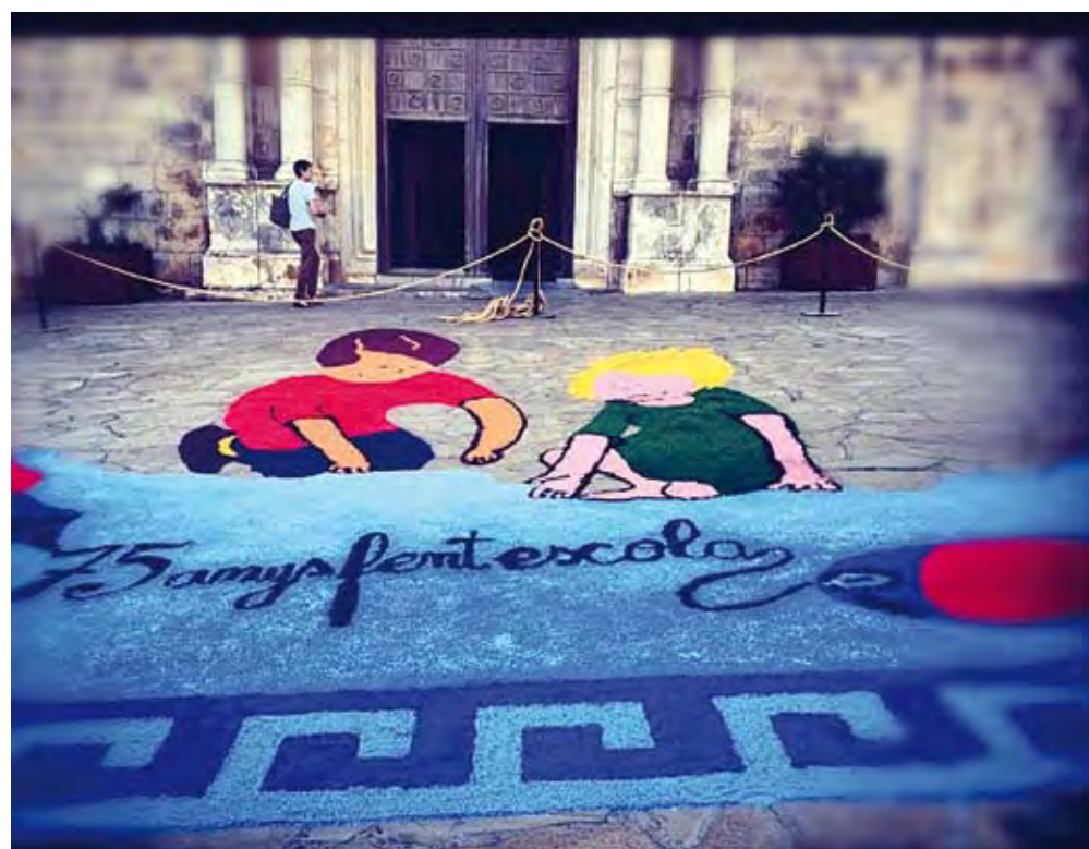
L'ESCALA. Catifa de sal a la Festa del Carme