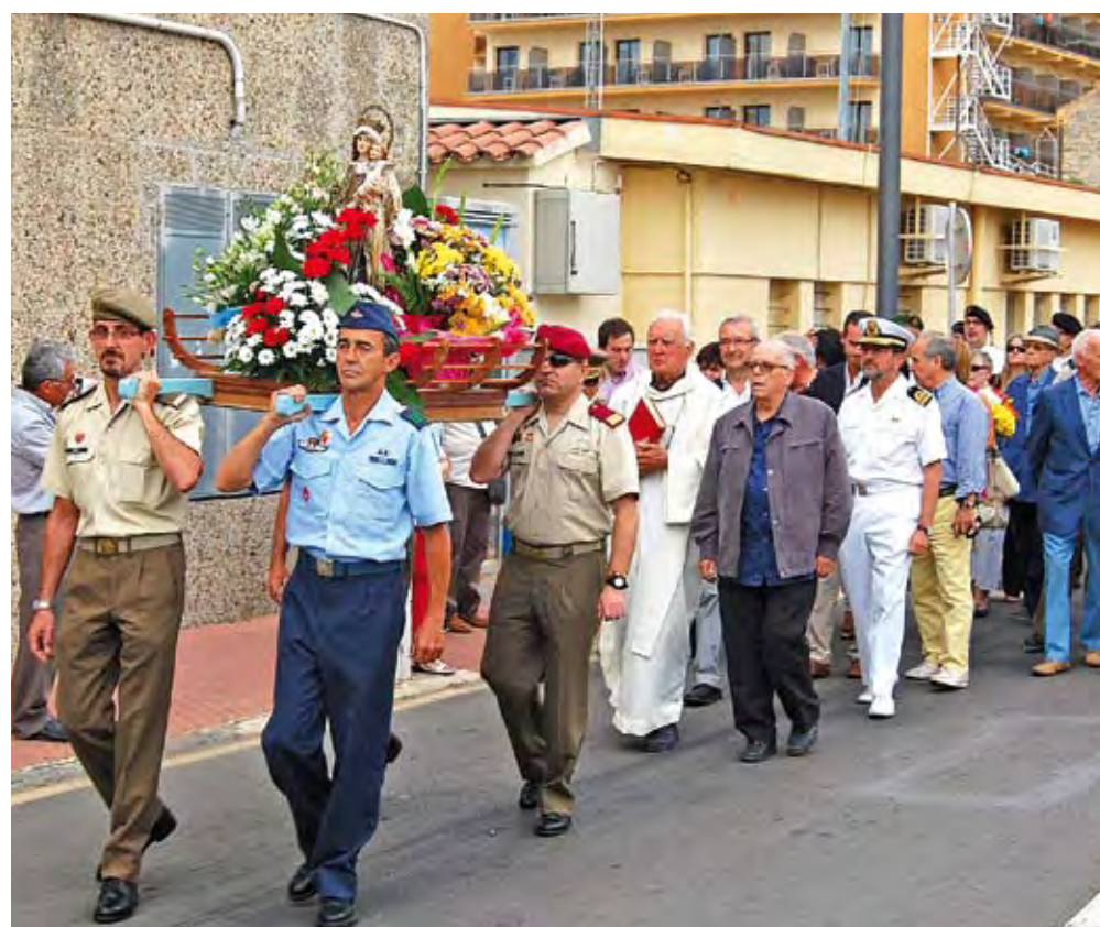
ROSES. Missa de la Verge del Carme i la processó, organitzades per la Comandància de Marina de Roses