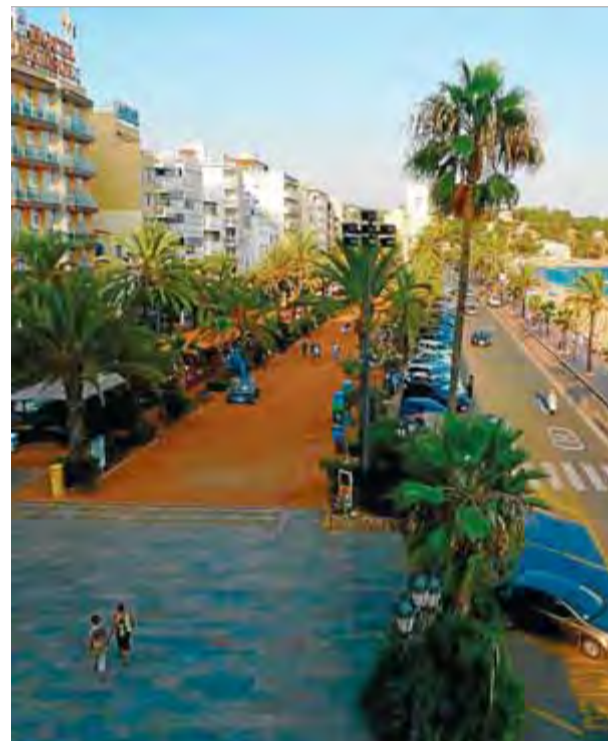
L'aparcament es volia fer sota el passeig però depenia del permís de Costes. ■ NURI FORNS

En tot cas, des de l'Ajuntament ahir ja van començar també a estudiar l'avantprojecte. L'alcalde Romà Codina va afirmar que està treballant amb el grup de CiU al Congrés, i no descarta visitar la direcció general de Costes a Madrid. Respecte l'aparcament, creu que ara es pot començar a trobar una sortida al projecte: "difícilment el farem en aquesta