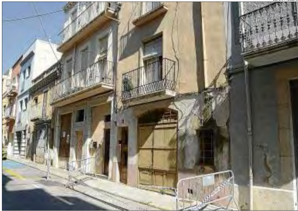
La casa de Figueres on s'ha ensorrat part del sostre d'un dels pisos.

L'ensorrament d'ahir es va produir a tres quarts de nou del matí quan un metre quadrat del sostre de la primera planta es va ensorrar. Al lloc s'hi van desplaçar dotacions de Bombers. Després d'una inspecció es va poder comprovar que no existien problemes estructurals del conjunt. Les dues persones que tenen l'habitatge en lloguer van haver de ser desallotjades i es va restringir l'accés a l'immoble. Serveis Socials es va fer càrrec dels desallotjats, que no havien patit ferides però que es van veure obligats a abandonar l'habitatge fins que es resolgui l'estat en què es troba. Segons va informar l'Ajuntament, es va concloure que els baixants d'aigua en mal estat hau-