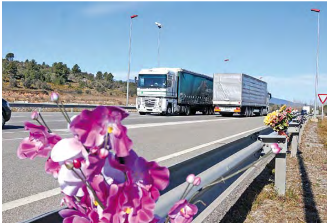
CORREDOR DE LA MORT. Així és com usuaris i polítics han batejat l'N-II al seu pas per l'àrea urbana

La protesta serà dimarts que ve, just abans del ple ordinari que hi ha convocat (a les 18 h). Els consellers comarcals es concentraran a davant de la seu de la institució (al carrer Nou de Figueres) i hi faran cinc minuts de silenci per recordar totes les víctimes mortals que s'ha cobrat aquesta via en els darrers mesos. Amés, aprofitaran per penjar una pancarta al balcó principal de l'edifici que preguntarà, precisament, “Quants morts més cal que hi hagi per fer el desdoblament de l'N-II?”. ■