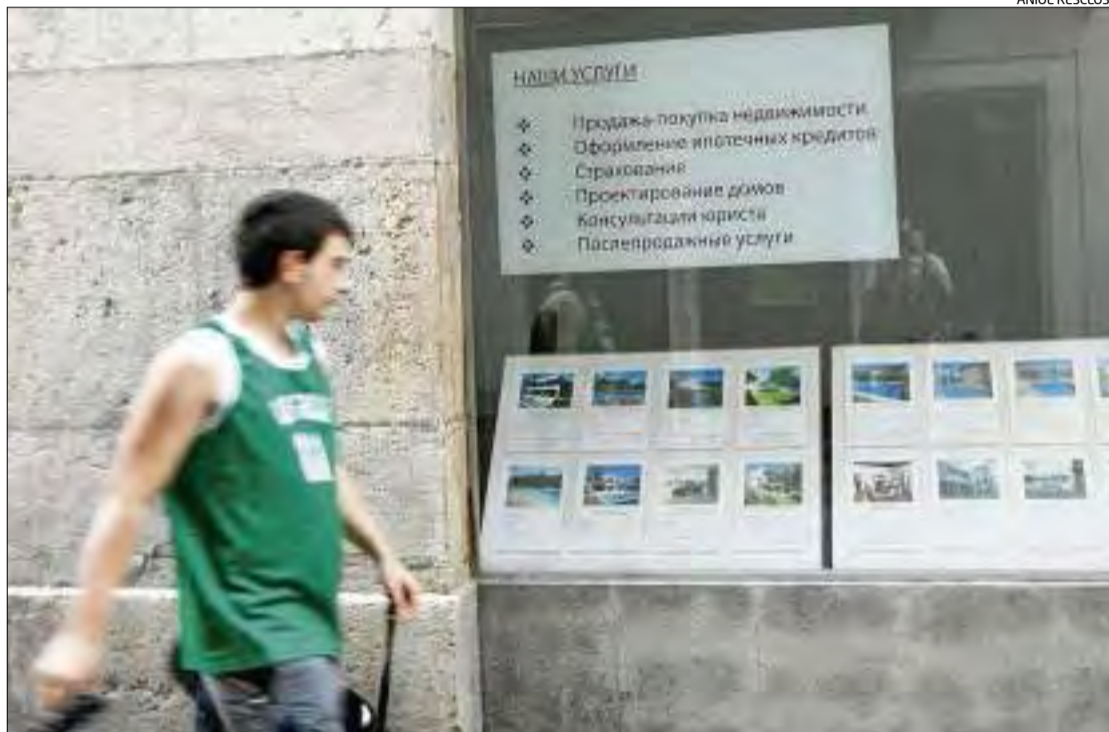
Immobil·liària de la ciutat de Girona que presenta les seves ofertes al litoral exclusivament en rus.

De les demandes realitzades, aproximadament la meitat s'acaben convertint en compres. Els API gironins posen alguns exemples, com ara el d'una immobiliària de Llançà que ha venut 30 apartaments en 10 dies; o una de Blanes que també ha efectuat importants