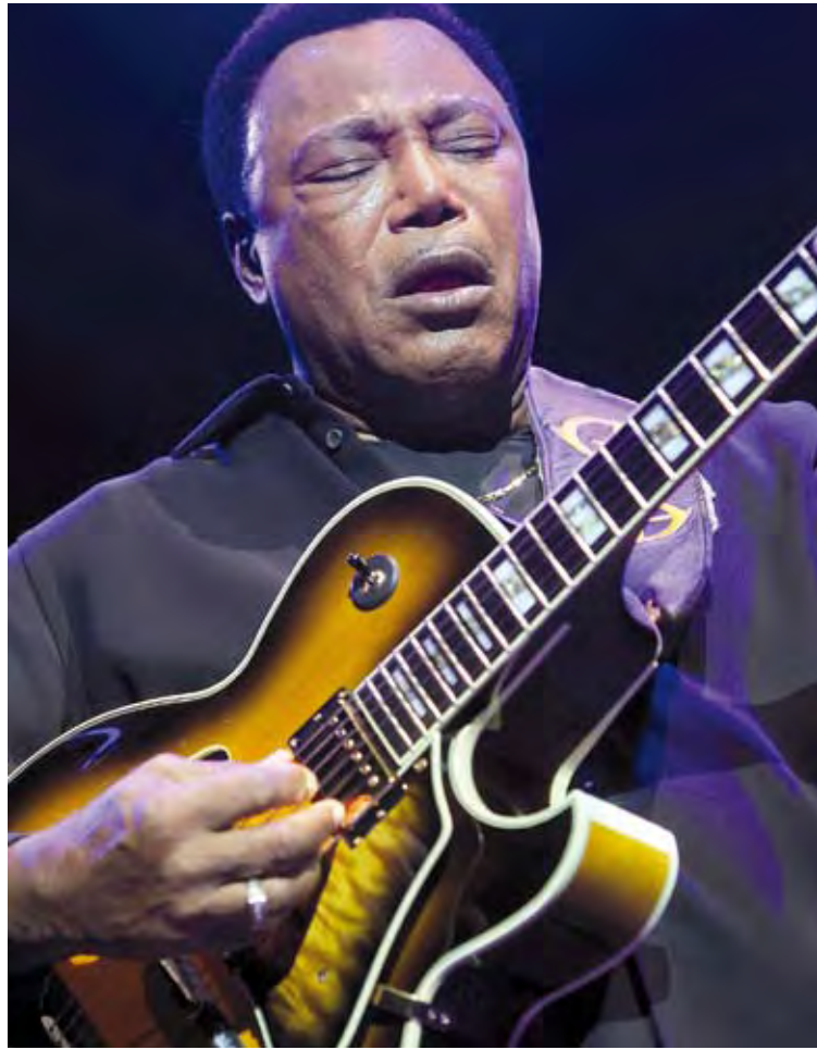
GEORGE BENSON. El músic diumenge a la nit a Calella de Palafrugell

■ Si els rellotges bons han de ser suïssos i els cotxes esportius italians, el sentit de l'espectacle és nord-americà, no en tinguin dubte. George Benson va saltar a l'escenari de Cap Roig diumenge a la nit anunciat per un mestre de cerimònies tal com si fos en un combat de boxa sota els acords incessants de Breezin . Amb la seva Ibanez penjada al coll, va obrir foc amb dos temes instrumentals del seu repertori més jazzístic per deixar clar que allò era el Guitar man tour . Tot seguit, va passar-se al pop, i va treure de la calaixera algun dels seus hits més coneguts com Nothing's gonna change my love for you . Aquell inici va servir per demostrar que maduresa, en el seu cas, vol dir plenitud. Excel·lent instrumentista i compositor (no diem res de nou, té el prestigi que només mestres de la talla de Stevie Wonder o Miles Davis gaudeixen a l'altra banda de l'Atlàntic), va provar que és un portent de cantant, amb un registre apte solament per a les grans veus afroamericanes. A partir d'allà, aquell maridatge, entre jazz "comercial" i pop de qualitat (la seva inconfundible fórmula), va marcar la primera hora de l'espectacle combinant-se a parts iguals. Arribats a una versió de The lady in my life , de Michael Jackson, i d'una apoteòsica i funky El mar (va bromejar en la seva presentació dient que s'havia fet el ferm propòsit d'aprendre a pronunciar "Calella de Palafrugell"), el de Pittsburgh va