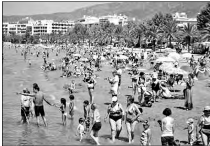
El turista francès és un client fidel de les platges rosinesques. EMPORDÀ

En reconeixement a aquesta fidelitat i a la relació de convivència establerta entre els veïns del municipi i els visitants francesos, l'Ajuntament de Roses ha programat una sèrie d'activitats que s'iniciaran el proper dijous 19 de juliol, amb la jornada de portes