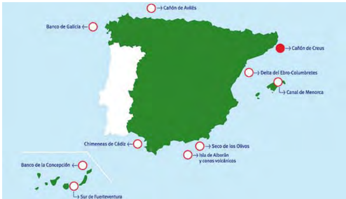
ABAST DEL PROJECTE "LIFE INDEMARES". Està fent un inventari de la Xarxa Natura 2000 marina a l'Estat espanyol

■ El govern espanyol designarà l'àrea marina del canyó de Creus espai d'importància comunitària al 2013. Així ho va anunciar el director general de Sostenibilitat de la Costa i del Mar, Pablo Saavedra, a principis de juny, coincidint amb el Dia Mundial dels Oceans. Això vol dir que l'any que ve la reserva subaquàtica del litoral altempordanès -que es caracteritza per la gran abundància de corall blanc- s'integrarà a la Xarxa Natura 2000 marina, amb els beneficis i obligacions que això comporta: la Unió Europea destina una gran inversió a aquestes zones (ja sigui per fer-hi estudis, recerca, controls...), però a canvi els gestors han de treballar per protegir-les. L'objectiu