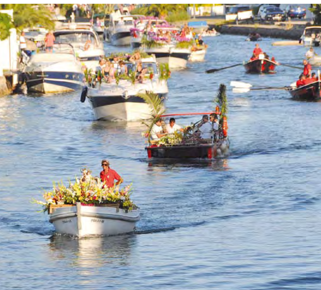
AVA. La imatge de la verge navegant pels canals d'Empuriabrava és ja un clàssic