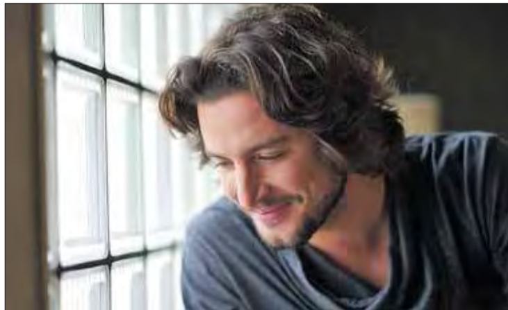
Manuel Carrasco actuarà a la Ciutadella.

■ Està essent un any complicat pel que fa a concerts, però jo sempre faig una lectura positiva de totes les coses. Aquesta gira és la que més estic disfrutant de la meva vida. Ens estem arriscant cada dia i uns concerts han anat millor que altres, però allò positiu és que el disc ha arribat a molta gent, s'estan venent molts discos i sento que la meva carrera