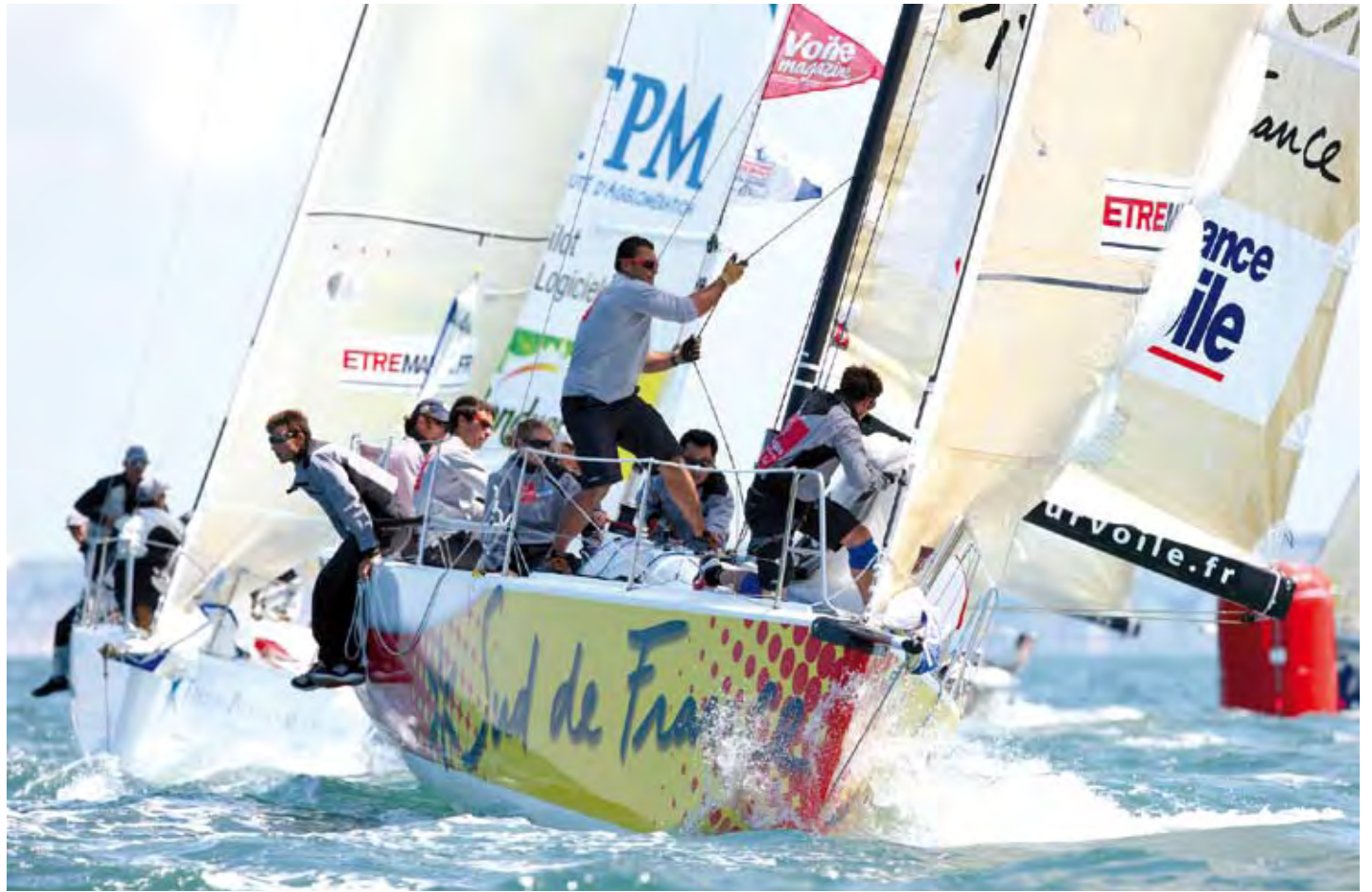
TOUR DE FRANCE À LA VOILE 2011.