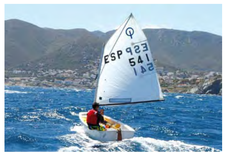
DIUMENGE. Les regates del cap de setmana es van reduir a un dia HORA NOVA