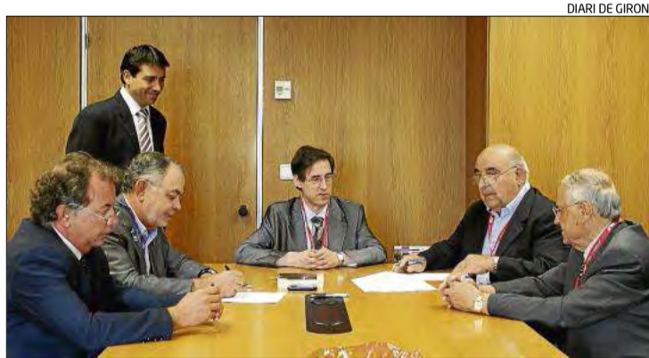
Representants de Comexi i d'Inplacsa signant l'acord.

El sindicat agrari insisteix que els preus que es paguen als productors catalans i espanyols són inferiors als de la mitjana europea i als de la mitjana que es paga en origen a França, fet contradictori si es té en compte que l'Estat espanyol és un país deficitari en producció de llet -se'n produeix el 60% respecte al consum- i que França, en canvi, té excedents.