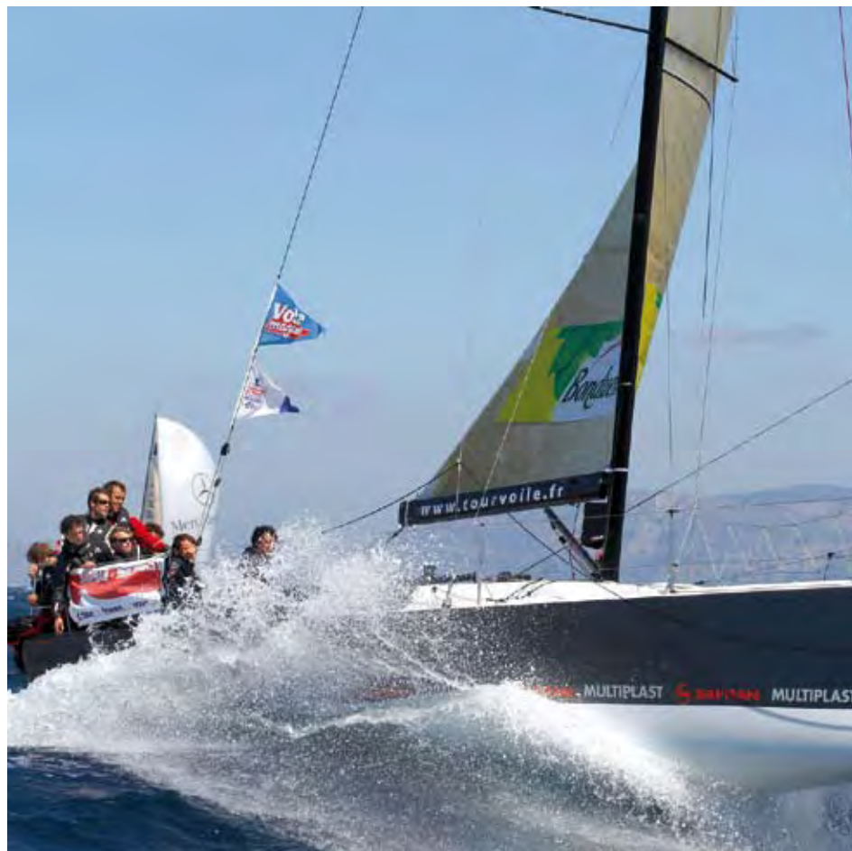
TOUR DE FRANCE À LA VOILE 2011.