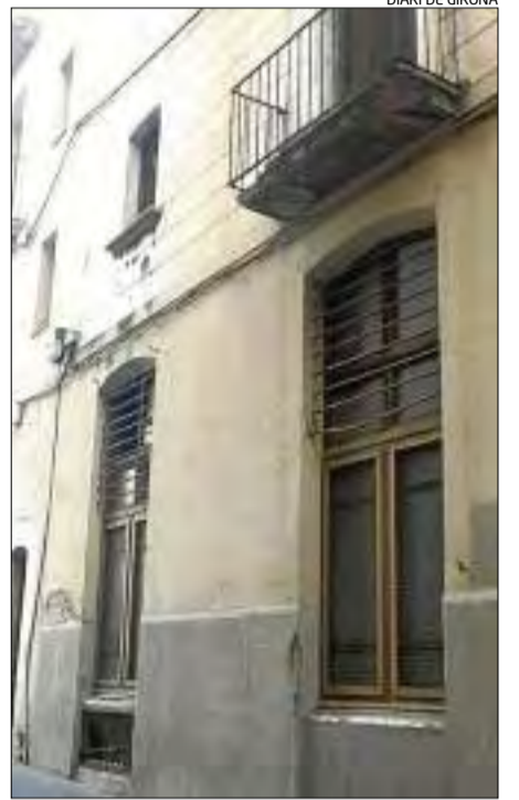
El balcó en mal estat que denuncia el PP.

rien causat humitats que haurien acabat per suposar un ensorrament d'un tros del sostre de voltes entre la planta baixa i el primer pis. Cap més vivenda de l'edifici de planta baixa i dos estava ocupada. Fonts municipals han informat que ja s'ha requerit al propietari que es porti a terme l'actuació i mentrestant no s'hi podrà residir.