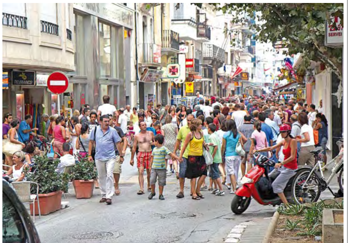
DE GOM A GOM. Els turistes francesos omplen platges i carrers de Roses durant els mesos d'estiu

LA SETMANA. Les activitats s'iniciaran dijous amb la jornada de portes obertes de la seu dels Amicals (de 15.30 a 18.30 h), ubicada al número 35 del carrer Doctor Fleming. A continuació (19 h) els actes es desplaçaran al Teatre Mu-