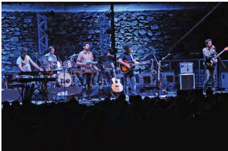
AMICS. El grup durant la seva actuació a la Ciutadella de Roses

Una vegada arrencada l'actuació, el públic va perdre els papers, i es va deixar anar