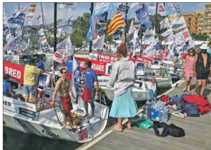
La Volta a França es va aturar a Roses per primer cop el 2007.

► El cap de setmana passat, el Club Nàutic Llançà va organitzar la vint-i-sisena edició de la regata de vela lleugera Trofeu Festes Verge del Carme "Memorial Jordi Canal", reservada a les classes Optimist i Open.