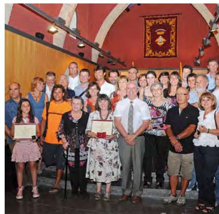
CASTELLÓ. Acte d'entrega d'Espiga i Timó