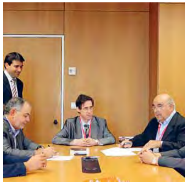
Signatura de l'acord entre els representants de Comexi Group i l'empresa Inplacsa de Cassà.

La nova impressora de Comexi Group reforça la voluntat de la companyia respecte al medi ambient, ja que funciona amb tinta EB. Aquest nou tipus de tinta curable per feix d'electrons suposa l'eliminació dels solvents, i és