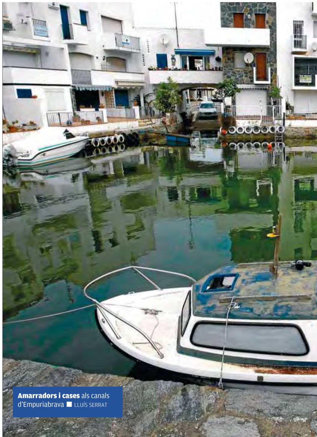
Amarradors i cases als canals d'Empuriabrava