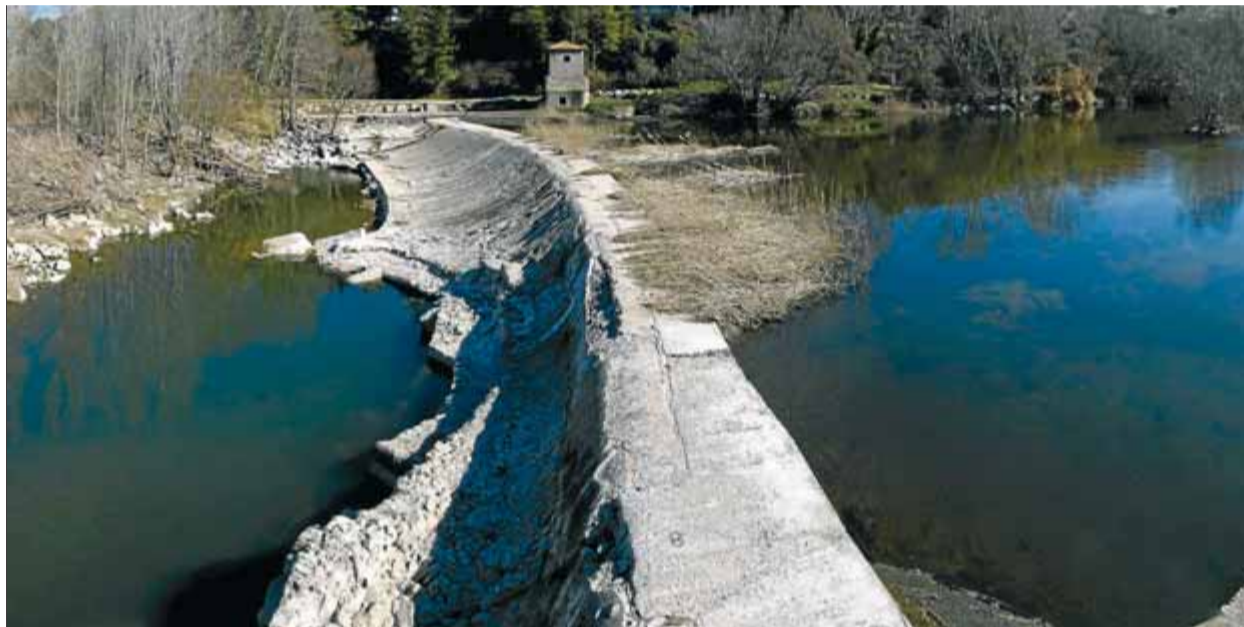
El Ter, amb poca aigua en una presa prop de Campdorà, en una imatge de finals de febrer

Responent a una pregunta d'ICV-EUiA ahir al Parlament, Recoder va afirmar que aquest compromís "no va passar de declaració d'intencions