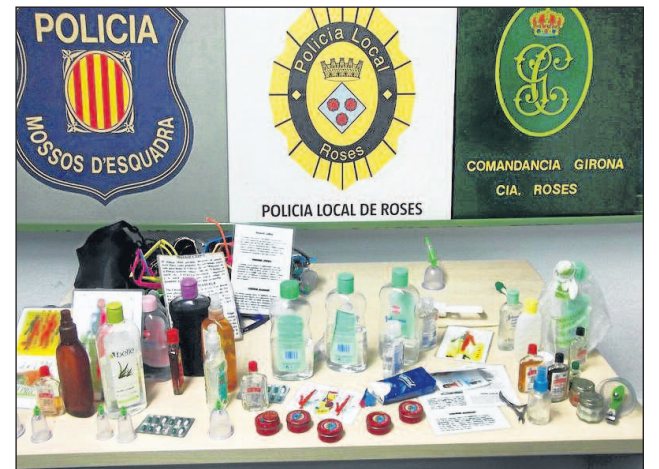
Produits de massage saisis par la Police

Au total, pour l'instant, 20 personnes ont été interpellées :