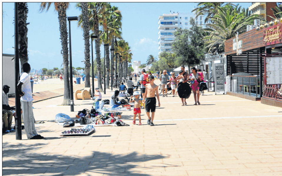
Ventes illégales ?

Ces opérations ont pour vocation d'éradiquer ces pratiques illégales et décourager ceux ou celles qui les pratiquent sur les plages rosincs.