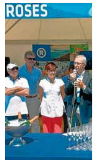
La presentació de la regata, ahir a Roses ■ EL 9

rar el martell fins a 69,42, a 13 centímetres del seu rècord de Catalunya i Espanya. Redondo, en el primer, havia arribat fins als 68,25, a 25 centímetres de la seva millor marca de l'any, que fins ahir era la millor de Catalunya.