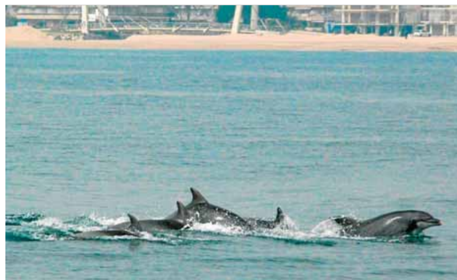
Dofins davant de la platja de Sant Antoni de Calonge

Al cap de Creus hi ha sobretot el dofí ratllat, però