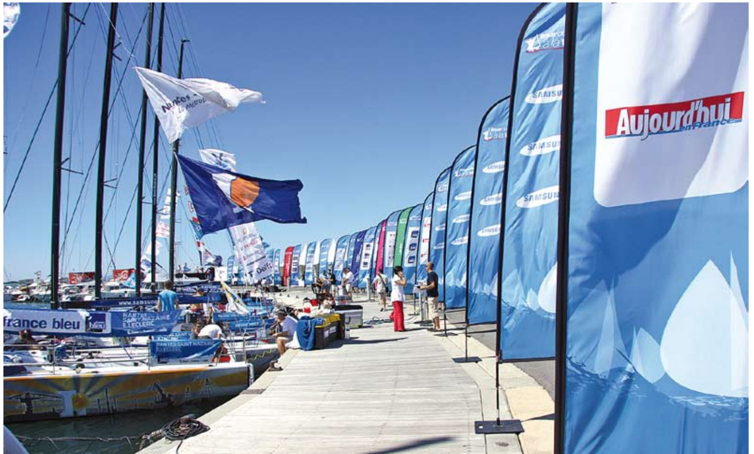
EL VILLAGE. Imatge de les catorze embarcacions amarrades al port de Roses, dimecres al matí

Qui també va parlar meravelles del port de Roses van ser alguns dels regatistes presents a la roda de premsa, com Daniel Souben, skipper de Cournier Dunkerque -líder de la classificació- i Fabier Henry, skipper de Coych. Tots dos van ser presents en l'etapa rosinca del tour