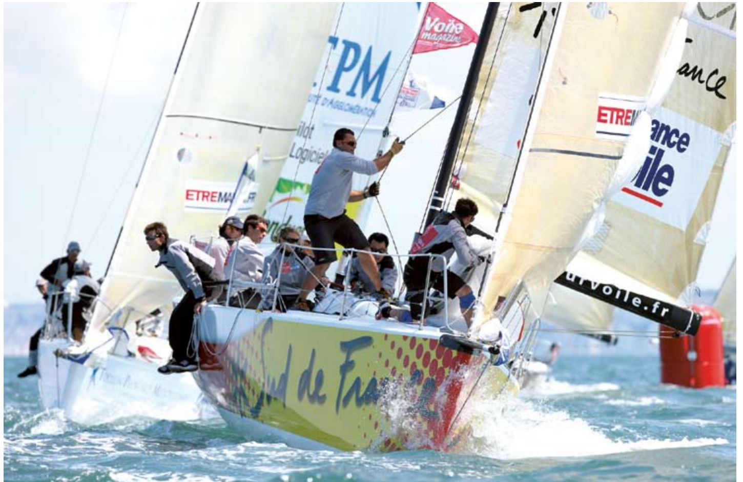
TOUR DE FRANCE À LA VOILE 2011.