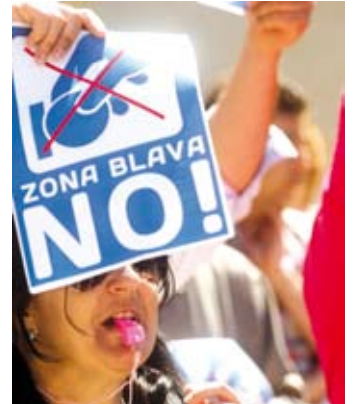
PROTESTES. Contra la mesura Q. GIRONA

La zona blava entrarà en servei a l'agost, tot i que només una part