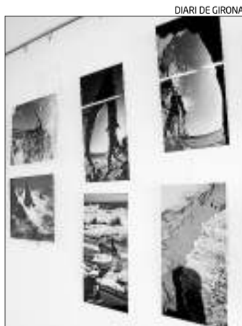
Imatge de l'exposició.

L'exposició de fotografies «La Costa Brava secreta» mostra una trentena d'imatges del fotògraf barceloní Carles Virgili. Aquestes instantànies donen a conèixer el paisatge del litoral de la Costa Brava sud (de Blanes fins a l'Escala) i des de diferents punts de vista.