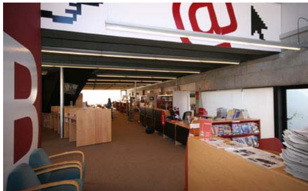
Imatge de la biblioteca.