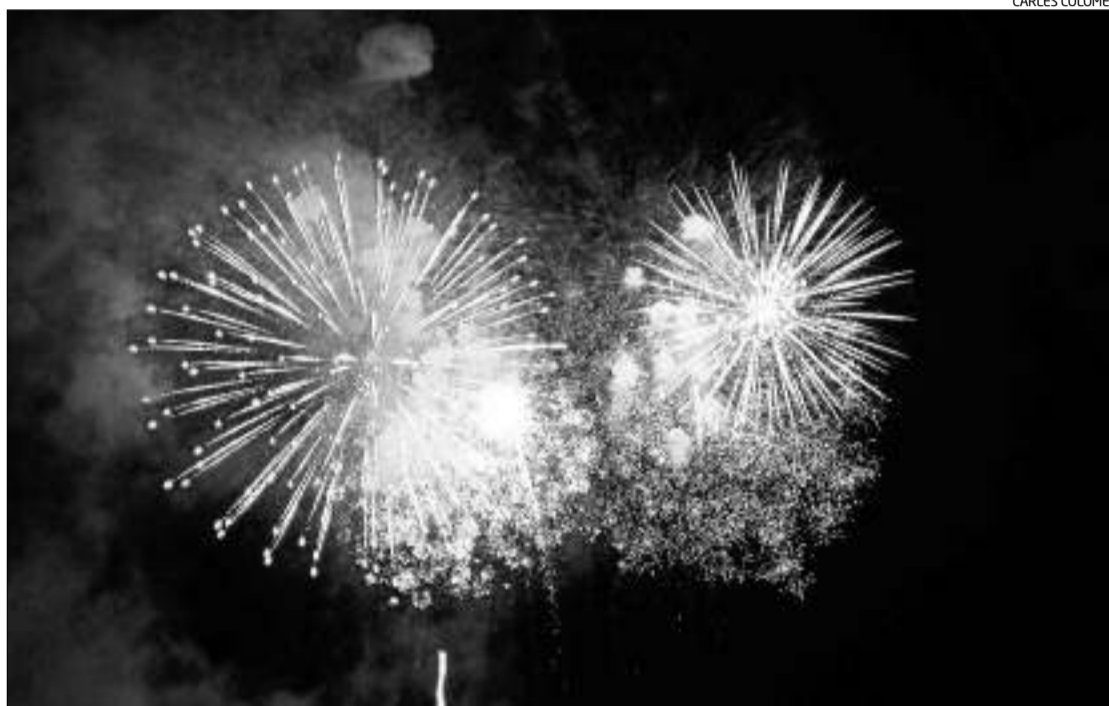
Imatge del Concurs de Focs d'Artifici de la Costa Brava celebrat l'any passat.

Per a l'Ajuntament, els actes de la Festa Major suposen una despesa de 29.000 euros. Els 13.000 euros que falten per quadrar el pressupost provenen d'ingressos a través d'em-