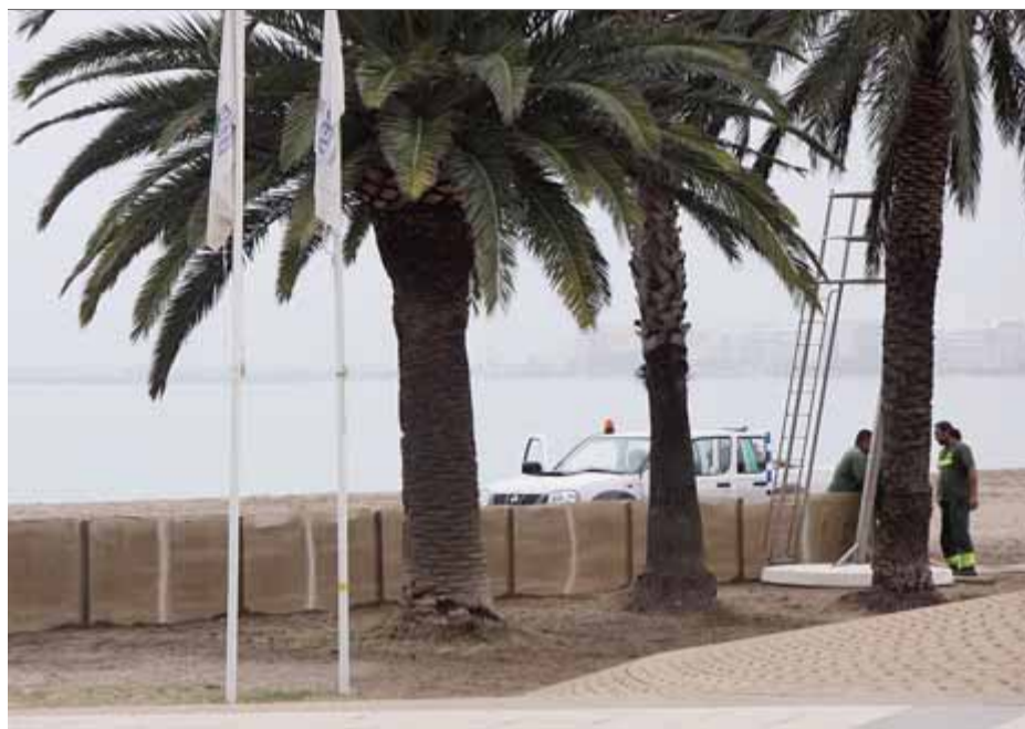
La platja de la Punta de Roses, a la imatge, és una de les més problemàtiques pel que fa la pèrdua de sorra per l'erosió del vent ■ EL PUNT AVUI

Les tanques que s'ha instal·lat estan formades per una lona de material geotèxtil que actua com a pantalla de contenció. Aquesta mesura s'ha portat a terme a Roses la majoria d'estius des de l'any 2006 per evitar que l'acció del vent desplaci la sorra cap al passeig marítim i també cap als espais enjardinats. ■