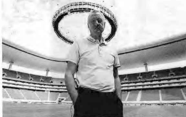
Johan Cruyff posant a l'estadi del Chivas de Guadalajara. L'holandès és assessor esportiu del club mexicà.

Serà el segon cop que la selecció africana ve a Catalunya per jugar contra el combinat català. El primer cop va ser el 1998 i el partit va