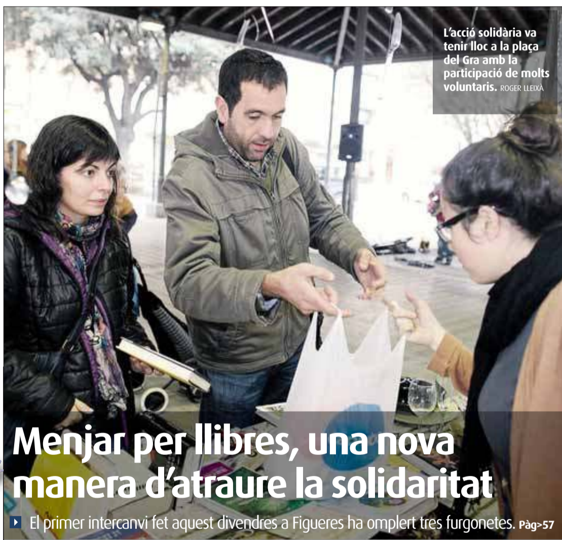
L'acció solidària va tenir lloc a la plaça del Gra amb la participació de molts voluntaris.