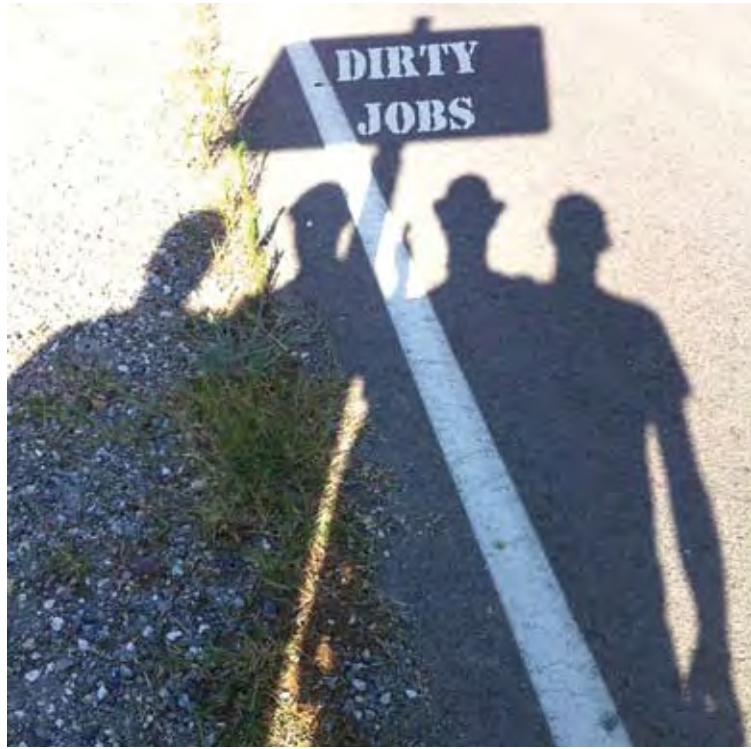
DIRTY JOBS. Una foto promocional de la banda castellonina

BANANNA BEACH. Aquests "teenager rumba surfers" són una de les