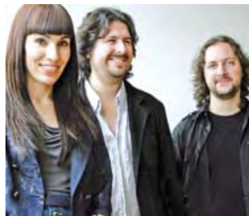
LA PORTA DELS SOMNIS. HORA NOVA

Aquest àlbum és la continuació de la nova etapa que va marcar l'anterior Aire Lliure , amb temes que barregen pop i rock a parts iguals com "Cap a tu" o "Dalta-baix", i amb pinzellades de folk americà com "Aprendre de tu" o "Fem una nova cançó". La veu de