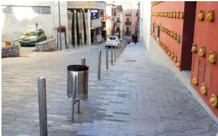
CARRER CANIGÓ. Reobert al trànsit després de les obres