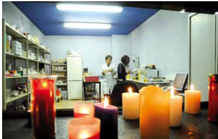
EMPRESA CENTENÀRIA. Ubicada a Figueres