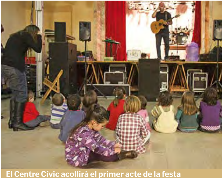
El Centre Cívic acollirà el primer acte de la festa