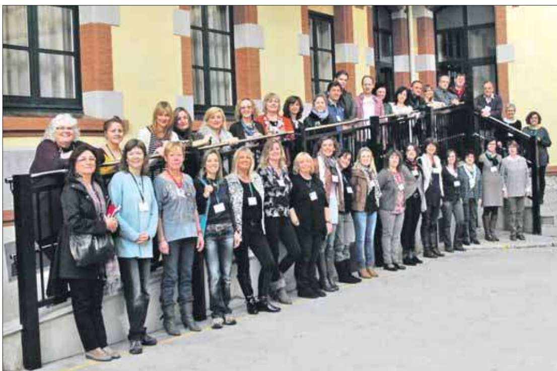
Els professors d'anglès, abans de començar el seminari, al pati del Col·legi La Salle de Figueres. FRANCESC AGUILERA