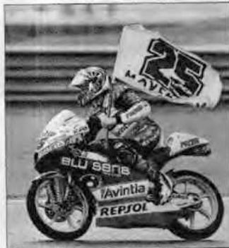
Viñales se despidió del Avintia en Chestre