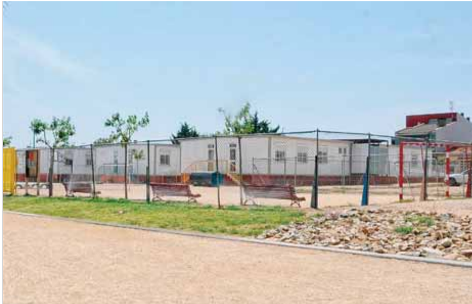
L'escola Carme Guasch fa anys que manté els barracons