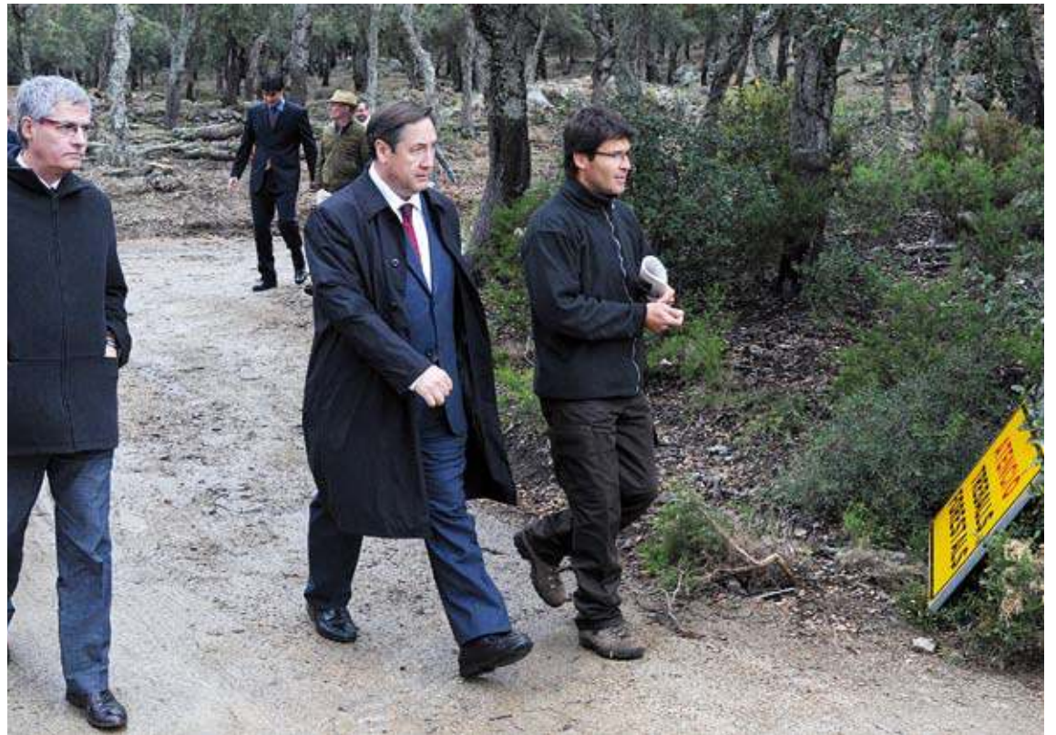
PANISSARS. Una comitiva encapçalada pel conseller va visitar els treballs de neteja i prevenció que ja s'hi estan fent.

Els alcaldes van aprofitar per recordar al conseller que estan pendents de cobrar ajuts. ■