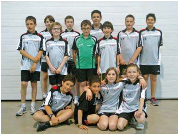
TORNEIG HORITZÓ. Tretze palistes del Tramuntana van prendre-hi part