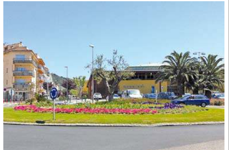
ROTONDA. Pròxima al mercat del municipi