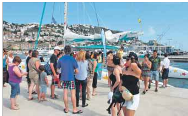
La Festa omple d'activitat el port esportiu rosinc. EMPORDÀ

► La Festa del Mar serà el marc de la presentació del nou centre de Turisme Pesquer de Roses. Conèixer la cultura marinera, la tasca dels pescadors i la difusió del patrimoni al voltant del mar són només alguns dels objectius d'aquesta iniciativa que oferirà activitats molt innovadores al voltant del sector. La Confraria de Pescadors, l'Estació Nàutica Roses-Cap de Creus i l'Ajuntament de Roses són els impulsors del projecte que, segons els seus creadors, "contribuirà a donar un valor afegit al municipi i obrirà les portes del sector pesquer a la societat en general i al sector turístic en particular, amb la creació de sinèrgies molt importants". Per exemple, a partir del 3 de juny, es podrà viure l'experiència de sortir a pescar amb embarcacions del poble, hi haurà noves línies de visites guiades al port de Roses i també es podrà visitar un vaixell de pesca del municipi.