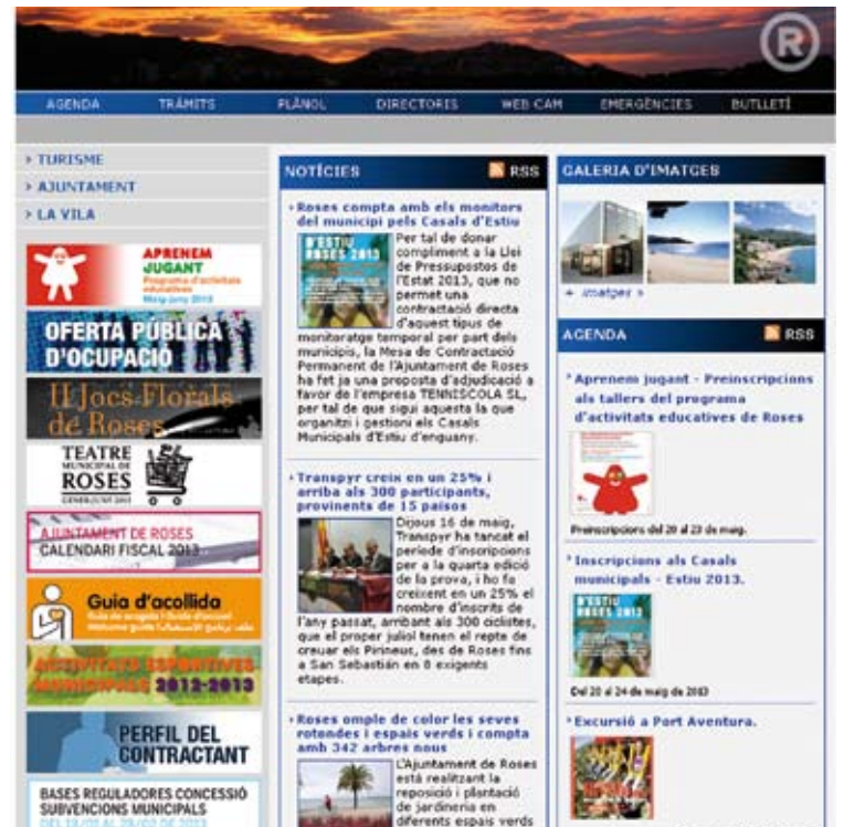
WEB DE ROSES. Segons l'informe, és el més complet de l'Alt Empordà

mació necessària per arribar a l'excel·lència), Castelló d'Empúries (44%) i Figueres (41%); mentre que els més bàsics són els de Cantallops, Rabós d'Empordà i