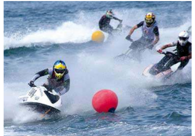
ESPECTACLE. Una imatge de les proves que es van celebrar a Roses