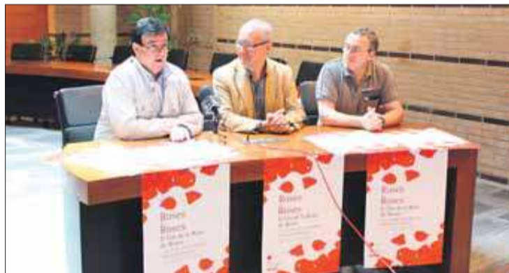
L'Ajuntament aposta per la Fira al 100%. EMPORDÀ

Des de l'Ajuntament de Roses destaquen que l'objectiu passa per consolidar i fer créixer la mostra i, per això, en aquesta edició s'ha apostat perquè hi hagi més participació que el 2012. Una bona part de la societat civil i entitats del municipi ajudaran a engalanar la Rambla Riera Ginjolers, la Plaça de l'Església,