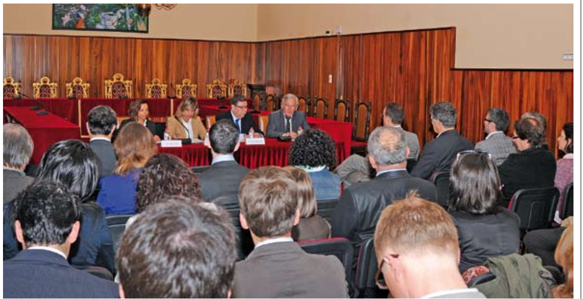
AJUNTAMENT DE FIGUERES. Divendres al matí s'hi va fer l'acte de benvinguda protocol·lari