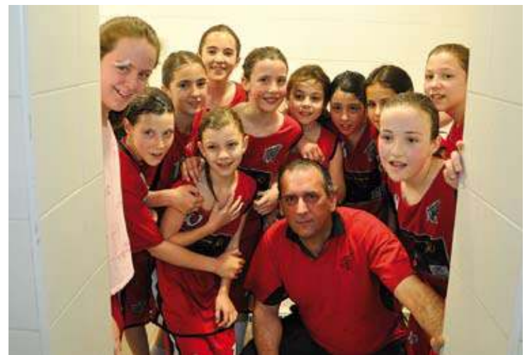
MINI FEMENÍ. Les jugadores del club van celebrar el triomf a la dutxa