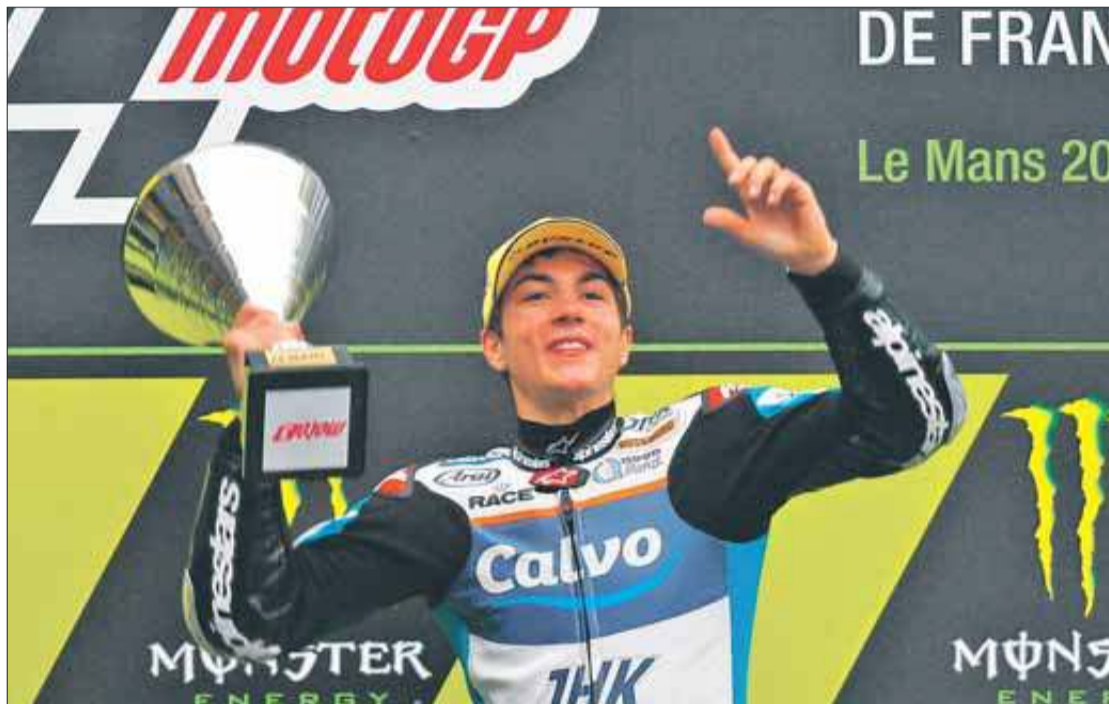
Maverick Viñales va tornar a guanyar al circuit de Le Mans.

Després del triomf a Le Mans, el pilot de Roses és encara més lí-