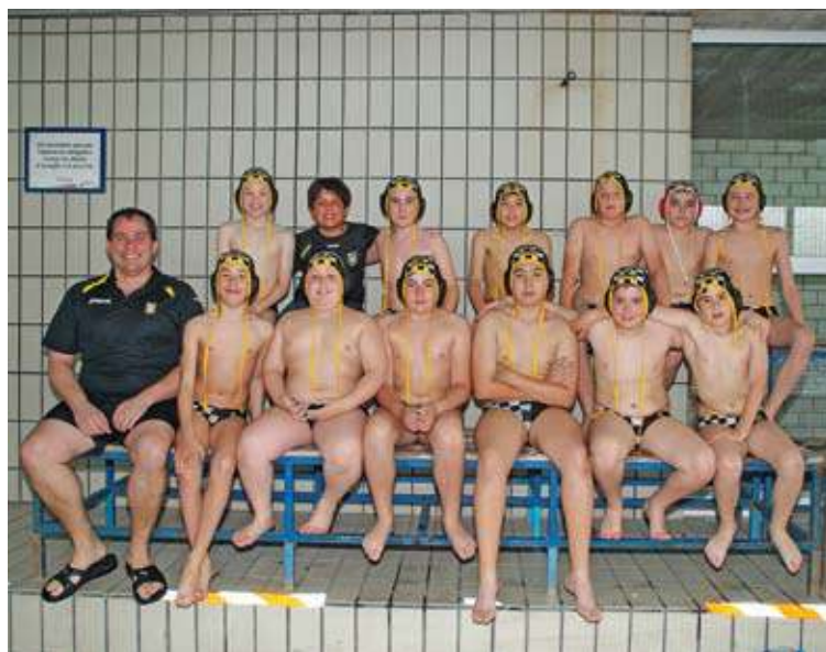
SUPERIORS. Els jugadors de l'aleví del CW Figueres van dominar el rival

ja que va ser la més ràpida als 300 m tanques (46"52) i va fer el segon millor temps als 100 m tanques (16"32). Lluïsa Mitjà va ser segona global als 600 m lllisos, a només 8 centèsimes del millor temps, després de guanyar la seva final (1'42"46), i va ocupar la cinquena posició al triple salt (10,16 m). Sara Guerrero va ser sisena als 3.000 m (12'17"26), i 12a amb el relleu 4x300 (3'31"33), i Aida Martínez va ocupar la 13a posició al salt de llargada (4,21 m), i també 12a al relleu 4x100 (1'01"93). ■