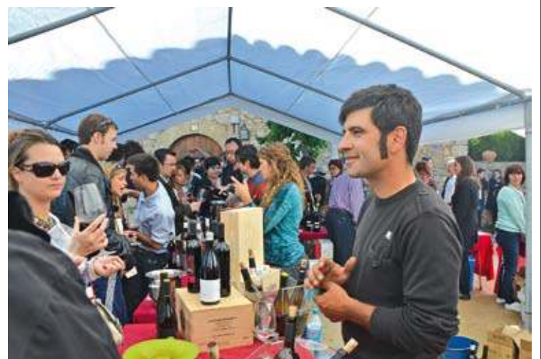
PARTICIPANTS. 22 cellers de la DO Empordà i un de Perpinyà presents