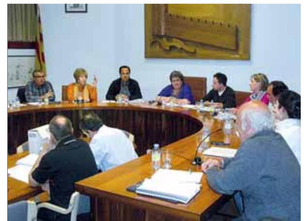
Una imatge del darrer ple municipal de Tossa de Mar, celebrat la setmana passada

"CiU condemna públicament un cop més la política de mentida compulsiva i manipulació que practica Saladich en tots els temes relatius al darrer mandat de CiU, en què