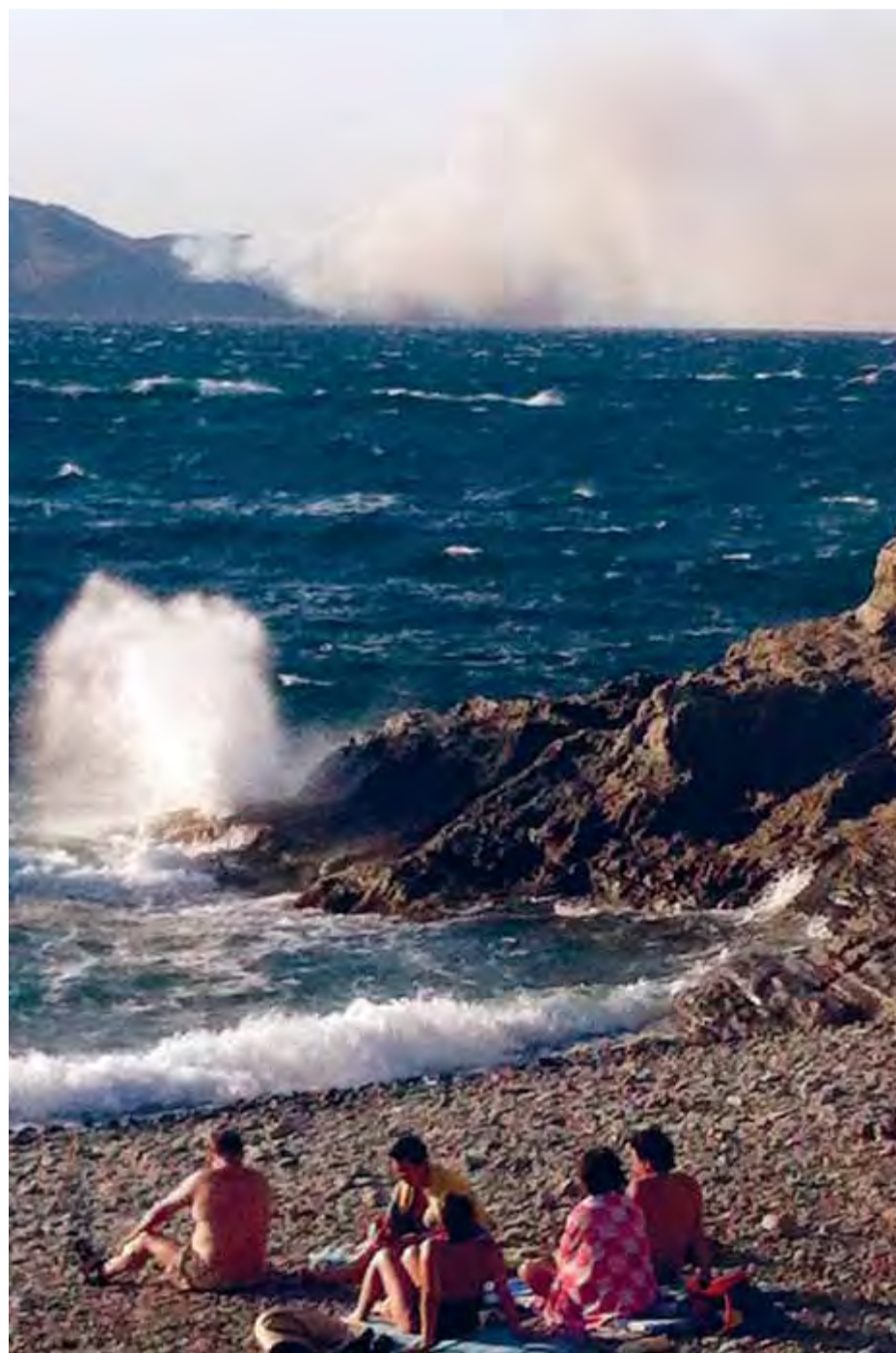
A dalt, gent abandonant els cotxes i baixant muntanya avall fugint del foc. I a baix, els turistes miren des del Port de la Selva la columna de fum a Portbou