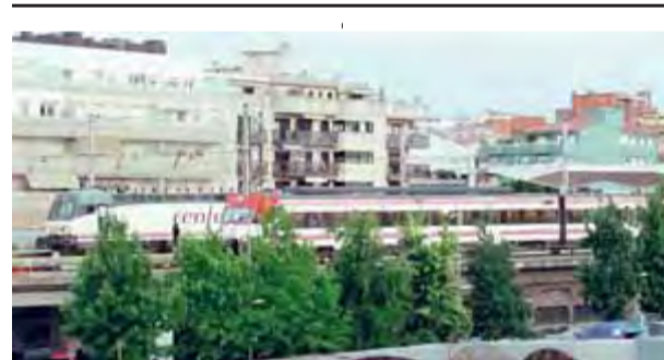
Combois aturats ahir al vespre a Girona

Unes de les solucions adoptades ahir a partir de quarts de set de la tarda i que va anunciar el conseller d'Interior, Felip Puig, va ser l'aixecament de barreres del túnel del Cadí