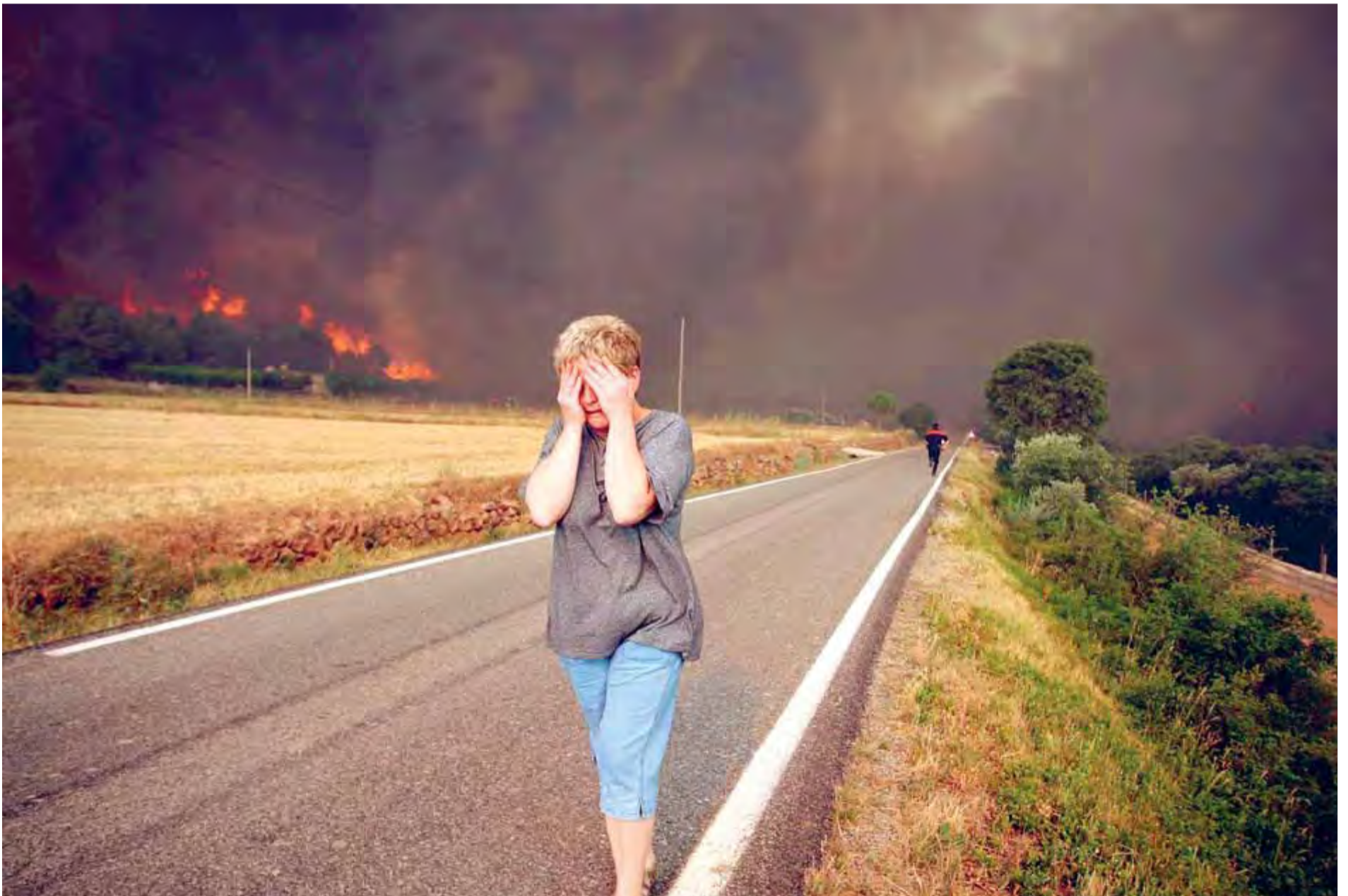
Una dona de Biure fuig de les flames que estan cremant la seva granja

VENT • Les flames es descontrolen per la tramuntana i arriben a prop de Figueres ■ P2-13 i Editorial