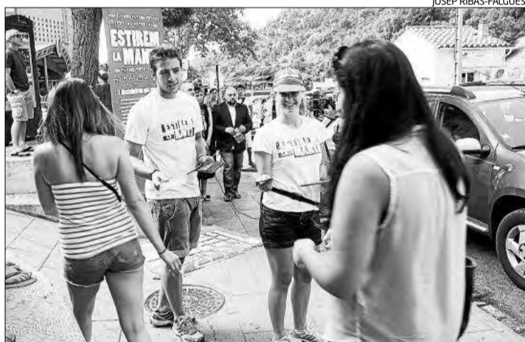
L'inici de la campanya ahir a la Jonquera, repartint díptics informatius.