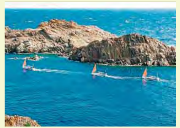
Pas de les embarcacions pel Cap de Creus, ahir ■ EL 9