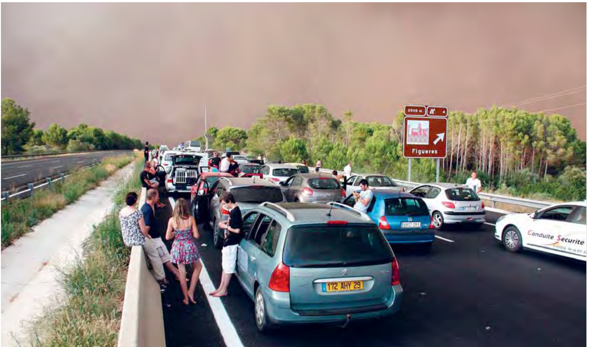
Conductors atrapats a l'autopista AP-7, a pocs quilòmetres de la sortida de Figueres, pel tall de trànsit provocat pel foc, amb l'espès i amenaçador fum a sobre mateix

Devastació. Les flames s'acarnissen amb l'Alt Empordà