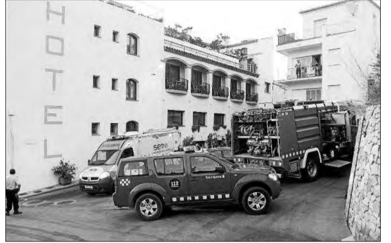
Els serveis d'emergència a les portes de l'hotel dijous a la tarda.

► Els afectats no van requerir hospitalització i els clients van poder tornar poca estona més tard