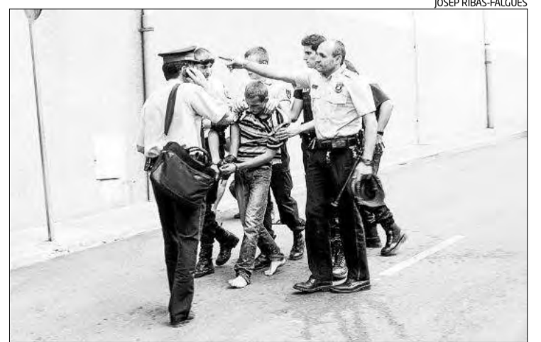
Un dels moments de la detenció per part de Mossos i Policia.

Els fets van passar pocs minuts abans de les onze del matí quan tenia lloc al Pertús l'inici de la campanya del top manta. Segons els testimonis, l'home va arribar en vehicle, va creuar l'àrea de les cabi-