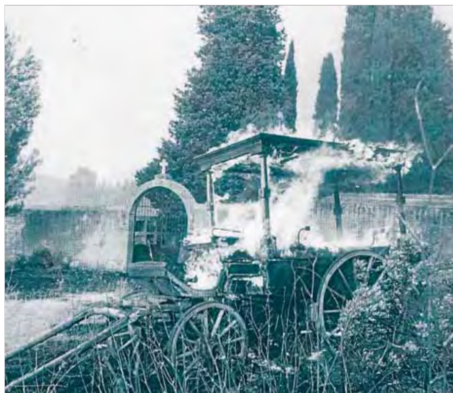
El carro funerari que es va cremar en el gran incendi de l'any 1986

■ L'incendi de fa 26 anys va cremar 26.000 hectàrees i hi van morir quatre tripulants d'un hidroavió francès