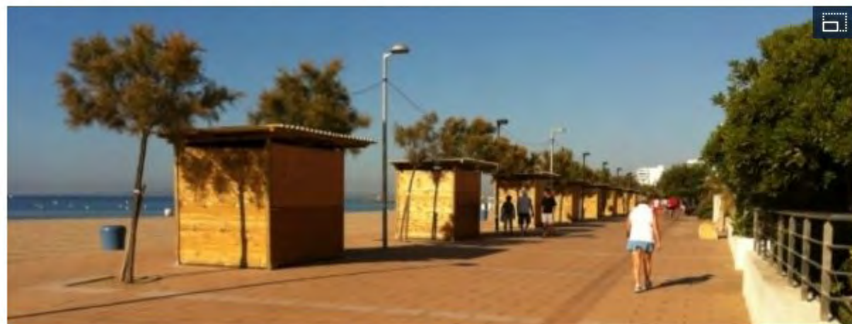
Roses crea un mercado de artesanía para combatir el 'Top Manta' aj.Roses.

Girona | 21/07/2012 - 08:17h | Actualizado el 21/07/2012 - 09:22h