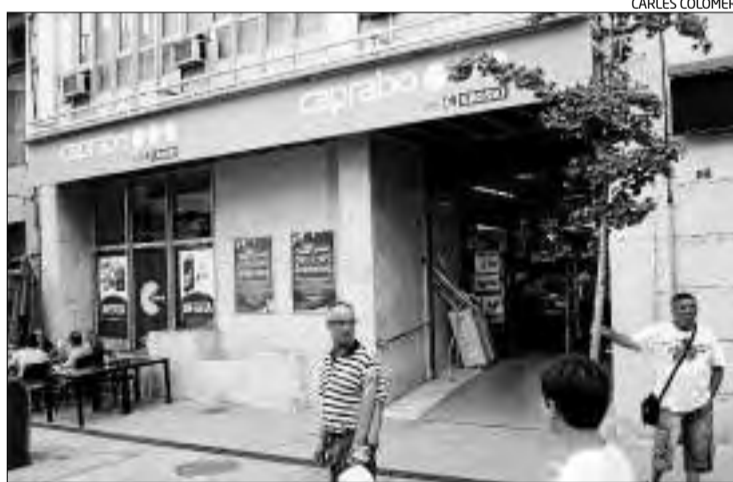
El supermercat de la cadena Caprabo a Blanes s'ha sumat a la iniciativa.

Normalment, els recaptes d'aquestes característiques es produeixen durant els mesos d'hivern. No obstant això, el Banc d'Aliments a les comarques gironines va notar que mentre els usuaris augmentaven un 30% respecte l'estiu passat, els productes que re-