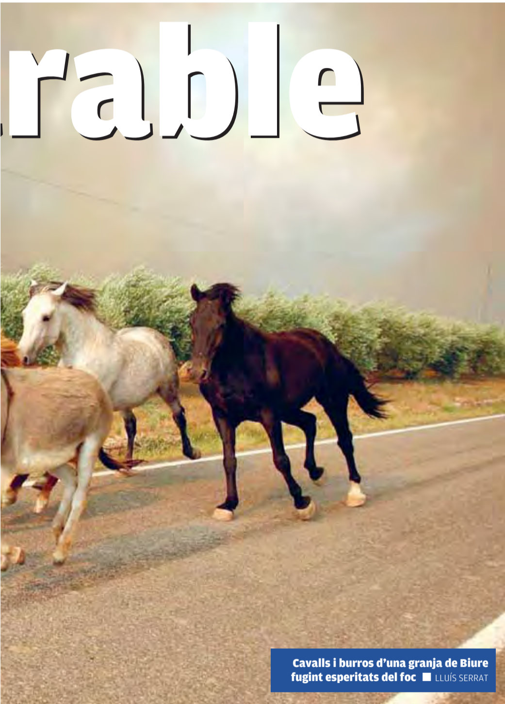
Cavalls i burros d'una granja de Biure fugint esperitats del foc

El fatídic incendi provoca la mort de tres persones