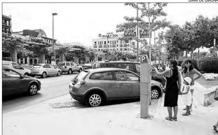
La fa poc estrenada zona blava de Roses a l'avinguda de Rhode.

L'Ajuntament ha informat que la implantació respon a l'objectiu