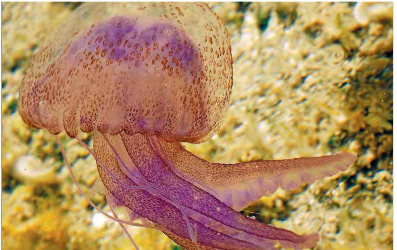
Medusa luminiscent , una de les quatre meduses més comunes a les platges de Catalunya

L'expert ha lamentat que les retallades hagin arribat també al projecte Medusa, una iniciativa pionera al Mediterrani que aquest any s'ha quedat "sense cap finançament específic" després de la supressió a finals de l'any passat dels 170.000 euros que hi destinava cada any