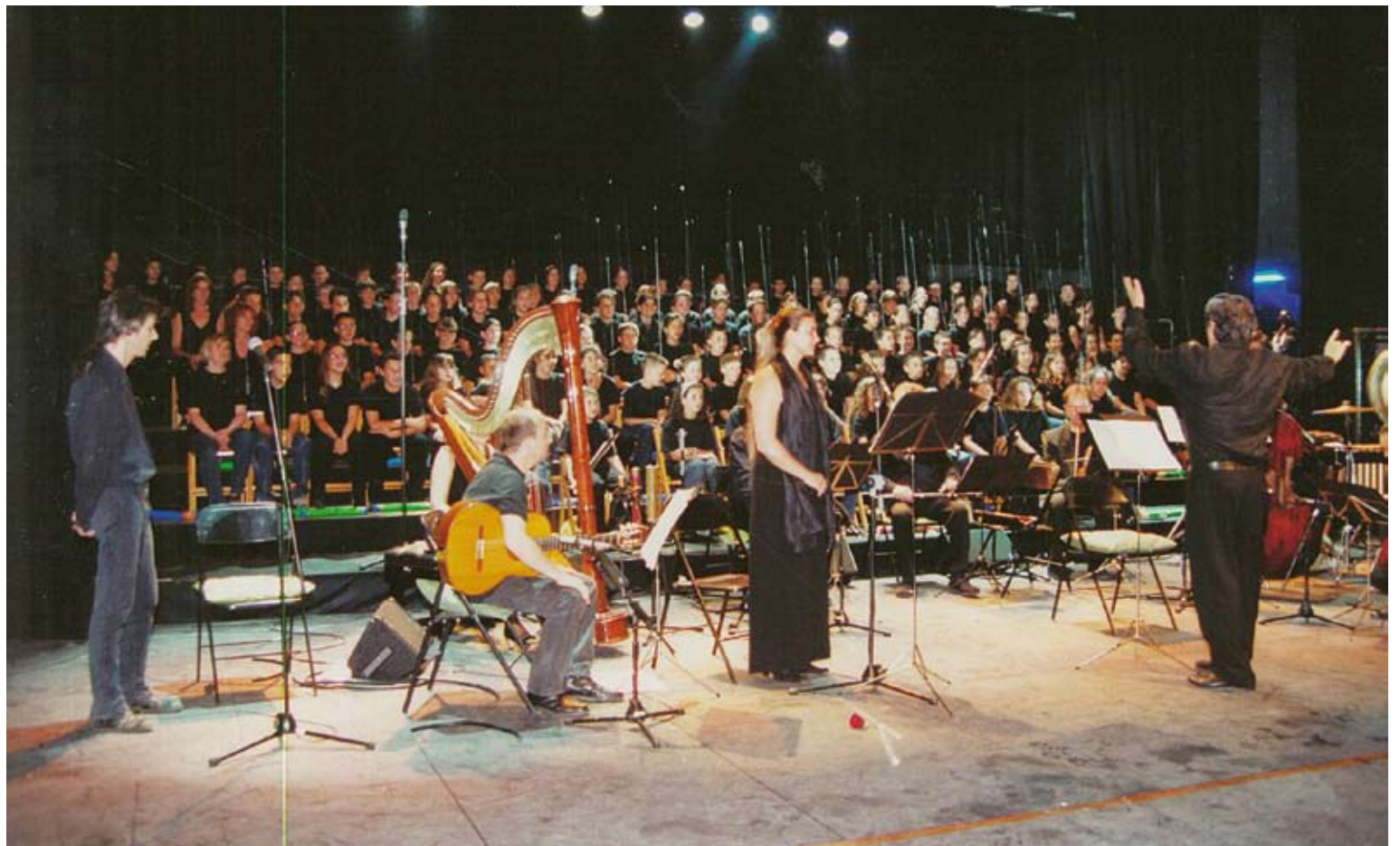
REVIVAL. Una instantània de la representació del muntatge "La tonalitat de l'infinit" ara fa deu anys

Cal recordar que aquest mateix muntatge enguany també formarà part dels cartells dels festivals GREC de Barcelona i Porta Ferrada de Sant Feliu de Guíxols.