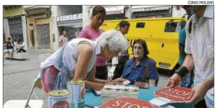
La recollida de firmes es va fer davant de l'ajuntament.

potenciar la zona de vianants del centre, juntament amb els pàrquings dissuasius. De fet, Vila va afirmar que des de 2008 s'ha doblat la superfície d'aparcaments i que ara Figueres compta amb unes 3.000 places. Ara queda pendent la reurbanització del passeig que podria estar acabada el juny de 2013. Tindrà arbrat i un carril per a la circulació de vehicles. També permetrà tornar el mercat.