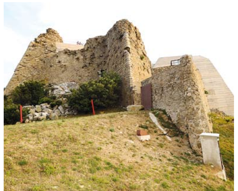
LA FORTALESA. La construcció militar rosinca data del 1554