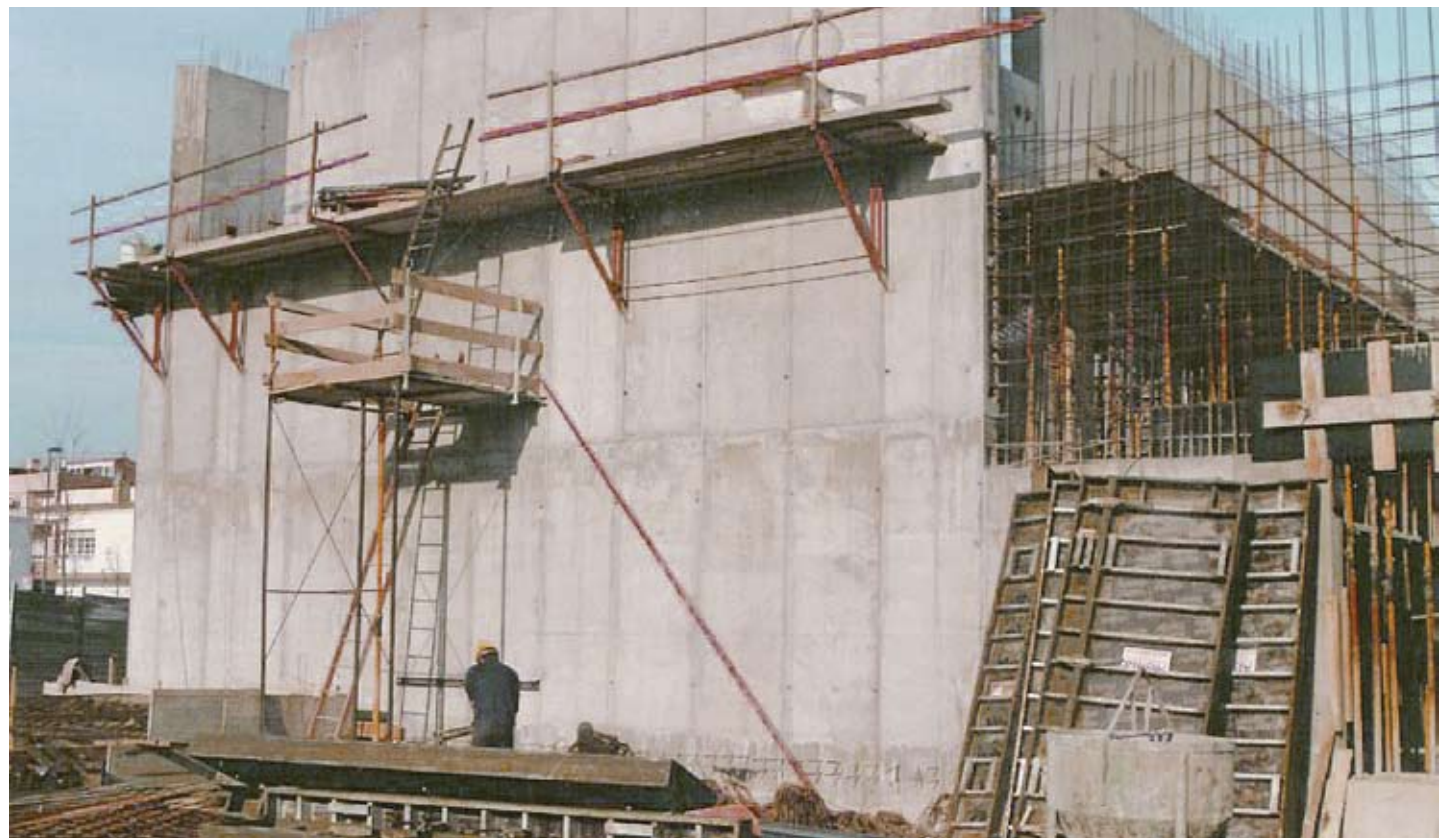
EL PROCÉS. Diverses imatges del procés de construcció del TMR, que va durar dos anys (del 2000 al 2002)