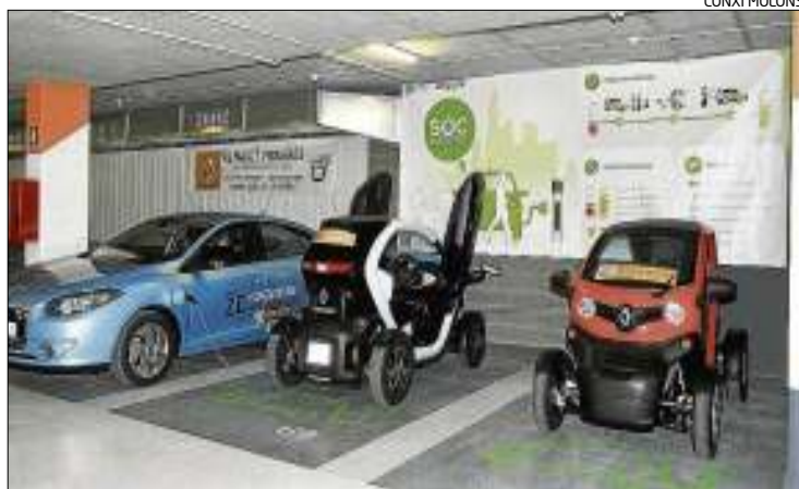
Els vehicles elèctrics que s'ofereixen amb les primeres places venudes.

Hi ha hagut dificultats -pel terreny- i retards -per qüestions tècniques- però, finalment, ahir es va posar en funcionament aquest nou espai que compta amb 65 places per a veïns, deu més per a persones amb mobilitat reduïda i vuit amb punts de càrrega per a vehicles elèctrics, una de les princi-