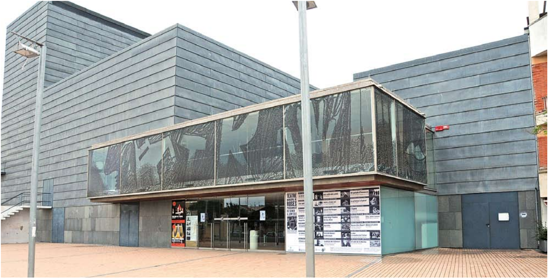
EN L'ACTUALITAT. Fotografia de l'aspecte actual que ofereix el Teatre Municipal de Roses. Aquest any s'han organitzat una sèrie d'actes per celebrar el desè aniversari de l'edifici