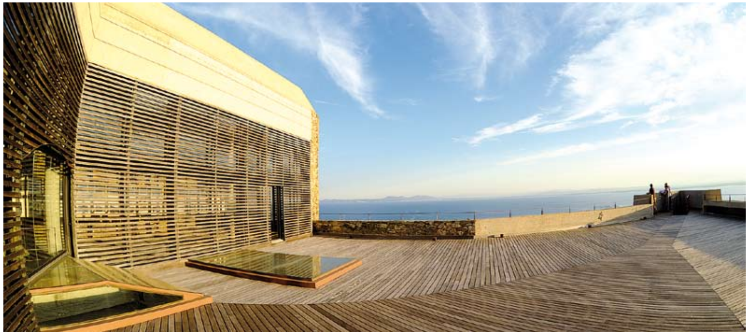
REHABILITACIÓ. Les obres faraòniques de consolidació de l'estructura i adequació del castell es van acabar el 2010