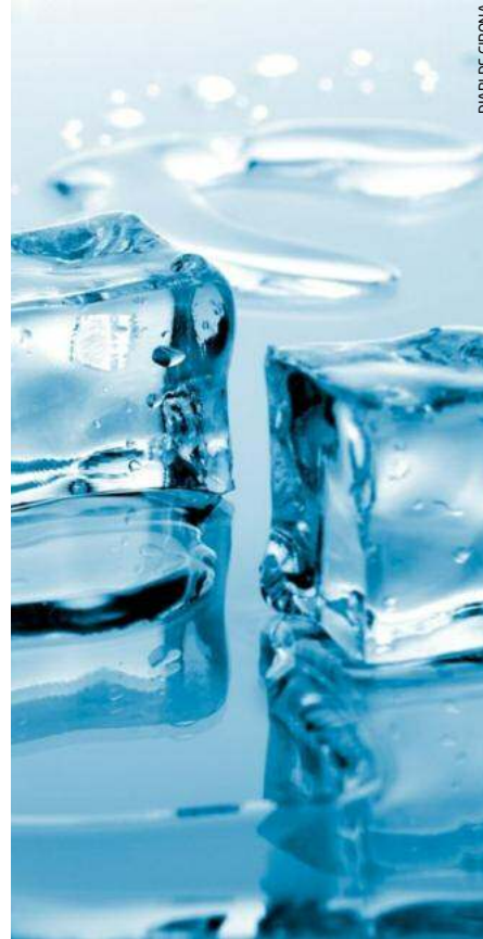
DIARI DE GIRONA

Durant molts anys, el pantaló curt o shorts ha estat una peça de vestir reservada als nens. Tot i que des de 1900 eren usats per alguns exèrcits en guerres colonials, i tot i que al 1930 els usaven adults, no fou fins als anys 60 que van ser admesos socialment. L'extensió actual en el seu ús obeeix al criteri de comoditat imperant en la moda. En duen nens i nenes, joves i adults d'ambdós sexes. El mostrar de pantalons curts és molt gran, abraça des dels bòxers fins als «pallassos», passant pels culots, els shorts esportius o les bermudes. El que causa i causarà enguany autèntica