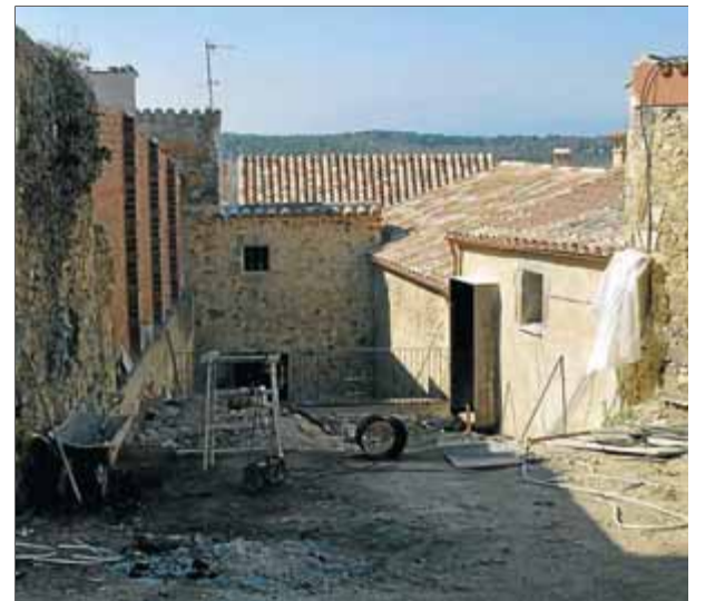
Can Caciques, al fons, i el pati que s'aplanarà. A la dreta es farà una plaça i una sala d'exposicions ■ J.N.