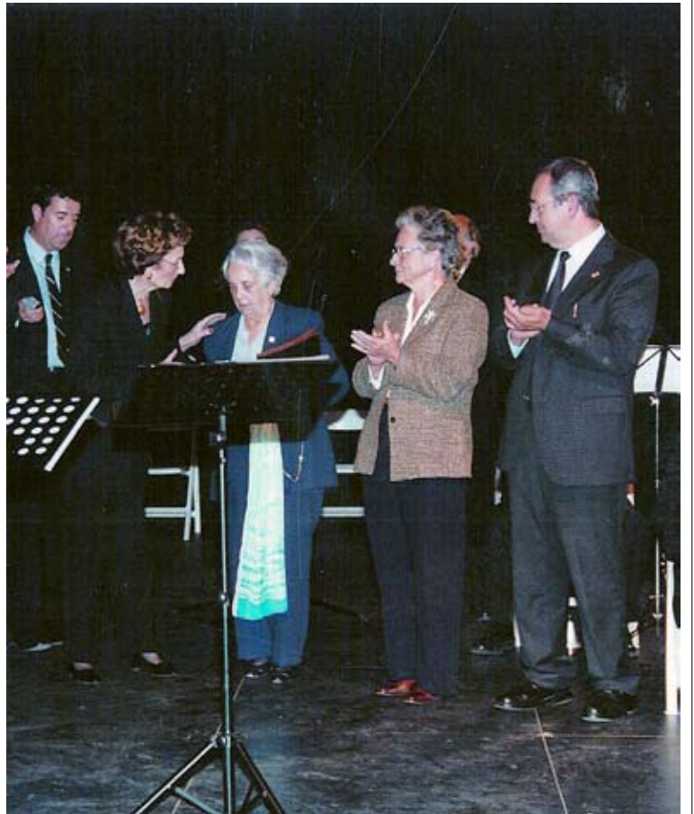
INAUGURACIÓ. A dalt i a baix, diverses fotografies de l'acte d'inauguració que es va fer el 21 de juny del 2002 i que va comptar amb l'assistència del president de la Generalitat, Jordi Pujol