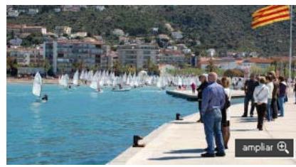
Roses va acollir la Setmana de Vela d'enguany. SANTI COLL

EMPORDA.INFO La vocació de Roses de situar-se en primera línia del turisme nàutic nacional i internacional ha quedat palès al llarg d'aquest any 2012, durant el qual la feina conjunta de l'Ajuntament de Roses, el Grup d'Esports Nàutics Roses i l'Associació Estació Nàutica Roses-Cap de Creus ha fet possible la celebració de nou esdeveniments d'alt nivell competitiu, entre els que destaquen la Setmana Catalana de Vela, que va tornar a casa després de 30 anys, el Campionat d'Europa 29r, el Campionat del Món Slalom Windsurf Femení, el Campionat d'Europa Slalom Windsurf Masculí, el Tour de França de Vela i tan sols fa una setmana el Campionat de Catalunya de Llagut.