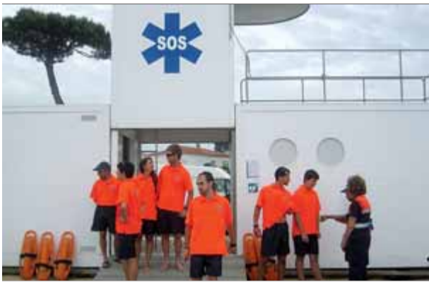
Alguns dels socorristes que s'han fet càrrec de les platges de Blanes durant aquest estiu.