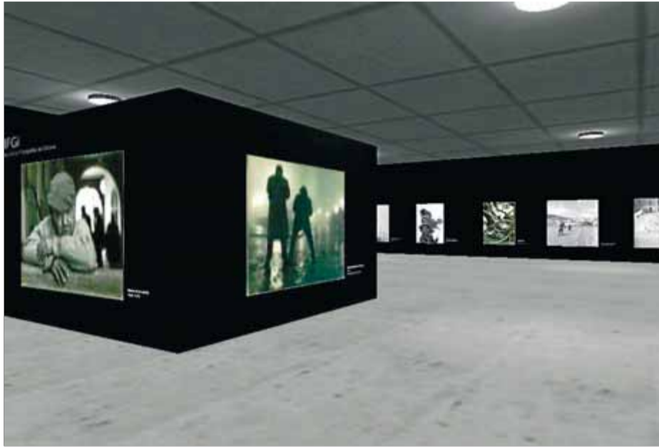
El visitant d'aquest nou museu virtual podrà desplaçar-se per les sales tan sols fent un clic amb el ratolí o bé desplaçant els dits per la pantalla tàctil ■ AJUNTAMENT DE GIRONA

Amb l'objectiu de donar a conèixer aquest patrimoni, ara el consistori ha inaugurat un nou equipament: el Museu de la Fotografia de Girona. La peculiaritat que té, però, és que les obres no estan tancades entre parets, sinó que es poden visitar des de qualsevol indret del planeta. I és que el nou museu és virtual. S'hi pot accedir des d'un ordinador o, fins i tot, portar-lo dins la butxaca (gràcies a una aplica-