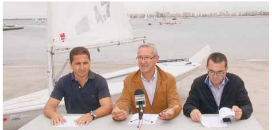
La presentació es va fer ahir al migdia al port de Roses