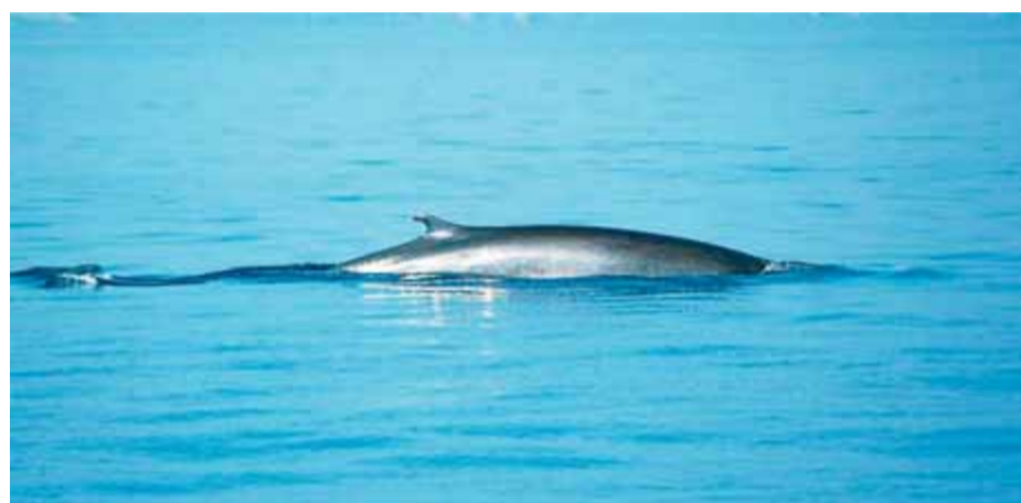
Un dels exemplars de rorqual comú que van ser albirats al Cap de Creus

El rorqual comú és un animal que viu al mar Mediterrani i fa entre 22 i 25