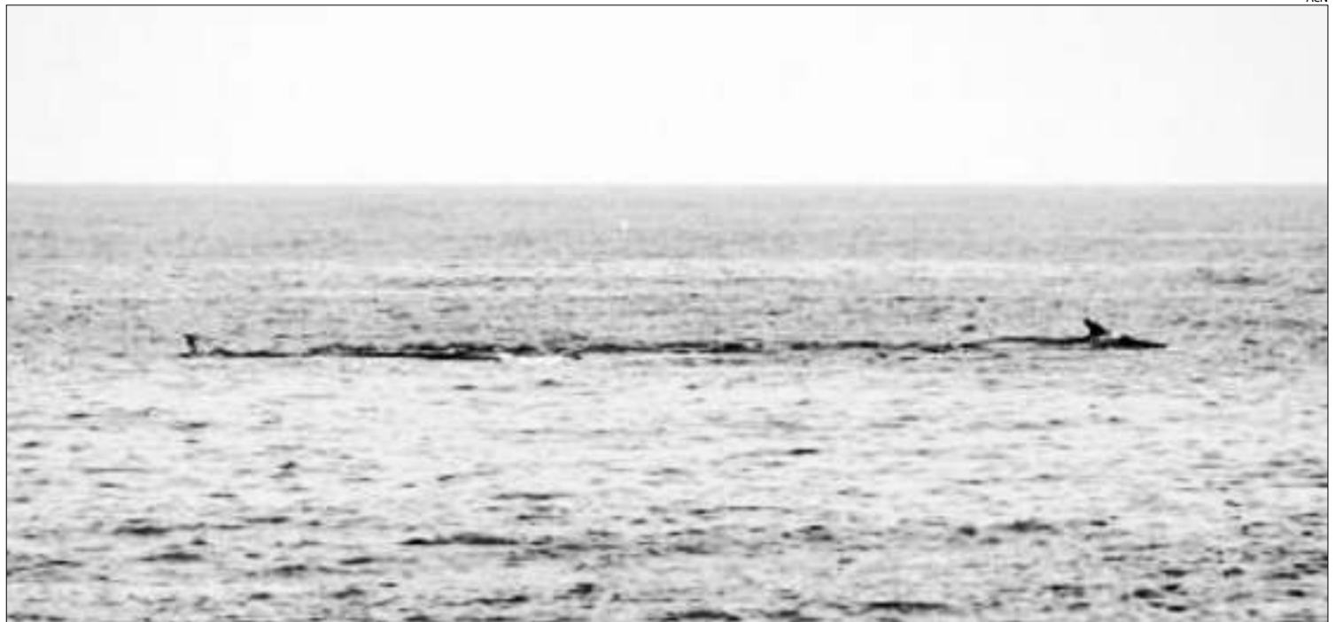
Les tres balenes van ser vistes juntes al Cap de Creus, on van ser seguides fins a la badia de Roses.

Sota el lema «Mou-te en la direcció correcta», del 22 al 29 de setembre Sant Joan formarà part dels municipis de Catalunya que promouran noves formes de mobilitat més sostenibles amb el medi ambient. Amb aquest objectiu el proper dimecres 26 de setembre, a les 17.30 h de la tarda, a la Plaça Duran i Reinald, tindrà lloc una caminada saludable per l'interior del poble. Hi haurà obsequis per a tots els participants.