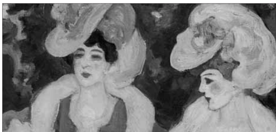
JUAN CARDONA I LLADÓS, Joves parisienques . Obra sobre tela 49x60 cm. Col·lecció Carmen Thyssen-Bornemisza

El nou Museu de la Fotografia de Girona es basa en la tecnologia 3D que s'utilitza en el camp dels videojocs. L'ha desenvolupat l'empresa banyolina Evol i, de moment, s'hi pot accedir a través del web de l'Ajuntament. ■