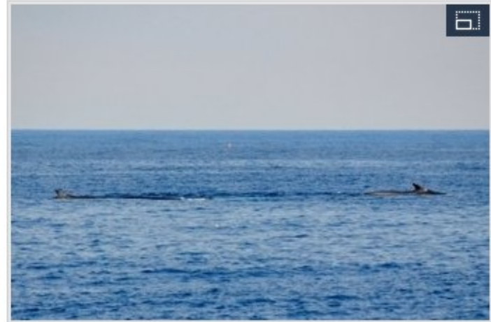
Tres grandes ballenas avistadas en el Cap de Creus Pojecte Ninam