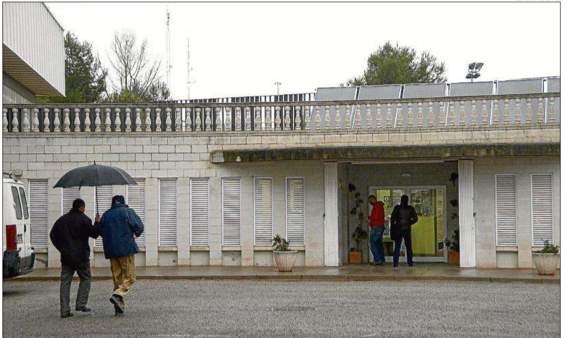
El poliesportiu és una de les instal·lacions esportives més utilitzades de la ciutat.

funcionar demà mateix perquè l'actuació destrueix la legionel·la, el consistori ha decidit tancar de