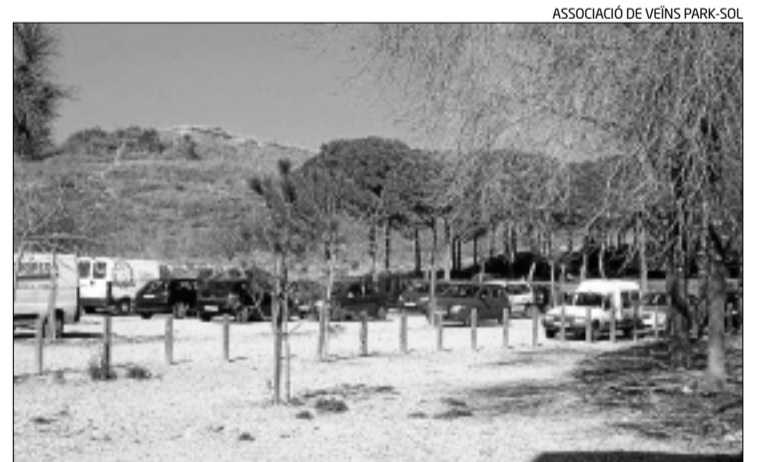
ASSOCIACIÓ DE VEÏNS PARK-SOL

Els agents també van detenir dos joves més la mateixa nit. Després d'intentar fugir, els van aconseguir atrapar.