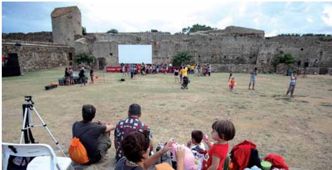
Festa a la Ciutadella en solidaritat amb el foc de l'estiu passat a l'Alt Empordà ■ LLUÍS SERRAT

TAMBÉ EN LA GESTIÓ DEL patrimoni, natural o històric. Allunyats de l'aturada en inversions culturals generalitzada, a Roses continuem invertint. L'any 2013 ve marcat a Roses per una renovada aposta en la valorització i millora del patrimoni cultural, especialment Ciutadella i castell de la Trinitat, posant tot l'èmfasi entorn a dos grans eixos: la potenciació de l'ús ciutadà i l'augment del seu atractiu com a element promocional i creador d'imat-