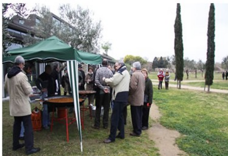
Periodistes espanyols, amb l'alcalde de Roses en primer terme a l'esquerra, a la Ciutadella de Roses