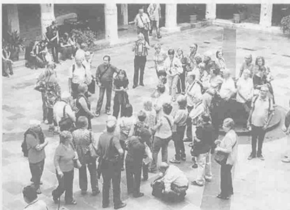
Les estades, entre els mesos de maig i octubre, són a destins propers de Catalunya, a rutes per Espanya i a circuits europeus