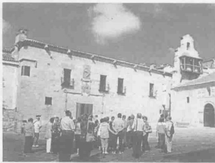
L'any passat van obtenir descompte 190 persones

Per poder optar als ajuts s'ha de lliurar el certificat de convivència amb data actual (que es pot fer a la mateixa oficina), la fotocòpia de notificació de pensió de la Seguretat Social del 2013 dels dos membres i la declaració responsable d'estar al corrent de pagaments amb l'Ajuntament de Sabadell, que es recull en el moment de la inscripció ■