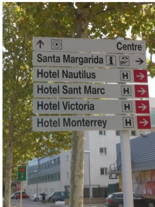
La senyalització correcte EMPORDA.INFO

Els interessats a instal·lar aquesta senyalització (que pot ser d'un màxim de quatre punts informatius per establiment), ja poden tramitar la seva sol·licitud a través del Servei d'Atenció al Ciutadà (SAC). La sol·licitud ha d'incorporar la situació exacta de l'establiment, una proposta d'ubicació dels senyals sol·licitats i l'abonament de les taxes municipals corresponents, que seran de pagament anual. Un cop autoritzada la concessió, aquesta tindrà vigència per un període de cinc anys.