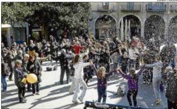
La plaça de l'Ajuntament va acollir unes sardanes amb toc de circ.

de l'espectacle vermell. Ahir i tot i la tramuntana, desenes de persones es van aplegar per ballar sardanes ambientades al circ, on no van faltar màscares i bombolles al ritme de la música. A la nit, una de les novetats de l'edició d'enguany: el teatre municipal també es va afegir als escenaris amb un toc de màgia. Mentrestant, el prestigiós jurat està analitzant les atraccions dels 63 artistes convidats de fins a 13 països diferents i, segons el director, està «meravellat» amb el que ha vist fins ara. Dilluns, a l'espectacle d'Or hi haurà els millors números escollits.