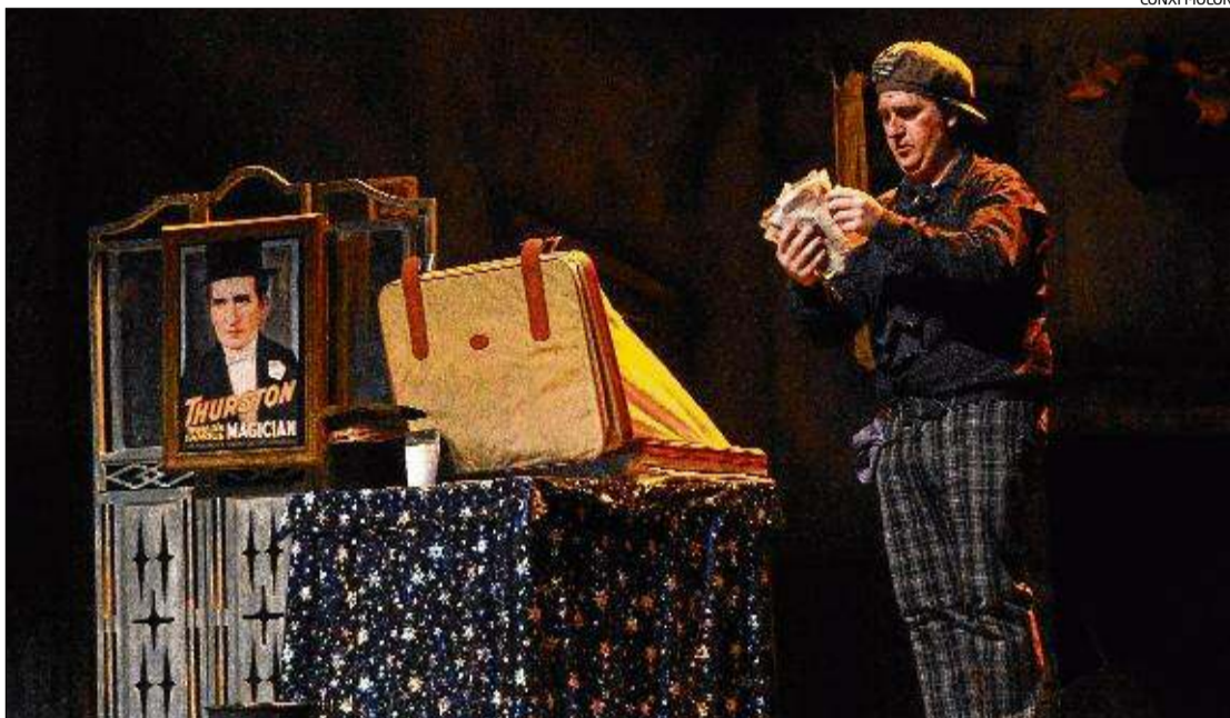
Un dels espectacles de màgia i riures que es va representar ahir a la nit al Teatre Jardí.

Amb plens gairebé absoluts, ja s'han representat fins a cinc actuacions i avui n'hi haurà tres més