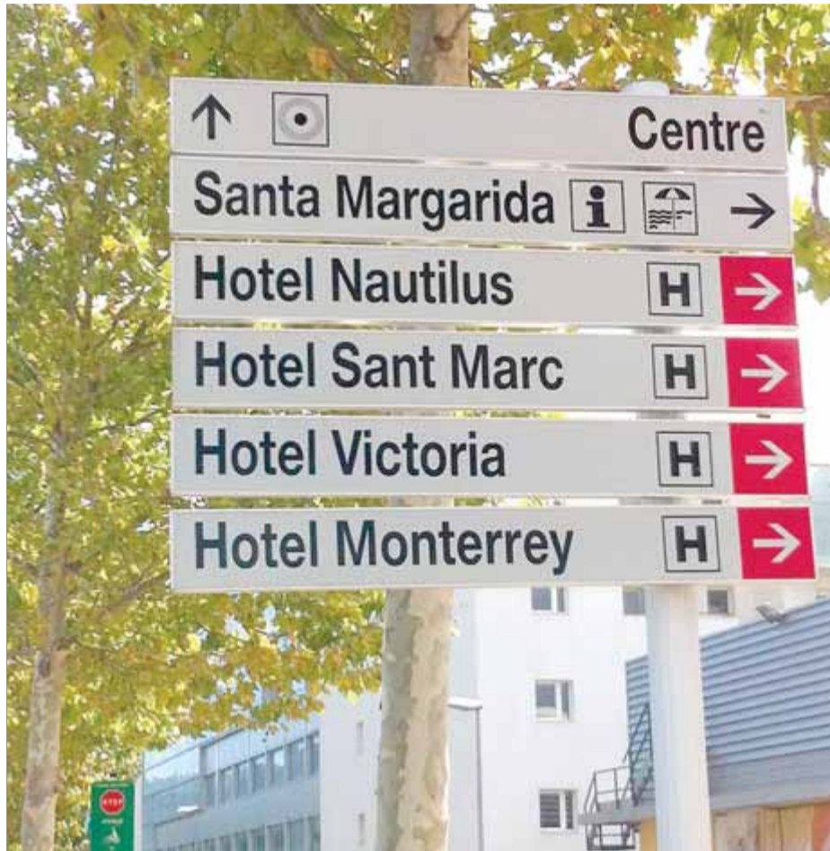
La senyalització unificada a què s'hauran d'adaptar els establiments de Roses ■ EL PUNT AVUI

La nova ordenança defineix les característiques físiques que han de reunir aquests senyals (suport, tipus de lletra, nombre d'indicadors per senyal...), i l'Ajuntament s'encarregarà de col·locar-los i fer-ne el manteniment. Els establiments interessats a instal·lar aquesta senyalització (que pot ser d'un màxim de quatre punts informatius per establiment),