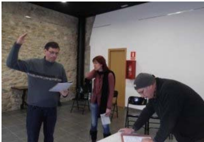
Imatge dels assajos de 'Cava, caviar i ostres!' teatrelafaternitat.blogspot.com.es

El desastre comença quan descobreixen el cos d'un desconegut atrapat a la finestra de l'habitació. Desesperat, el ministre truca al seu secretari per l'ajuda a desfer-se del cos. La història es complica amb l'arribada del marit de la diputada, de la dona del ministre i d'una cambrera sense escrúpols.