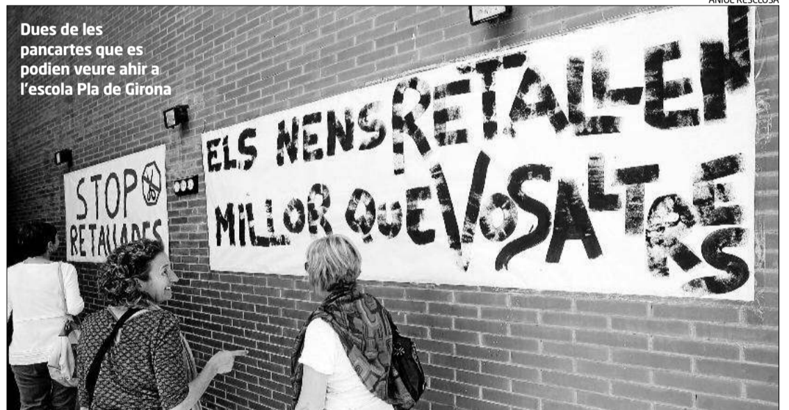
Dues de les pancartes que es podien veure ahir a l'escola Pla de Girona

De moment, la llista inclou els tres instituts d'Olot, Montsacopa, Bosc de la Coma i Garrotxa: informant que el primer celebra assemblees periòdiques per analitzar les restriccions; el segon està recollint signatures entre el professorat per subscriure una carta de protesta que envarien a la consellera Irene Rigau; i el tercer mani-