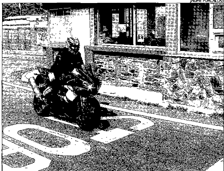
Les cabines de la carretera N-260 entre Portbou i Cerbère.

► Les antigues cabines de la duana es mantenen a la carretera N-II, al Pertús i la N-260 i es troben molt degradades