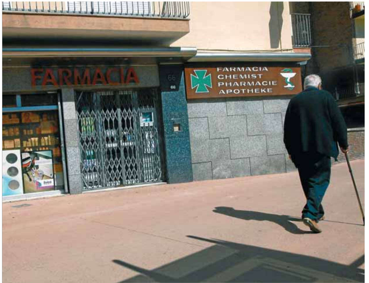
Una de les farmàcies de Lloret de Mar, fotografiada divendres