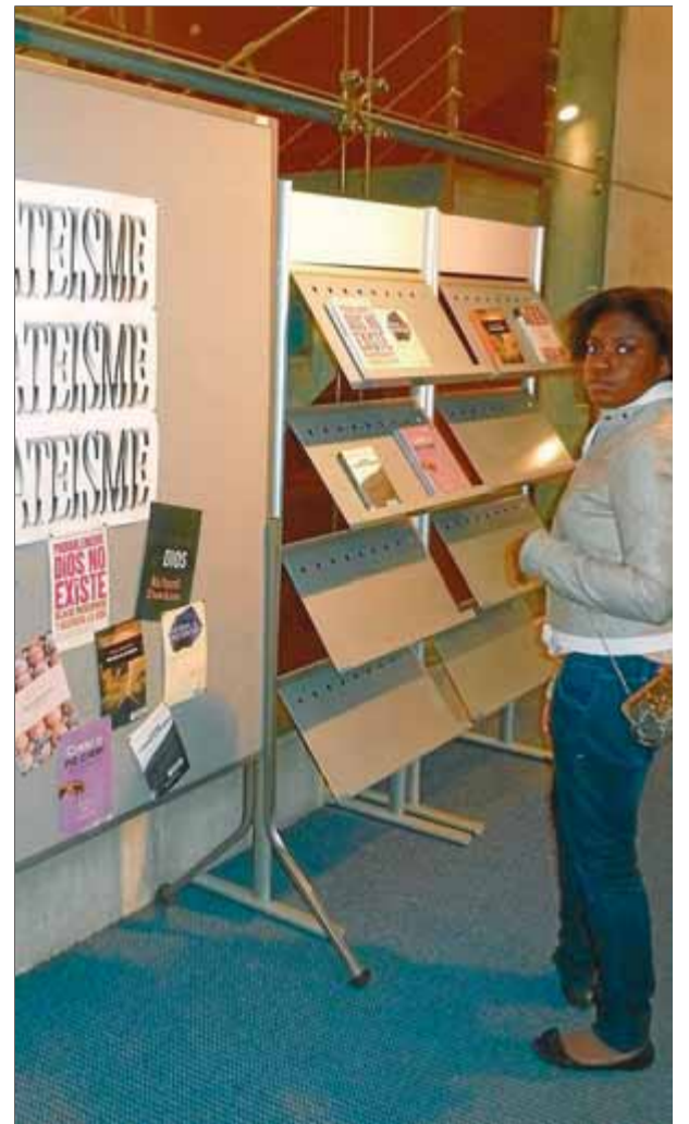
El cartell i les lleixes amb els llibres sobre ateisme de la biblioteca que han indignat a E-cristians