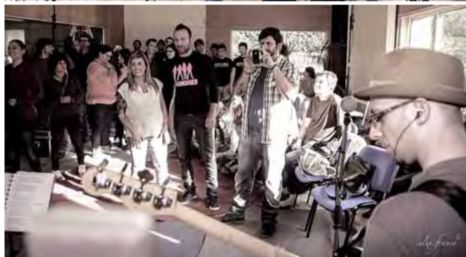
Dirty Jobs, a Music Lan, gravant el seu disc davant del públic

çons amb moments més relaxats i de xerrada informal entre els músics i els assistents a aquesta experiència única.