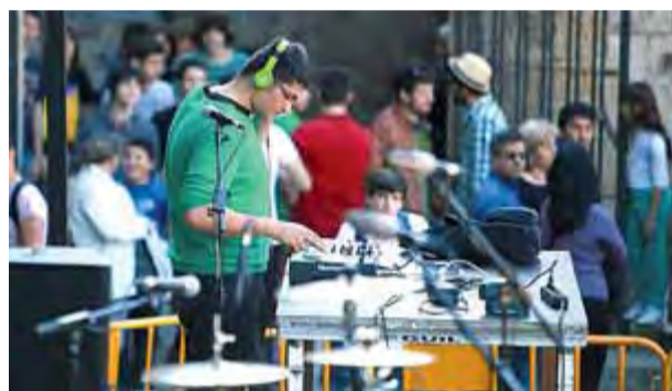
EL PUNT AVUI

d'Estudis Comarcals del Ripollès, s'emmarca en la capitalitat de la cultura catalana que ostenta la vila. El Recercat ofereix conferències, exposicions i taules rodones relacionades amb les últimes investigacions sobre el patrimoni local i comarcal, i una fira dividida en àmbits territorials en què es poden trobar les publicacions dels centres d'estudis. També hi ha previstes visites als espais subterranis de la nau central del monestir i al Museu Etnogràfic. ■ J.C.