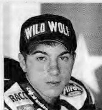
Maverick llega líder a Jerez

El piloto de Roses llega a Jerez como líder de Moto3 después de la demostración de fuerza realizada en el gran premio inaugural de Catar. Pero a pesar de todo no baja la guardia, todo lo contrario. Maverick tiene fresco en la memoria su papel en los últimos entrenamientos de pretemporada tal como recuerda al explicar que "será un Gran Premio más complicado que el de Catar, porque en los tests de