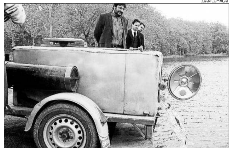
Responsables del Consorci de l'Estany durant l'alliberament de barbs.

Ahir es van alliberar 600 exemplars de barbs de muntanya a l'Estany de Banyoles i, durant aquest any, s'arribarà fins als 7.000; a banda d'un miler més a l'estanyol del Vilar i 500 a la bassa de la Draga. Aquests dos últims indrets es van utilitzar com a prova pilot durant l'any passat per estudiar la reintroducció d'aquesta espècie i també la bagra. Aquesta és la que de moment ha donat senyals més evidents de bona adaptació. «Hem comprovat que s'han establert bé, han crescut i tenen bona salut», va