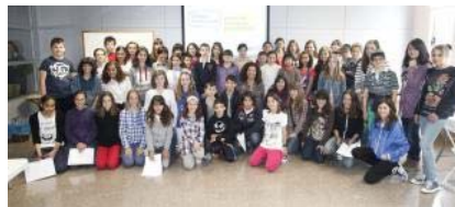
54 alumnes de 6è als I Premis Diàlegs d'Educació

EMPORDA.INFO Un total de cinquanta-quatre alumnes de 6è de primària de trenta escoles de l'Alt Empordà han participat aquest dissabte passat en la primera edició dels Premis Diàlegs d'Educació de Narrativa Periodística, que han organitzat conjuntament el Servei Educatiu de l'Alt Empordà i el Setmanari de l'Alt EMPORDÀ. Van ser convocats a la seu del Servei Educatiu per redactar els seus treballs, a partir d'un text motivador de la narració