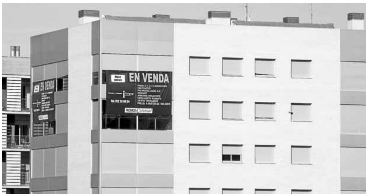
Les promocions d'habitatges per vendre s'acumulen a les comarques gironines ■ JOAN SABATER