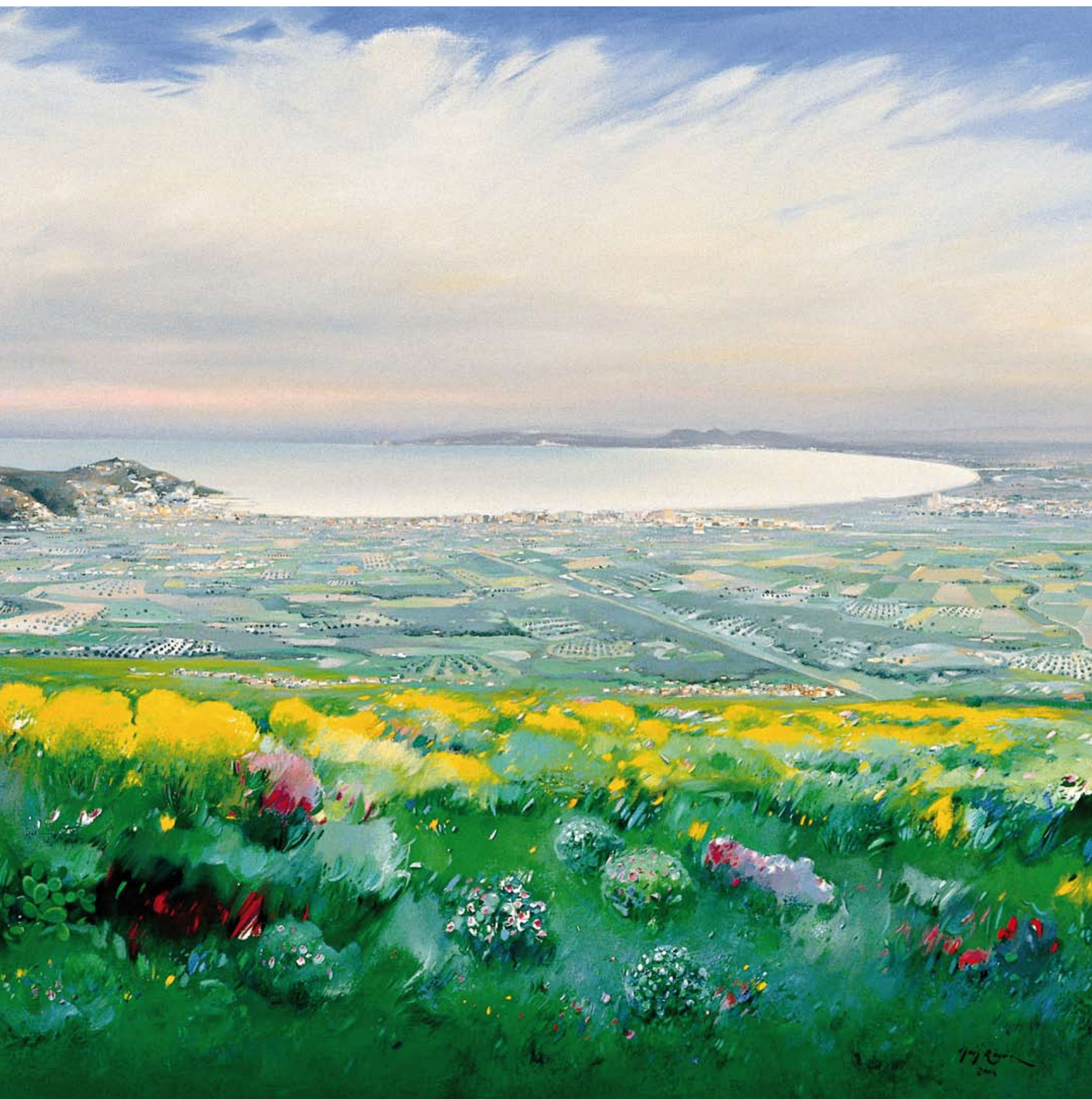
Fragment del quadre "La badia de Roses" (2004), de Lluís Roura. 1.20 m x 4 m. Col·lecció Hotel Terraza, Roses