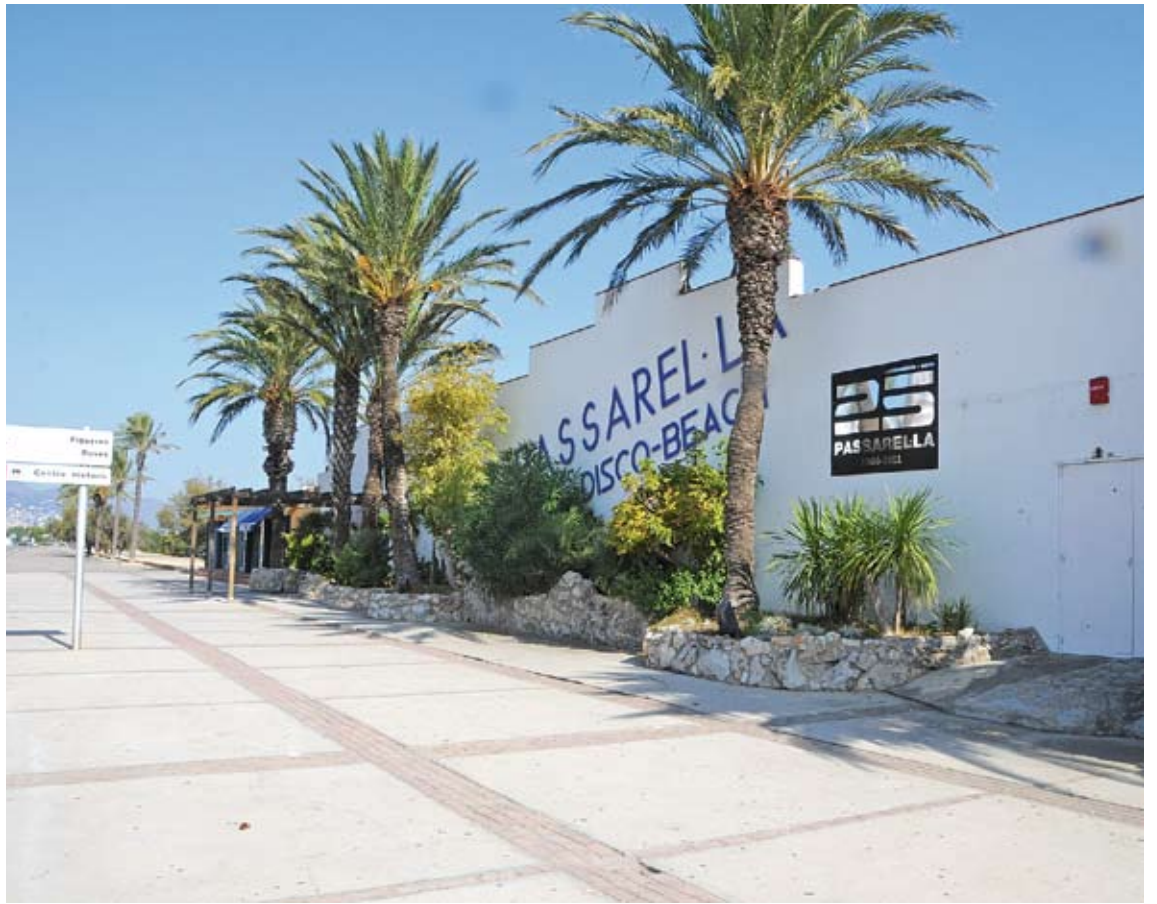
LA DISCOTECA. Està ubicada al passeig marítim d'Empuriabrava i aquest estiu no podrà obrir perquè ja no hi ha concessió LL.LLAURADÓ

En el document que justifica la recollida de firmes, els impulsors lamenten que el projecte que hi ha per a aquesta nova temporada turística (l'Ajuntament de Castelló d'Empúries està licitant vuit guinguetes on s'oferiran tots els serveis) "és molt vague i consta d'una improvisació absoluta". Segons ells, "aquesta mesura contribuirà a un vertiginós descens d'estiuejants i visitants joves