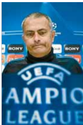
Mou, amb mala cara

Totes les mirades es dirigeixen al tècnic portuguès. El Bernabéu estava encès, el marcador jugava al seu favor, però lluny de matar el seu rival abans, va ordenar la retirada i després no va tenir l'empena per fer els canvis que revolucionessin l'equip quan el Bayern li te-