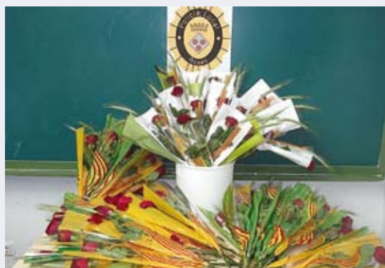
UN CENTENAR DE ROSES. Es venien de forma il·legal

Les roses decomissades es van lliurar el mateix matí a la residència geriàtrica Nova Vida per als avis del centre. ■