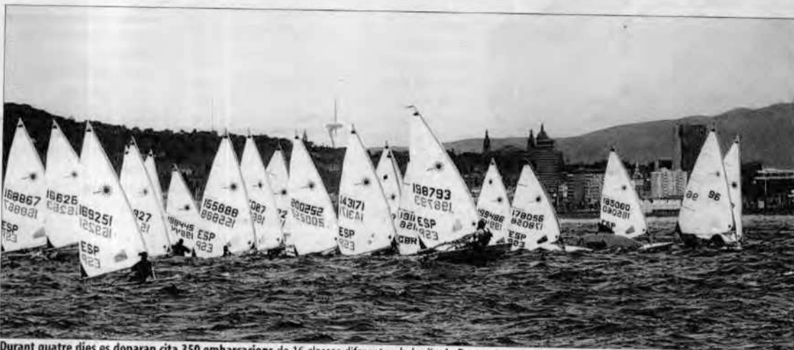
Durant quatre dies es donaran cita 350 embarcacions de 16 classes diferents a la badia de Roses per competir

La festa de la vela se celebrarà a la ciutat empordanesa també els dos anys vinents