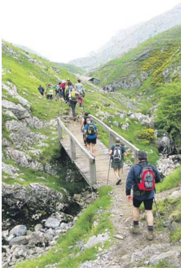
Aralar. El recorrido discurre por la sierra.