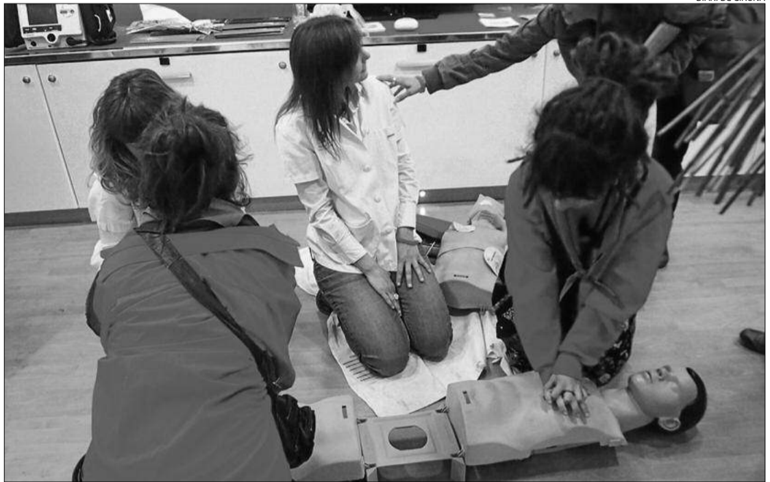
Una demostració al Bus de l'UCI instal·lat aquests dies a Girona.

La campanya va consistir en un autobús adaptat en el qual els assistents van poder comprovar de primera mà com és el dia a dia en una UCI. Els gironins que s'hi van