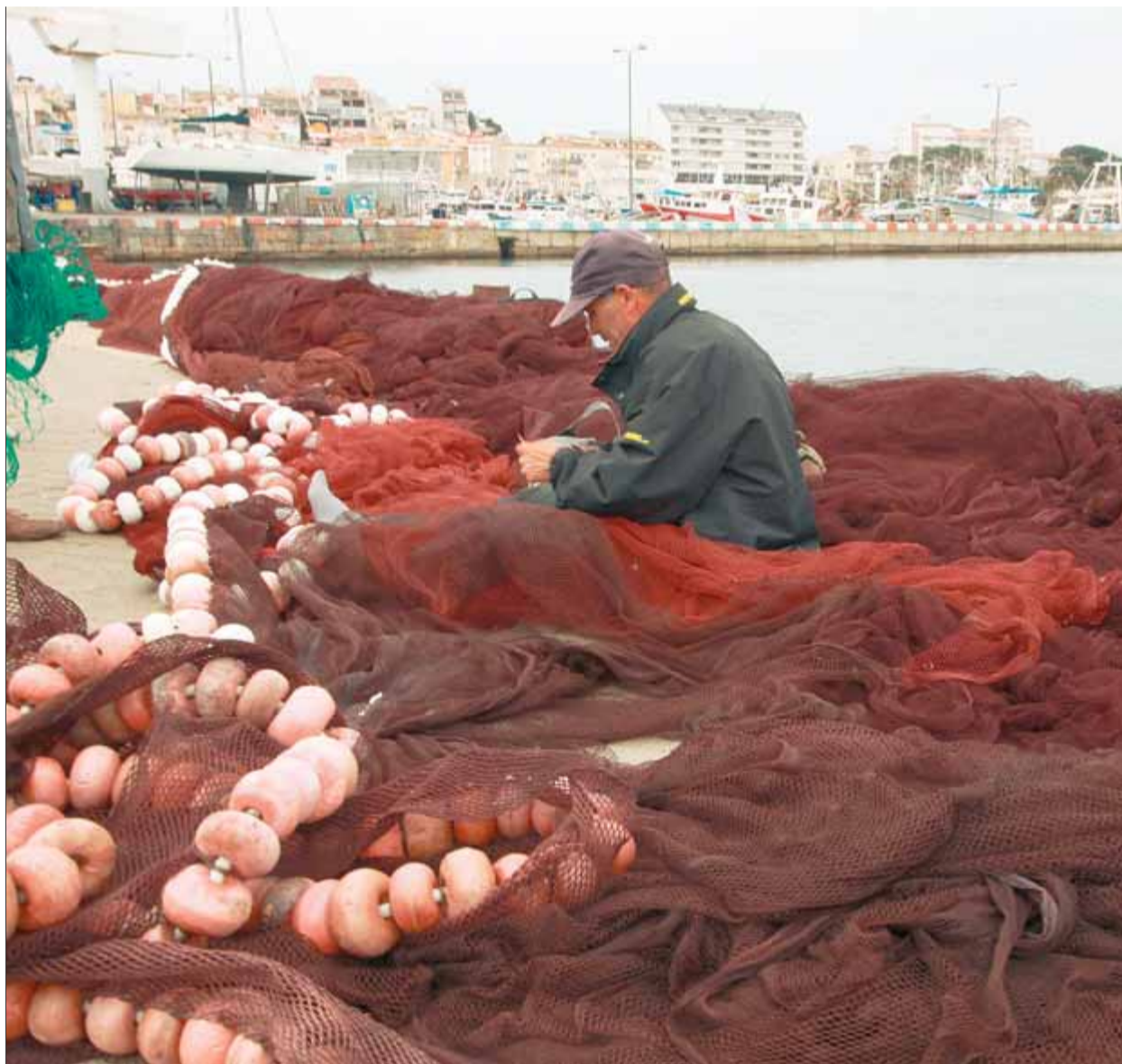
Un pescador reparant xarxes, ahir a la tarda al moll de Palamós, en l'última setmana de veda de la gamba