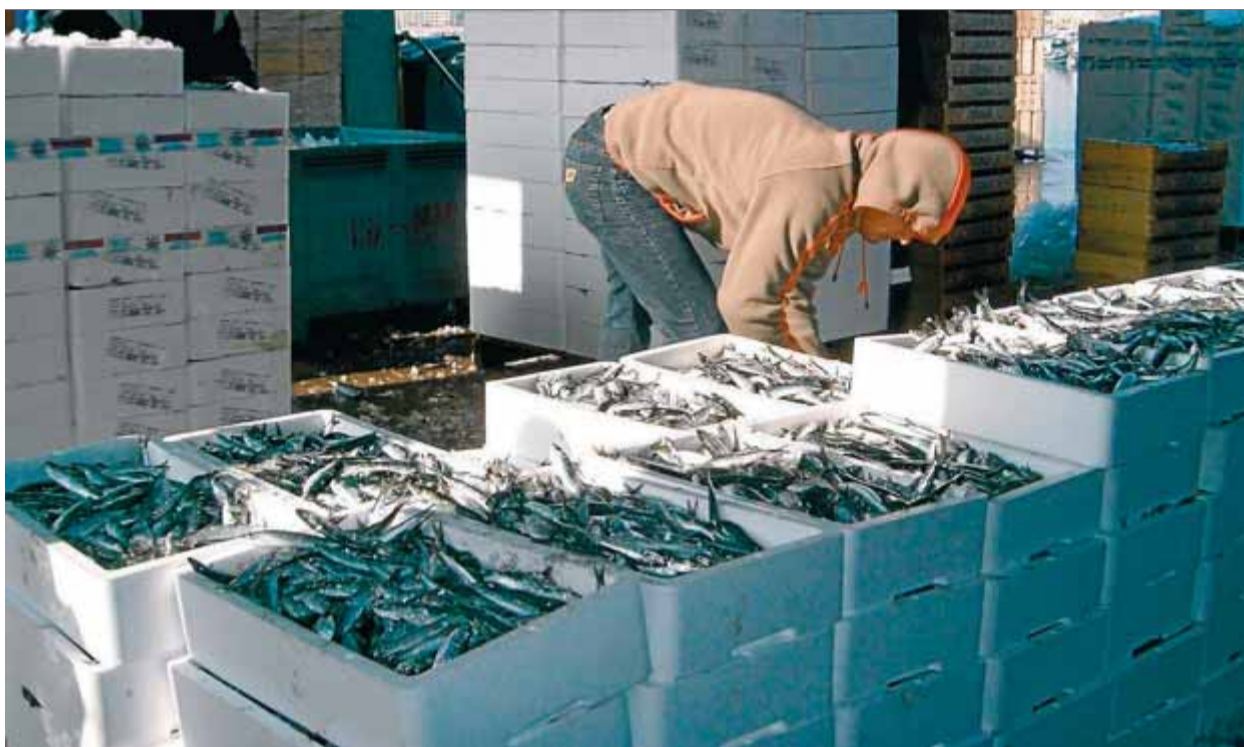
Un pescador de l'Escalà posant el peix en caixes per portar-lo a la llotja, en una imatge d'arxiu

Els transportistes exigeixen el sobrecost de l'autopista a l'Estat