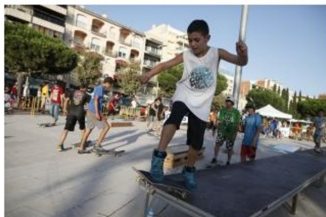
El campionat d'skate de l'any passat a Roses va tenir molt d'èxit.

EMPORDA.INFO El passeig marítim de Roses acollirà, aquest dissabte (de 16 a 21 h), la segona edició de l'exhibició i el campionat de skateboard, organitzat per l'Ajuntament amb la participació del Club Esportiu Skateboard de Roses. Skaters de tota la província participaran en una activitat amb molta tirada.