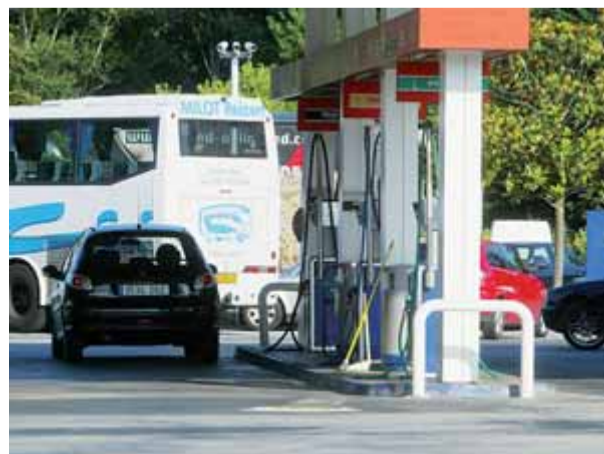
Una gasolinera de Vidreres i una de Sarrià, entre les que tenen els preus més competitius de Catalunya ■ EL PUNT AVUI

L'informe de l'OCU revela quines són les gasolineres més barates per proveir de dièsel i gasolina 95 a Catalunya quan se circula per les vies A-2 i A-7. En el cas de l'A-2, les més assequibles són al polígon El Segre 201 a Lleida i al quilòmetre 575 de l'N-II a