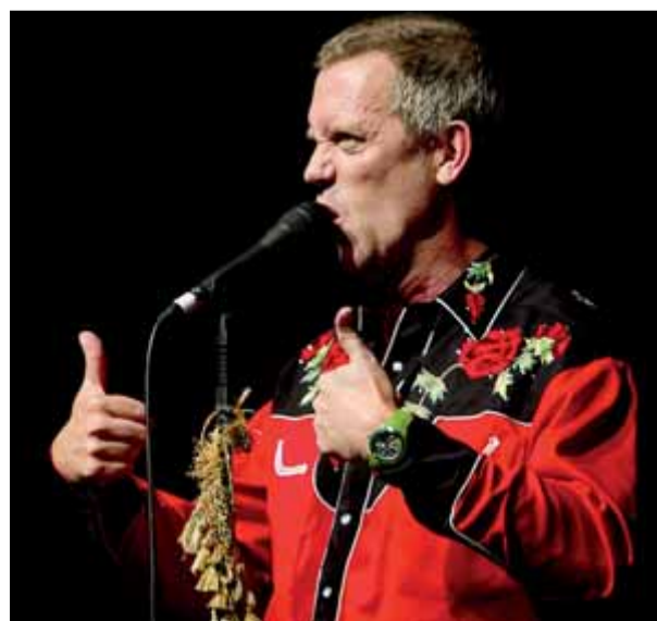
Hugh Laurie, l'actor de 'House', dijous en el seu recital a l'Artèria Paral·lel de Barcelona

Dijous, però, a l'Artèria Paral·lel la mitomania es va imposar sobre qualsevol altre criteri. Gent fent