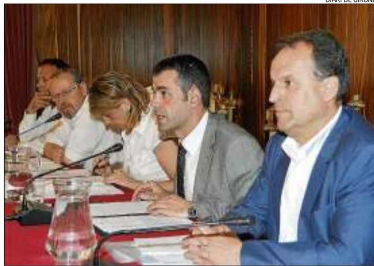
Una sessió plenària a l'Ajuntament de Figueres.