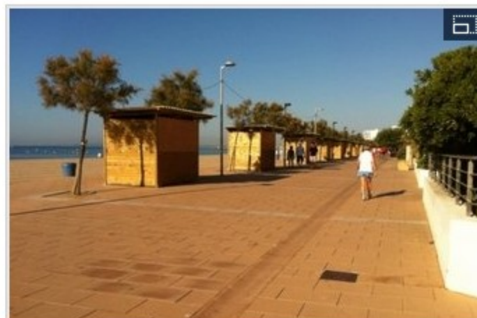
Roses crea un mercado de artesanía para combatir el 'Top Manta' aj.Roses.