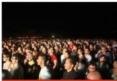
Un nombrós públic es va aplegar ahir al recinte de la Ciutadella

El festival s'ha volgut acostar encara més a l'enologia. En aquest sentit s'ha treballat més que mai en la promoció dels cellers participants. Amb això es va realitzar un acte de presentació dels cinc vins a l'Escola d'Hostaleria de l'Alt Empordà, tots els grups participants han parlat del seu maridatge durant el concert i s'ha comptat amb varis mitjans especialitzats en el món del vi que han donat cobertura informativa durant el festival.