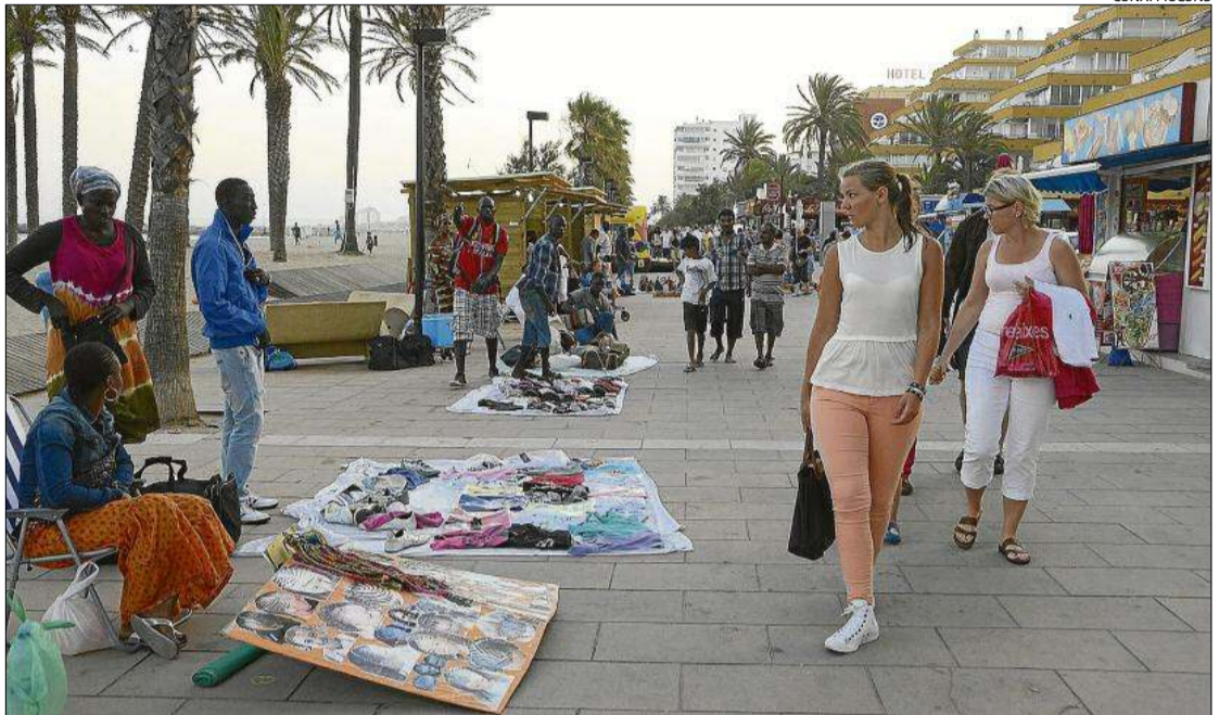
Venedors ambulants situats al costat del mercat, dijous al vespre.

Adverteixen que cada vegada tenen una actitud més violenta i que es posa en perill les forces de seguretat en les seves actuacions, i «de la mateixa manera, s'atempta contra la seguretat dels turistes i usuaris, causa danys a la imatge turística de tot el país». «Frau fiscal, competència deslleial, ocupació il·legal del domini públic marítim terrestre i, tot junt, és causa d'alarma social al ser una evidència de la importància de l'autoritat de qui ha