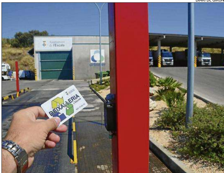
La deixalleria municipal on s'implanta el servei.

A la deixalleria, situada al polígon industrial, en aquest moment no hi havia cap control dels usuaris que la utilitzaven. Això suposava que persones d'altres poblacions la utilitzessin i «generava un important volum per gestionar, amb una part dels residus que eren d'altres municipis». Amb el nou sistema, per accedir s'haurà de disposar de la tarja identificativa.