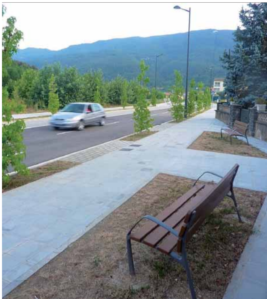
Bancs i arbres d'un carrer del Pla de Bastons, ahir al vespre