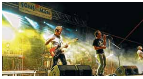
Love of Lesbian, divendres passat a Roses ■ PROMO ARTS

El festival Sons del Món, que organitza Promo Arts Music a Vilabertran i Roses, va tancar divendres la seva cinquena edició amb el concert de Love of Lesbian a la Ciutadella. L'organització fa un bon balanç d'aquesta cinquena edició, en què el festival ha aconseguit mantenir, malgrat la crisi, el nivell d'as-