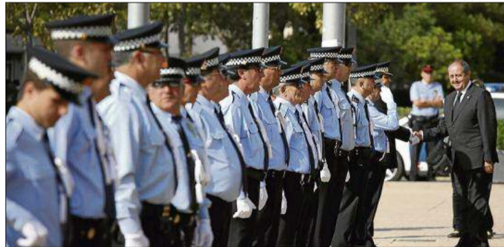
La festa de la policia local de Roses.

Segons han informat des de Comissions Obreres, el motiu d'haver decidit portar a terme la protesta és «la imposició per part de l'Ajuntament, sense voler negociar ni parlar amb el representant dels treballadors i portaveu de la policia local, una jornada laboral superior a la ja dictada pel govern de l'Estat». En aquest sentit han anunciat que «la manca de respecte i la negativa a voler par-