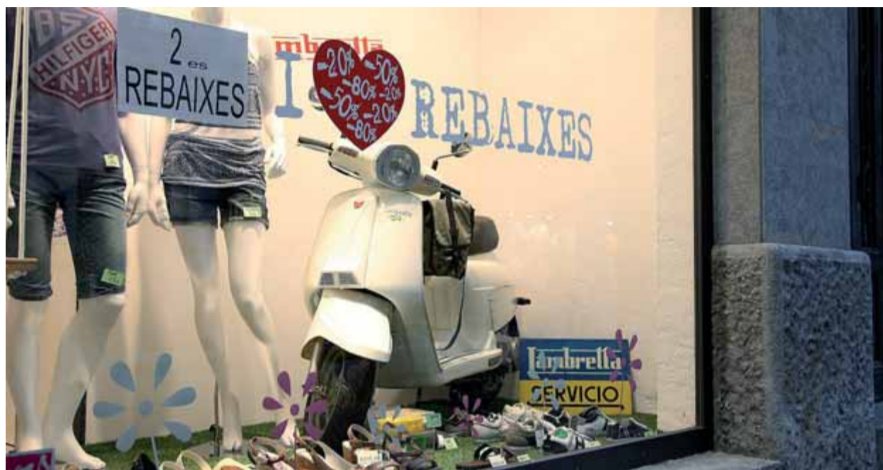
Un aparador del carrer Santa Clara de Girona que ahir ja havia penjat el rètol de segones rebaixes