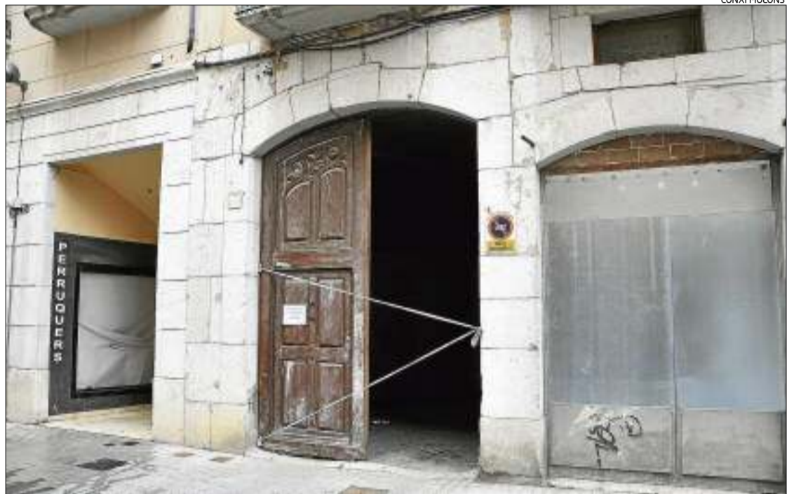
A l'entrada de l'espai, del qual s'utilitzava un garatge, està precintada a l'espera de fer-hi actuacions.

Els fets van tenir lloc fa un parell de setmanes. Les intenses pluges que van caure van acabar de malmetre part de l'estructura de l'interior. I és que l'edifici consta d'una entrada on hi ha un gual per accedir a un garatge –l'única part que ara s'utilitzava– i un seguit d'habitatges al voltant d'una mena de pati obert, on feia temps que no vivia ningú. Segons van explicar fonts municipals, va desprendre's una part de paret. La teulada va acumular aigua i va enfonsar-se un troç del forjat. Això va obligar a fer-hi una inspecció que va determinar que no hi havia perill però es va procedir al precintat de l'entrada i a requerir a la propietat que «de-