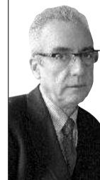
Juan José Millás

Quant al PSOE, entretingut com es troba amb els problemes de la seva abstracció, no reacciona a tanta insensatesa. I de retornar-nos el vot, res.