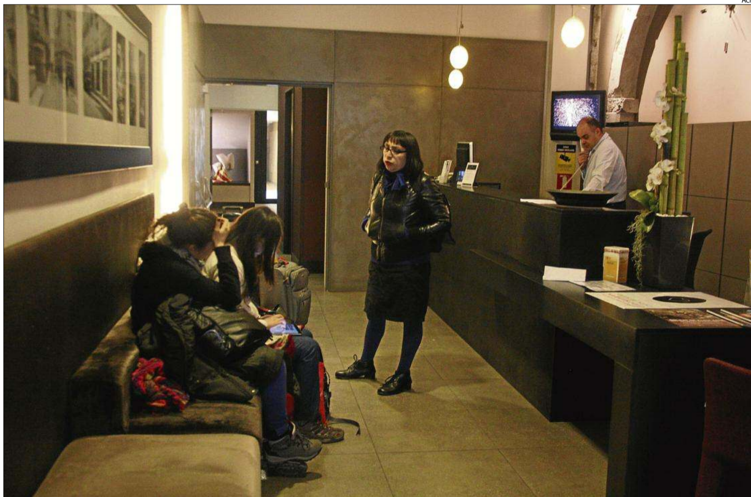
Uns clients a la recepció d'un hotel de Girona el dia de Tots Sants.