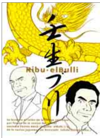
El manga 'Mibu-elBulli' recoge el intercambio gastronómico entre Ishida y Adrià. Ahora, en español.

En Mibu-elBulli los Ishida enseñaron a Adrià el arte de la sutileza, otra manera de ver el mundo: a