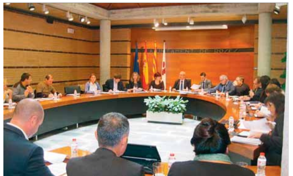
El ple de Roses va aprovar ahir les noves ordenances fiscals per a l'any 2013

ment també assumirà l'augment de l'IPC (3,4%) i la pujada de l'IVA perquè no repercuteixin en els contribuents, fet que representarà un sobrecost d'uns 500.000 euros en la despesa municipal. Entre rebaixes i congelacions, el govern calcula que l'Ajuntament el 2013 recaptarà 1,5 milions d'euros menys d'ingressos, que es compensaran gràcies al superàvit dels comptes municipals i amb austeritat en la gestió dels serveis municipals. Entre altres novetats, Roses introduirà bonificacions d'entre un 20 i un 50% per als establiments amb terrasses a la zona del passeig que si-