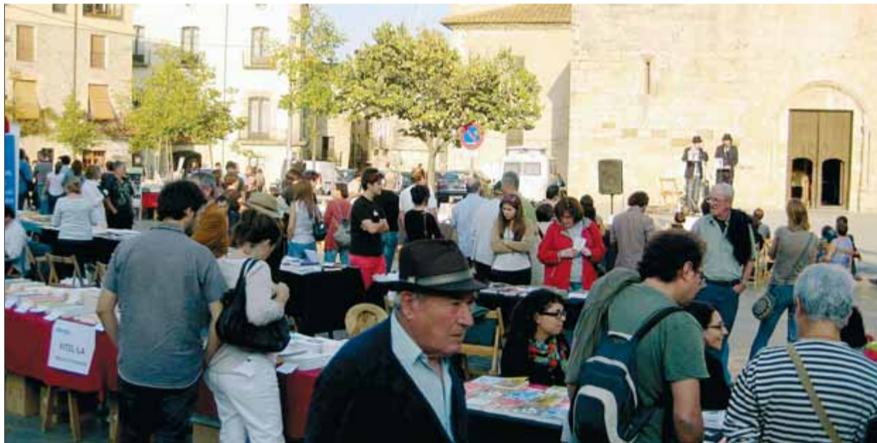
El Prat de Sant Pere, on hi ha les parades de les editorials, en l'edició de Liberisliber de l'any passat

El responsable de Liberisliber ha arribat a aquesta conclusió arran que el departament de Cultura hagi concedit a la fira una subvenció de tan sols 2.300 euros, mentre destina el triple –compara Codes– a una sola actuació musical de la Setmana del Llibre en Català, 520.000 euros al pavelló d'art de la Biennial de Venècia o 198.000 euros al catàleg de masies que va elaborar un