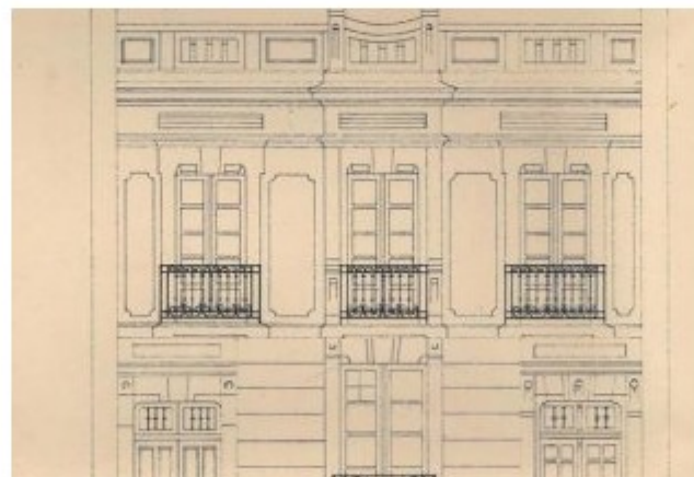
El document del mes de l'arxiu recull el plànol d'una casa construïda a l'actual carrer Doctor Pi i Sunyer durant els anys 1930-1931