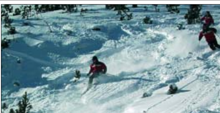
FGC gestiona cinco estaciones de esquí en Catalunya

FGC ofrece ventajosos forfaits conjuntos para sus estaciones de esquí