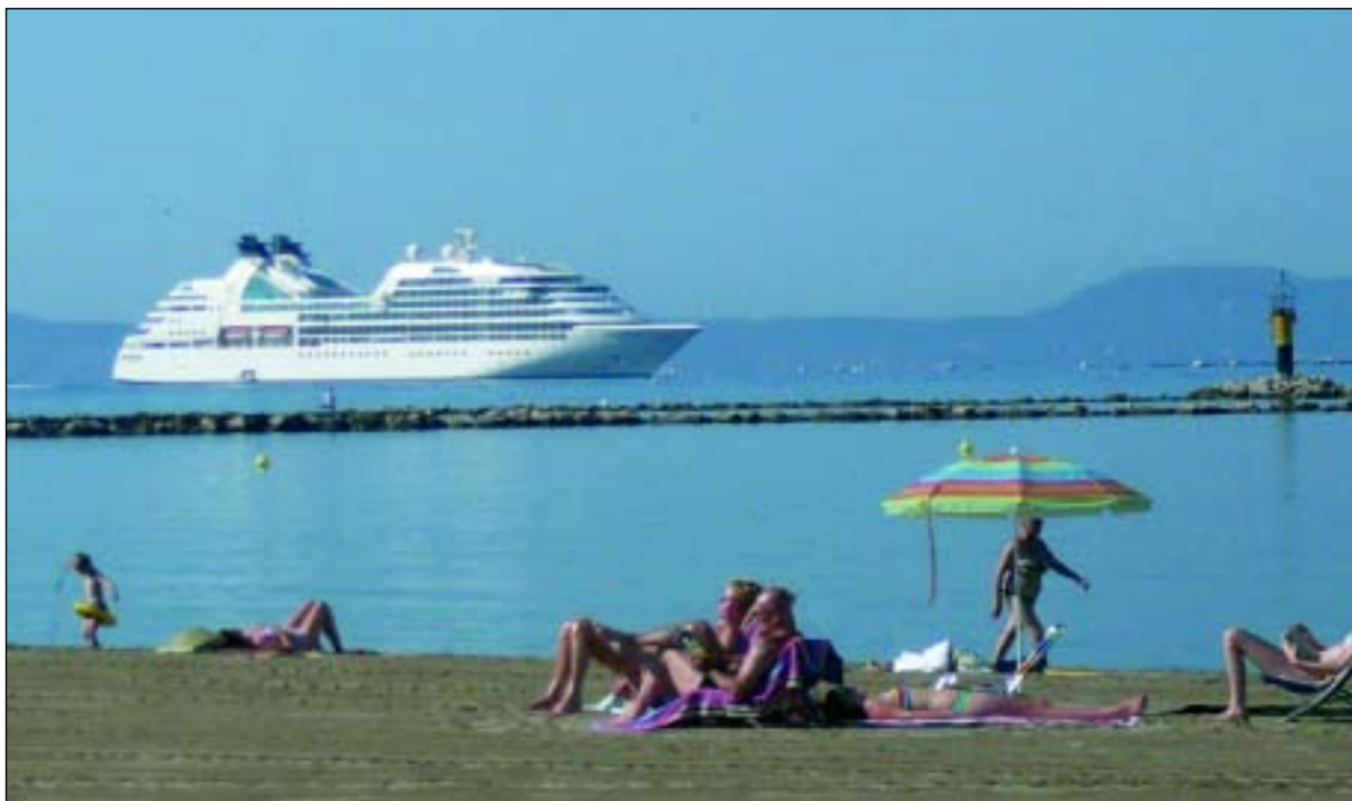
Para el próximo año, el puerto catalán espera recibir 7 cruceros

En cuanto a las visitas realizadas por los pasajeros han sido principalmente Roses, donde muchos de los visitantes han mostrado su interés por la gastronomía local, su zona comercial y otros lugares de interés, como los caminos de ronda. Asimismo, los turistas de crucero también han solicitado excursiones a Figueras para visitar el museo Dalí, Cadaqués, Portlligat y Girona. Además, algunos pasajeros han hecho catas de vinos en bodegas del Alt Empordà y una excursión