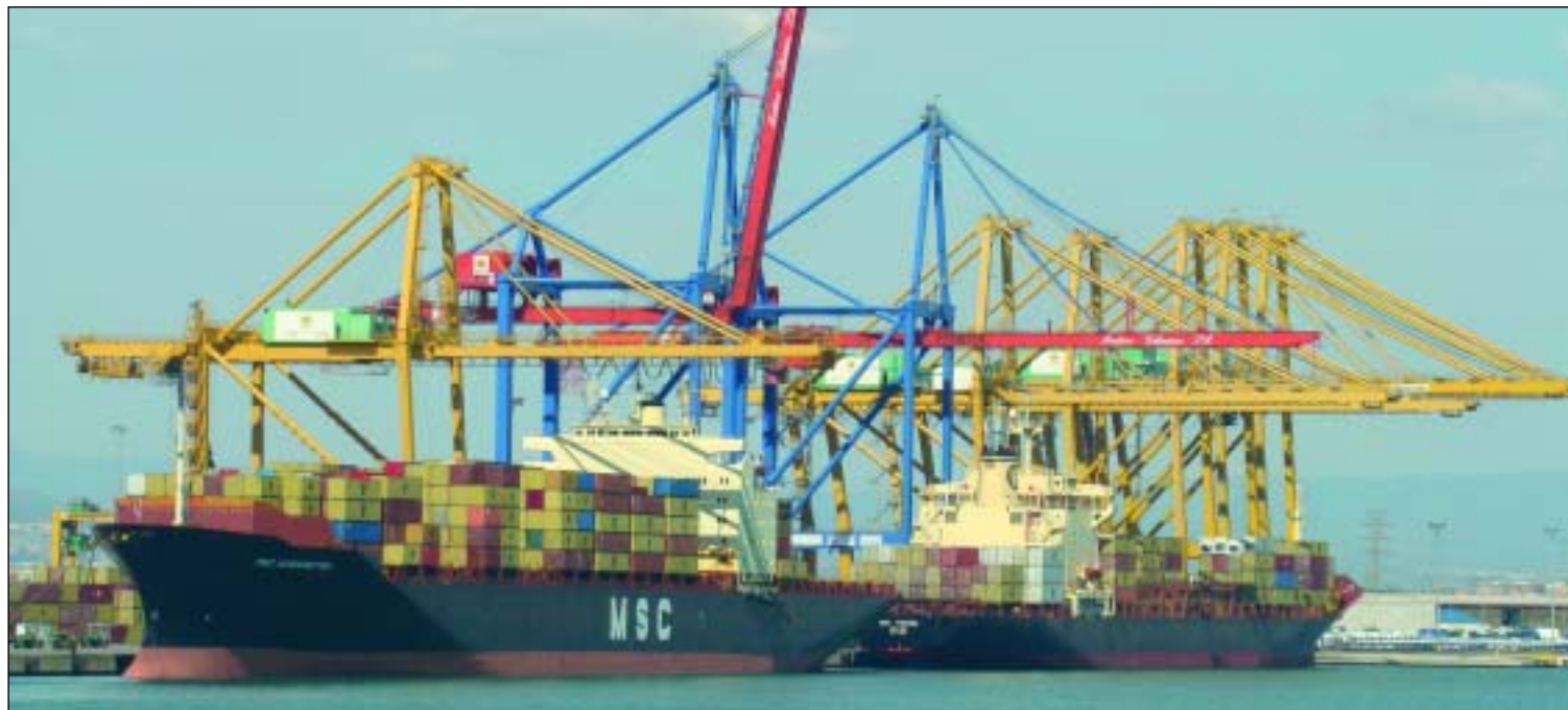
Terminal de Noatum en el puerto de Valencia