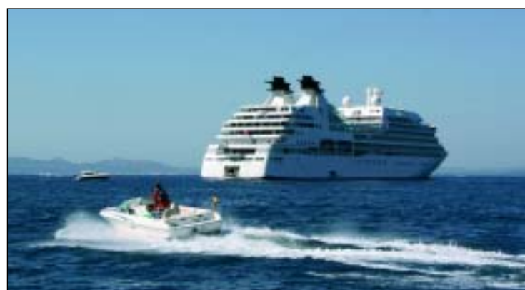
Un crucero fondeado frente al puerto catalán

V Congreso Internacional de Transporte en Castellón