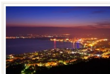
La badia de Roses

Actualment els quatre ajuntaments implicats treballen en la creació d'un ens comú que ha de permetre desenvolupar actuacions conjuntes com a badia de Roses, difondre internacionalment el reconeixement obtingut i elaborar un pla estratègic de turisme sostenible.