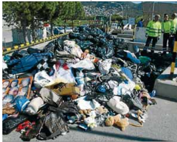
El 2011 es van requisar a Roses quatre tones de productes ■ ACN

La policia local de Roses va destruir la primavera passada quatre tones de material comissat a venedors de top manta que es van requisar l'estiu del 2011 en els gairebé 250 comisos fets pels agents rosincs, sobretot al passeig marítim de Santa Margarida. La majoria dels objectes que es van destruir eren falsificacions de primeres marques. Hi havia samarretes, bosses de mà, carteres, moneders, cinturons, ulleres i rellotges, entre altres articles de roba i complements. A més del perjudici econòmic que repre-