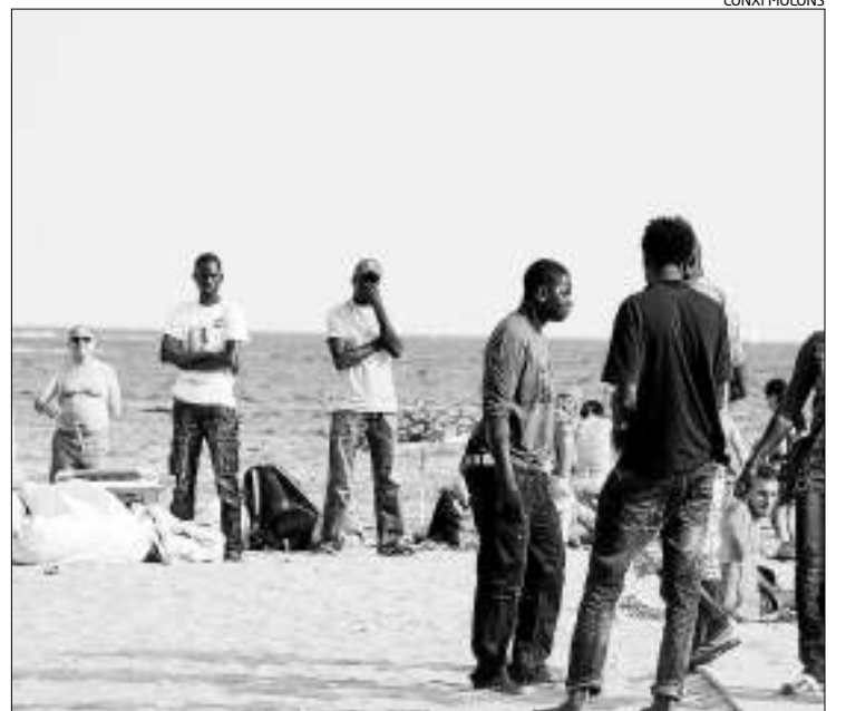
Els venedors, cinc minuts abans de la protesta fugint de Mossos.