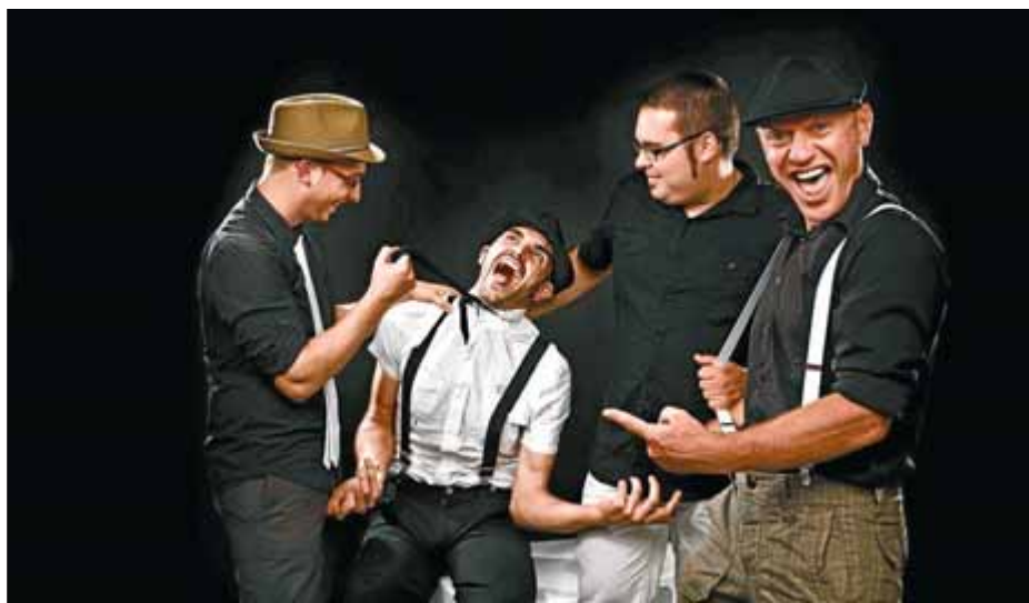
Dirty Jobs ■ CASSÚ RETRATISTA

Fins ara Dirty Jobs s'ha centrat sobretot en les versions i no li ha faltat feina: només al juliol van fer 22 concerts i aquest mes tenen previst fer-ne vint. Tot i això, la seva participació en el concurs Wolfest, que va tenir lloc l'any