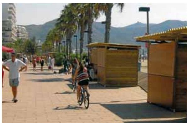
Les casetes de Santa Margarida quedaran buides