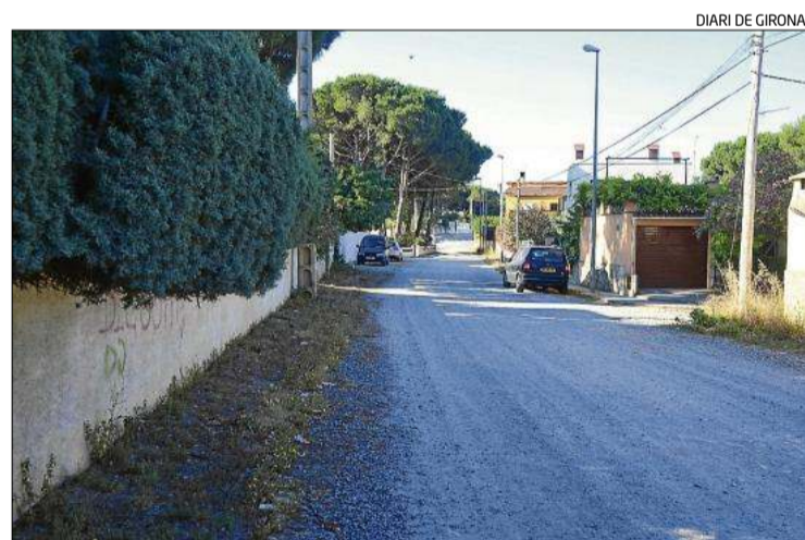
El carrer Tarragona, que com altres carrers no està urbanitzat.

destacar que el nombre de denúncies ha augmentat com a resultat de «la coordinació» i la «policia de proximitat».