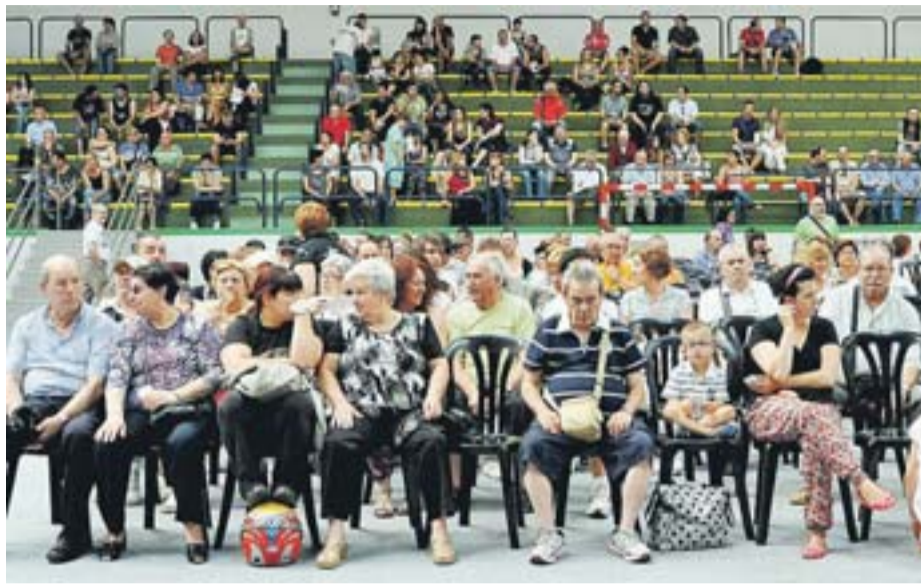
Cerca de 700 personas acudieron al sorteo de las viviendas de VPO en el Polideportivo de Galtzaraborda.