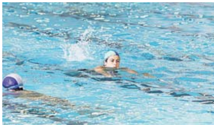
Busti Zaitetz. La campaña vuelve a Fanderia. :: ARIZMENDI

jan' reciben un diploma acreditativo y al término de la jornada, se suman los metros nadados en todas las localidades.