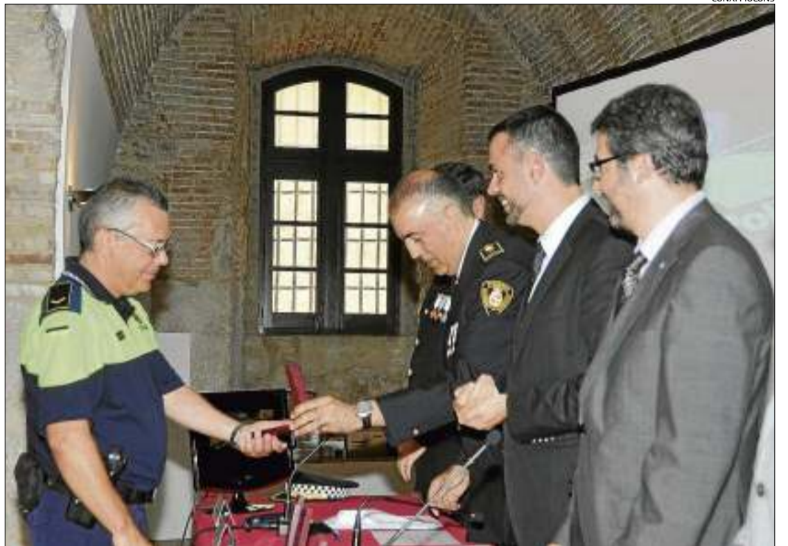
Una de les medalles que el consistori va atorgar amb motiu del Dia de la Guàrdia Urbana.

agents per diferents «mèrits» i es van atorgar medalles de plata i or a d'altres, pels anys que porten al capdavant del servei així com per les consideracions acumulades. La celebració, però, també va servir per fer balanç de les actuacions que durant l'any 2011 es van dur a terme. Riera va destacar que els de-