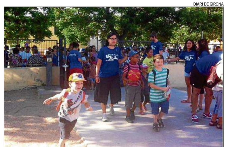
Els nens dilluns al casal d'estiu de Castelló d'Empúries.

Empordàlia és una empresa que des de fa més de 40 anys elabora vins i olis de qualitat de les collites de l'Empordà. Va posar en marxa l'espai l'Empordà a taula on poder adquirir productes locals i, a més, s'hi suma un espai gastronòmic per a portar a terme activitats relacionades també amb la cuina i els productes de qualitat empordanesos.