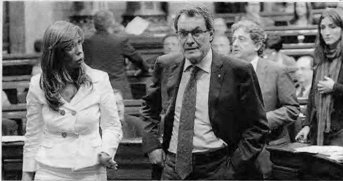
Alicia Sánchez-Camacho, junto a Artur Mas en un pleno del Parlament

El PP había incorporado en el acuerdo presupuestario de 2012 el compromiso para iniciar la construcción de cuatro centros de atención primaria en Barcelona, Badalona y Vilafranca del Pene-