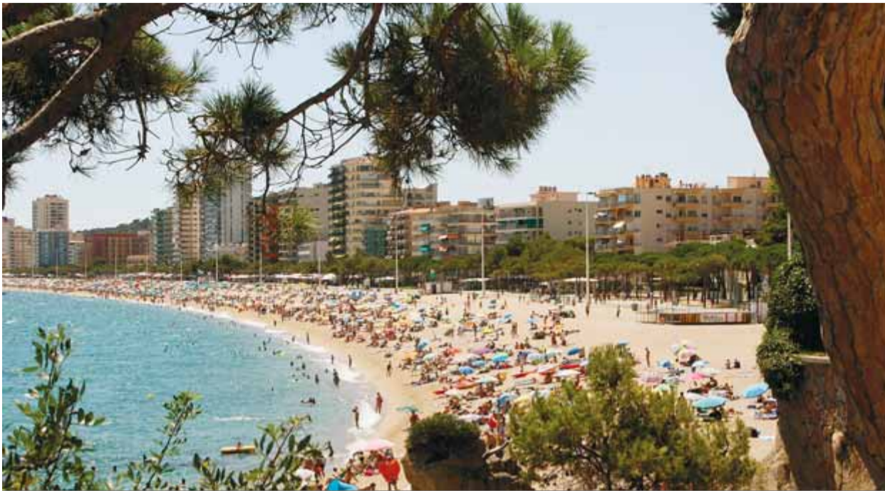
Edificis a primera línia de mar a Platja d'Aro, en una imatge d'aquest estiu