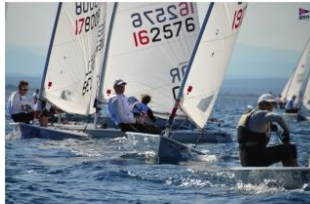
L'Europeu Laser Master de Roses s'ha acabat aquest divendres amb un èxit absolut.