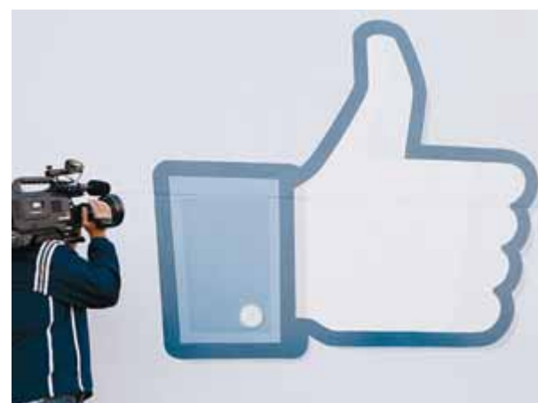
El símbol del "m'agrada" de Facebook ja és una imatge icònica d'àmbit mundial

compte. Segons va descobrir un expert en seguretat 2.0, quan un usuari envia a un altre en un missatge privat de Facebook l'enllaç d'un web, de manera automàtica s'afegeixen dos "m'agrada" a aquesta pàgina, sense que cap dels dos usuaris l'hagi hagut ni