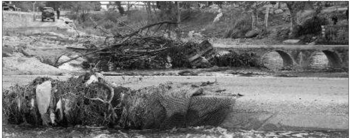
L'efecte de les pluges sobre el riu Llobregat on s'acumulen les restes vegetals.