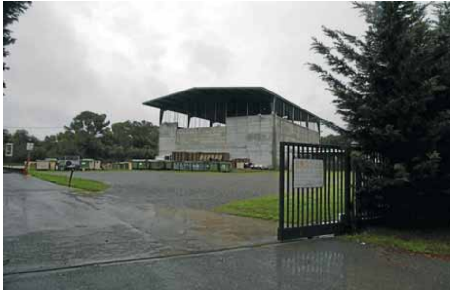
La planta de transferència construïda el 1998 i a tocar dels camps on projecten la nova