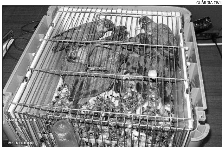
Els animalons viatjaven atapeïts en dues gàbies.