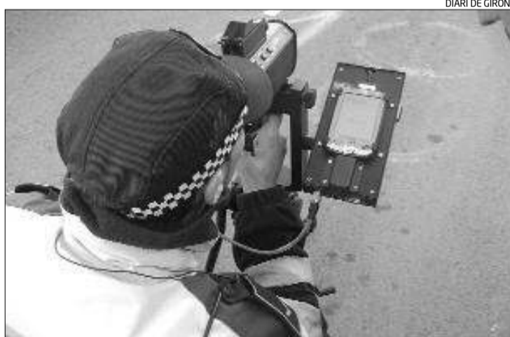
Un agent controlant el trànsit amb el nou dispositiu.

Ctra. de Pontós a Figueres, s/n - 17773 Pontós Tel. 972 56 02 55 - Mòbil 610 29 34 53 - canoliver@canoliver.com / www.canoliver.com