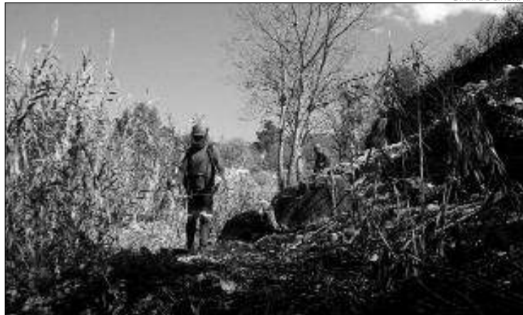
Els treballadors d'Altem en un punt de la Jonquera.

► El servei d'Altem que ha contractat la Diputació ha començat per la Jonquera i s'actuarà a Capmany, Biure i Pont de Molins