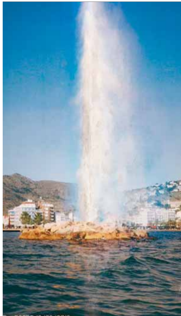
Fotomuntatge del projecte de sortidor gegant que es preveu instal·lar a Roses