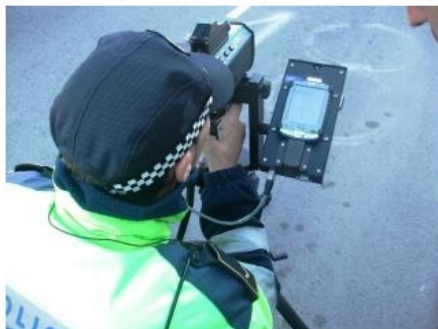
El dispositiu és radar mòbil d'última tecnologia cedit pel Servei Català de Trànsit Ajuntament de Roses

EMPORDA.INFO La Policia Local de Roses incorpora des d'aquest dijous un nou dispositiu per controlar la velocitat dels vehicles que circulen pel casc urbà de la població. El dispositiu, consistent en un radar mòbil d'última tecnologia cedit pel Servei Català de Trànsit, servirà per millorar la seguretat del trànsit dins del municipi i actuar amb més eficàcia en aquells punts que presenten una major sinistralitat provocada per conductors que excedeixen els límits de velocitat.