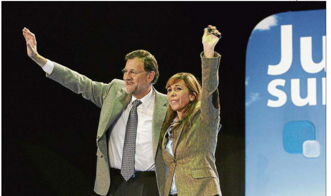
Rajoy i Sánchez-Camacho, ahir, a Tarragona en un acte de campanya electoral.

Va recordar, a més, el suport financer del Govern central al català en moments de dificultats com els actuals i va censurar que Mas hagi «tirat la tovallola» davant la crisi, per «falta de coratge» quan més es necessita. «En la vida i en la política no tot s'hi val. Cap estratègia electoral justifica inventar greuges i posar en risc la convivència», li va recriminar, i va remarcar que «els murs empobreixen i els passos duaners són coses del passat». «El bon governant no trenca la baralla ni s'aixeca a mitja partida», va dir.