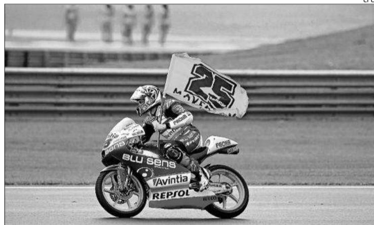
Malgrat la decepció, el de Roses va celebrar el tercer lloc mundialista.

► Danny Kent dona la sorpresa i guanya la cursa de Moto 3 per davant de Sandro Cortese