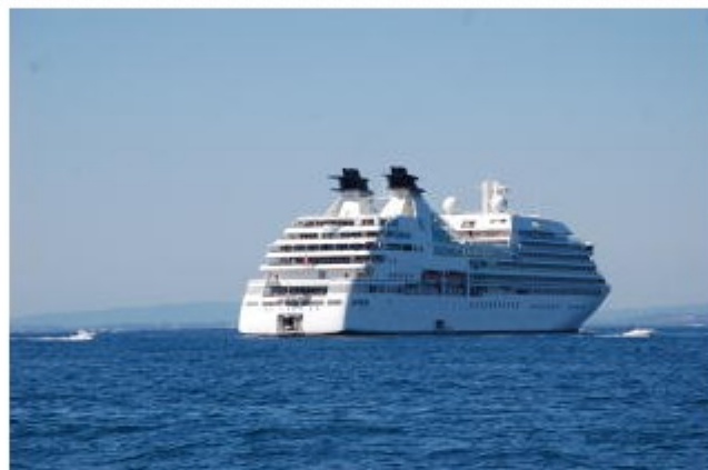
El Seabourn Quest fondejat a la badia de Roses. SANTI COLL

ACN El port de Palamós (Baix Empordà) ja té confirmats 36 creuers que faran escala a les seves instal·lacions durant l'any que ve. Aquesta xifra suposa un increment de deu escales respecte la temporada de creuers d'aquest any, que s'ha tancat aquest mes de novembre amb 26 escales. El de Roses ja en té set de confirmades. El director general de Transports i Mobilitat, Ricard Font, ha remarcat que les expectatives són molt bones i que, fins i tot, l'any vinent es podria superar la xifra rècord de passatgers del 2011, quan van passar per Palamós 38.000 persones. Els primers creuers arribaran a l'abril i la temporada s'allargarà fins al novembre. Aquest 2012 s'ha tancat amb un total de 26 escales i més de 35.000 viatgers.