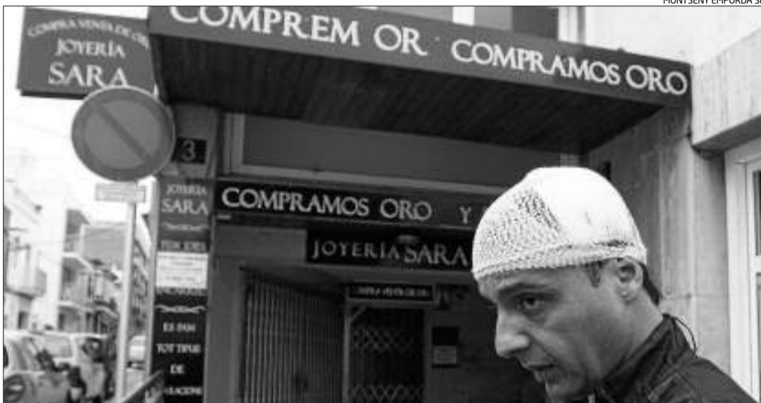
El propietari, amb la bena al cap, davant del seu establiment de la plaça Llevant, on es van produir els fets.

En total, entre les joies i els diners que duia, calcula que es van endur gairebé 100.000 euros juntament