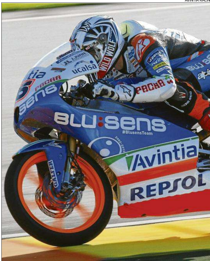
El pilot de Roses va patir problemes mecànics en la qualificació d'ahir.

drosa (Honda) va batre el rècord del circuit (2006, Valentino Rossi: 1:31.002) i d'aquesta forma es va convertir en l'únic pilot a trencar la barrera del minut i 31 segons per recórrer el traçat valencià amb un espectacular 1:30.844. És la cinquena pole del curs per al pilot barceloní, que va superar per tres dèci-