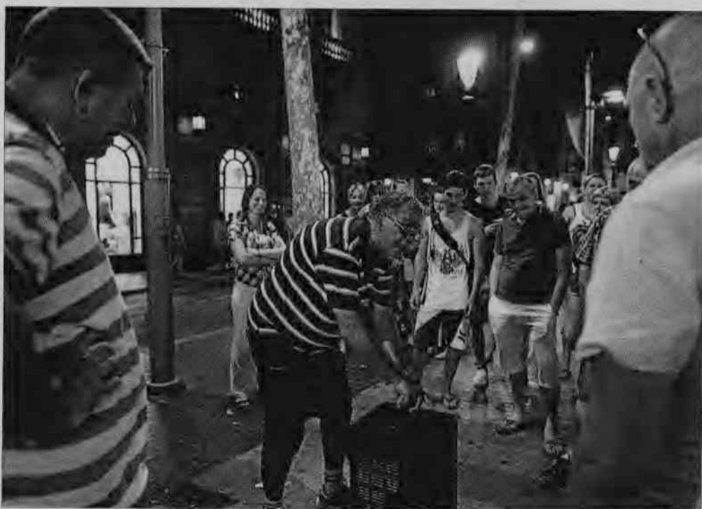
Un grup de trilers en plena partida il·legal, el mes d'agost passat a la Rambla