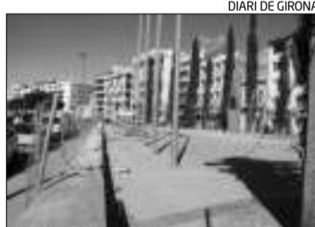
El punt on s'ha començat a actuar.

L'actual govern ha decidit enderrocar la plataforma que es va