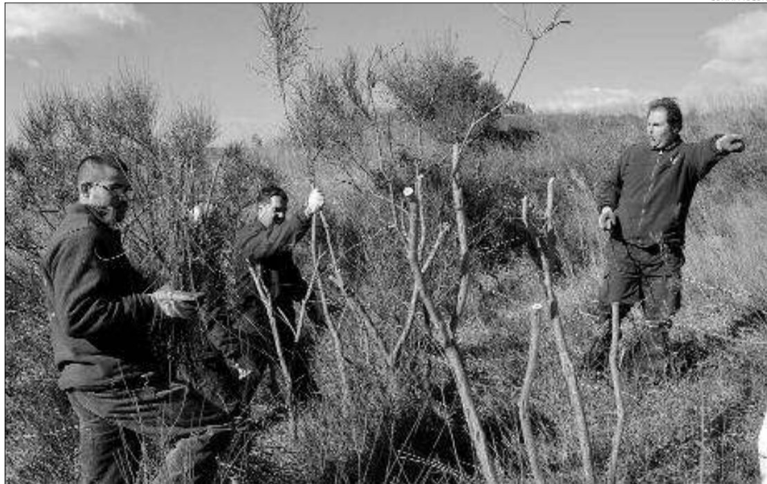
Uns treballadors de la Fundació de discapacitats Altem s'encarreguen de desbrossar la zona.