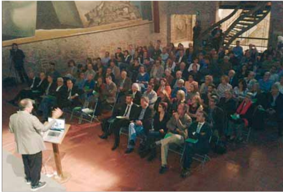
La inauguració de les jornades del paisatge es va fer al Museu Dalí ■ M. VICENTE

Ruiz-Geli va posar com a exemple les dificultats amb la producció energètica neta i va dir que la normativa d'edificacions obliga a posar plaques solars i la normativa del parc no ho permet. "No té sentit