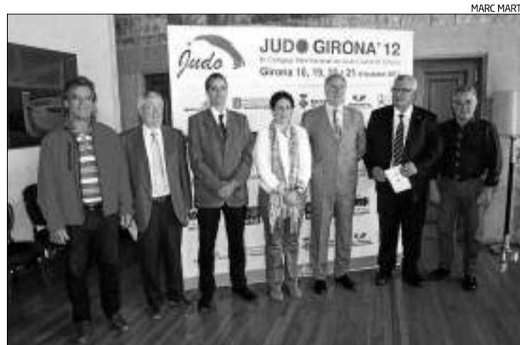
Els organitzadors i els diversos representants de les institucions.