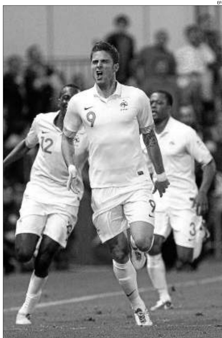
Olivier Giroud va marcar quan pasaven quatre minuts del temps.