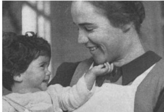
La Biblioteca Municipal Jaume Vicens Vives acull la presentació del llibre Gencat.cat

El llibre descobreix la Maternitat d'Elna, una institució humanitària situada al Rosselló (Catalunya Nord) i fundada l'any 1939 per la suïssa Elisabeth Eidenbenz, on hi van néixer uns 600 nens. En la seva majoria, eren fills de refugiades de la Guerra Civil Espanyola que estaven internades en els camps propers a Elna (Sant Cebrià de Rosselló, Argeleres, Ribesaltes), on malvivien en condicions penoses.