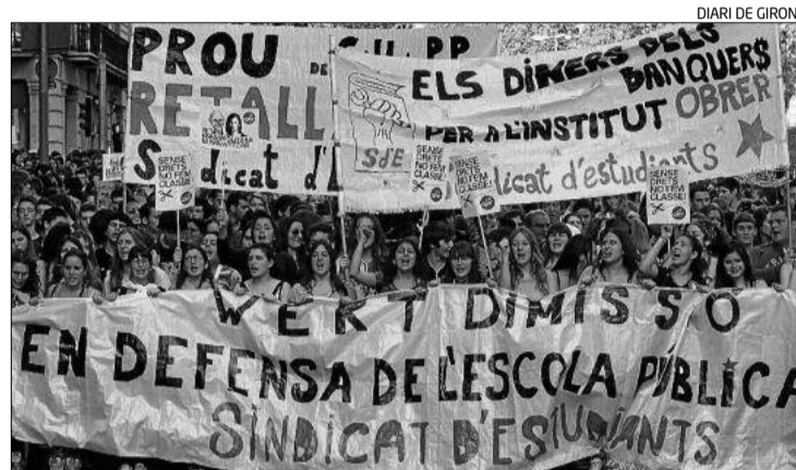
Milers de participants a la manifestació de Barcelona.