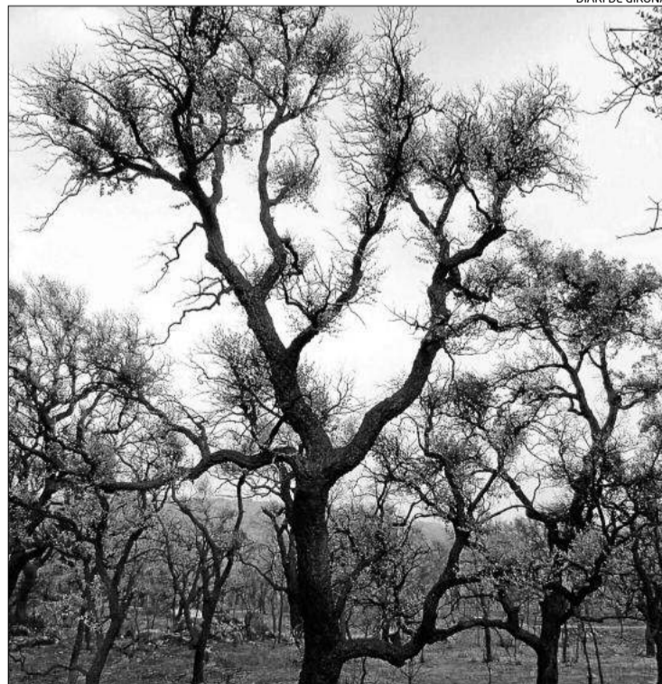
Les fulles ja surten de les branques dels arbres cremats.

Segons expliquen des de l'iniciativa CORK -iniciativa d'institucions i patronals del sector i dedicada a promoure els taps de suro- han aparegut brots verds a les co-