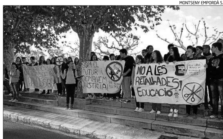
Concentració dels alumnes de l'IES Illa de Rodes, a Roses.

ministre d'Educació, José Ignacio Wert. La manifestació havia estat convocada pel Sindicat d'Estudiants i l'Associació de Joves Estudiantes de Catalunya (AJEC) i va transcórrer en un ambient festiu i sense incidents, encapçalada per una pancarta amb el lema «Wert dimissió, en defensa de l'escola pública». Els joves han cridat consignes com: «Boti, boti, boti, banquer qui no boti!», «Diners per al fill de l'obrer!» o «Els diners han de ser per a l'institut obrer!», entre d'altres. Segons preveuen les dues organitzacions estudiantils, avui el seguiment pot ser més elevat, sumant-se a la protesta la Federació d'Associacions de Pares i Mares d'Alumnes de Secundària, en contra de la reforma educativa del Govern.