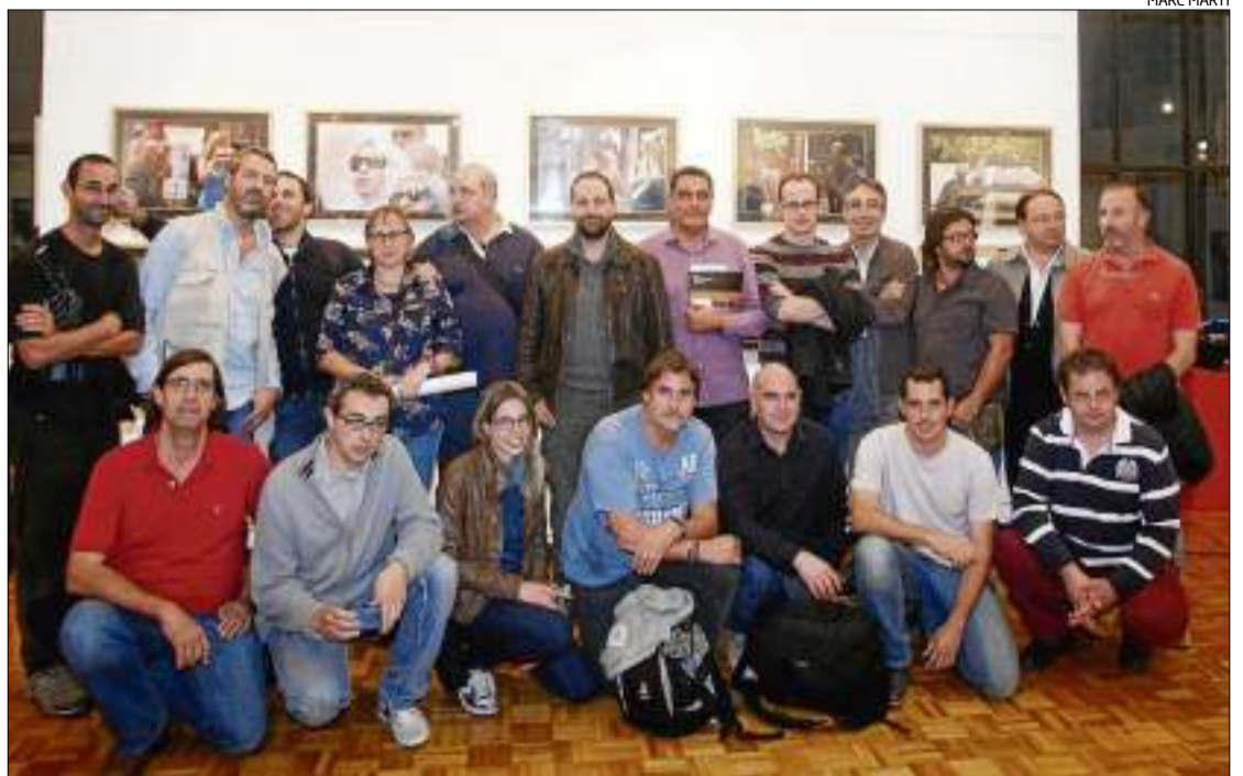
Foto de família dels fotoperiodistes gironins en la inauguració de la mostra.

regen amb altres de les entitats d'atenció social, o bé manifestacions de protesta i també, per què no, imatges eròtiques. No hi falten els esports.