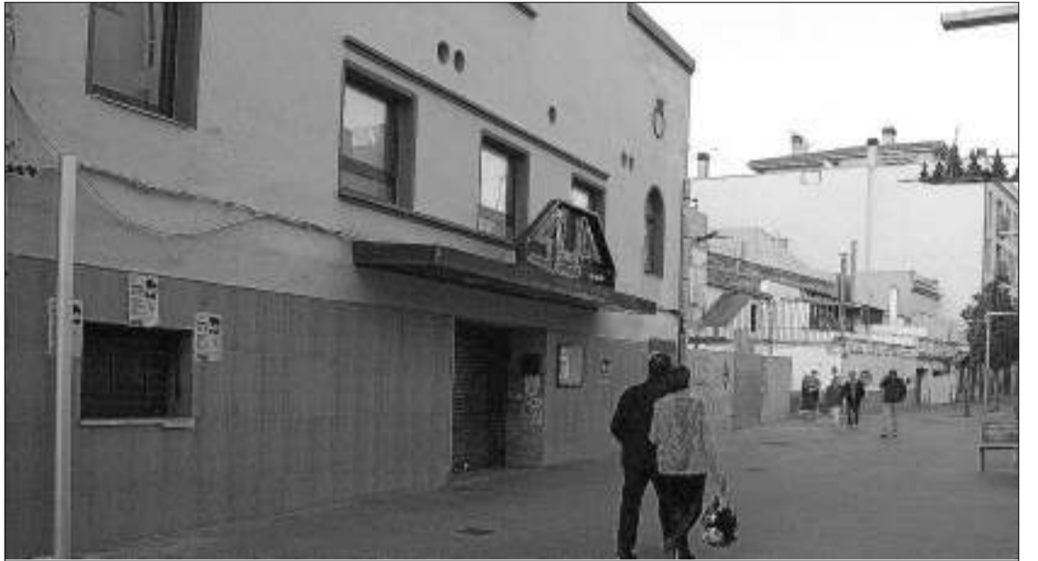
La sala SUF que es va cedir a l'Ajuntament per tal de construir un nou edifici.

La SUF es va projectar durant el govern de Magda Casamitjana (PSC) 2003-2007 dins el Pla de Barris. Era un edifici amb un projecte arquitectònic innovador de 2400 metres quadrats a partir d'un disseny sorgit d'un concurs públic. El cost de les obres era de 3,5 milions. L'actual govern de CiU encapçalat per Carles Pàramo va decidir replantejar tots els equipaments, incloent aquest. A més, tampoc acaben de convèncer algunes solucions arquitectòniques. Per això el març d'aquest any, veient que la cosa aniria per llarg, es va modificar el conveni amb la SUF establint que l'Ajuntament té dos anys per executar l'obra o haurà de tornar l'edifici. Finalment ha estat aquest mes quan l'entitat rosina ha recuperat la sala antiga de l'immoble i alhora ha tornat a programar activitats.