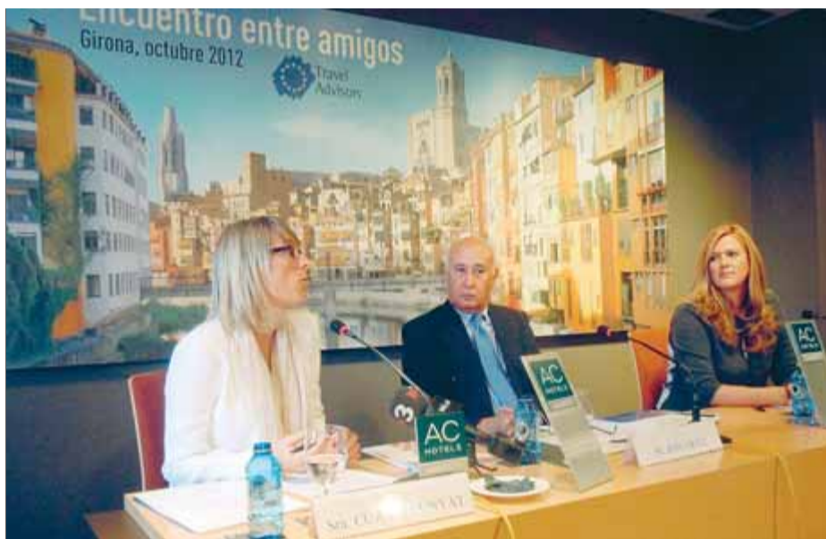
Cunyat, Ortiz i Puig, durant la presentació de la trobada

Ortiz va assenyalar que l'arribada del TAV "col·locarà Girona entre les grans destinacions de congressos" i es va felicitar