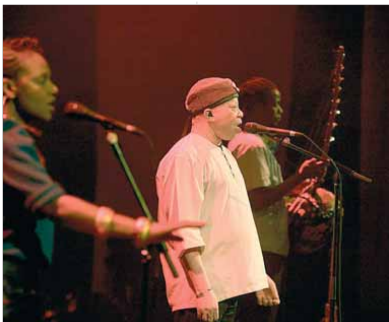
Salif Keita, entre la corista i l'interpret de 'kora', a l'Auditori

Salif Keita va sortir a escena acompanyat d'una banda relativament reduïda respecte al que és habitual en els seus directes. El cantant, hieràtic al mig de l'esce-