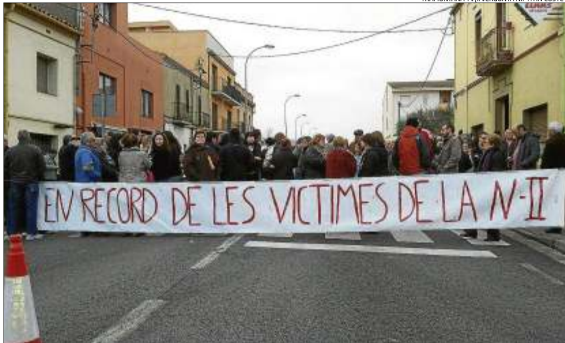
Els veïns protestant ahir al matí a la carretera de Bàscara, com fan de dilluns a divendres.

Tal com van acordar en la reunió veïnal de dijous passat, l'endemà es va celebrar una primera trobada per crear comissions de treball i organitzar-se. Segons han informat fonts del grup veïnal, es van posar sobre la taula propostes, idees, per si passades les quatre setmanes, a principi de març, els camions continuen circulant per la nacional. La possibilitat d'utilitzar amb més freqüència de l'habitual el pas de vianants amb semàfor per creuar la N-II amb l'inconvenient que pot generar per als cotxes és una de les possibilitats. A més, tal com també es va apuntar durant la primera reunió, consideren important rebre el suport i l'adhesió de les poblacions que al llarg de la N-II pateixen situacions similars. Per això, el moviment veïnal té previst treballar en un manifest per tal que s'hi puguin sumar altres veus. Fins ara s'han afegit a les protestes, i han mostrat el seu