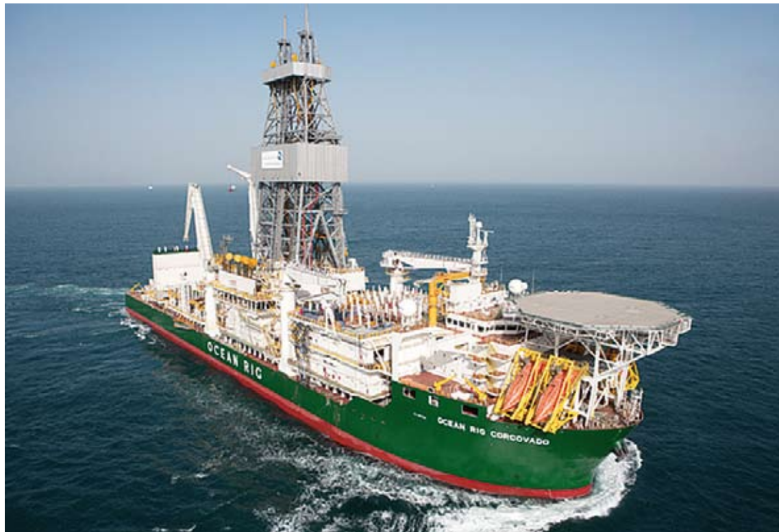
PLATAFORMES. Un dels vaixells de la multinacional anglesa que es dedica a la recerca de petroli arreu del món

És en aquest context on, fa poques setmanes, sorgia la notícia que Capricorn Spain Limited, filial de la britànica Cairn Energy, vol fer prospeccions a la recerca de petroli davant de la Costa Brava i el Golf de la Lleó, segons va publicar a mitjans gener el Butlletí Oficial de l'Estat (BOE). La petició es troba actualment en període d'informació pública i s'espera una allau d'alegacions, bàsicament des del territori, tant