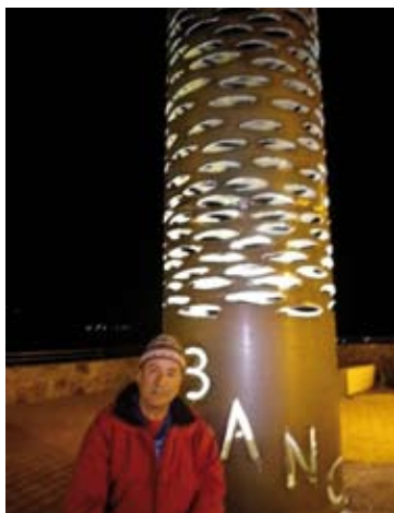
BROS. Al costat de l'escultura de Colera i pintant al dic de Llançà