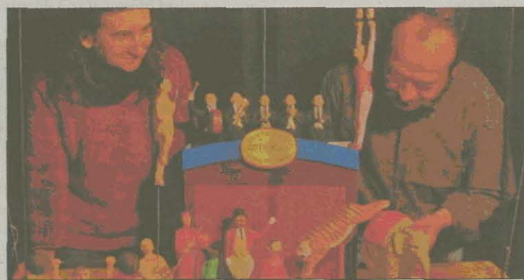
Els dos creadors amb els personatges circencs que han creat. EMPORDÀ

► També presenten un taller al Festival del Circ i posen a la venda divuit figures de cartró pedra sobre personatges circencs