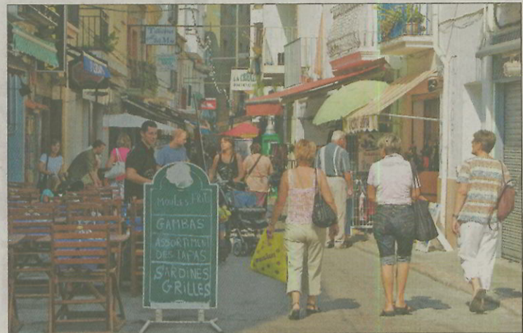
Roses aposta per formar cambrers pels establiments locals. EMPORDÀ

D'acord amb les característiques i necessitats del mercat laboral rosinc, els cursos programats per a les persones beneficiàries del dispositiu seran el de cambrer