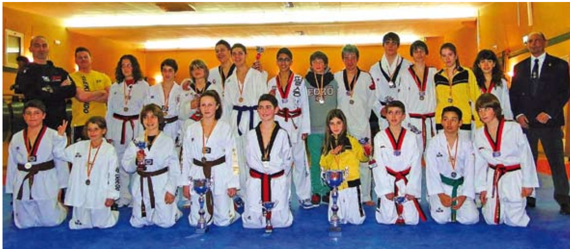
TAEKWONDO D'ALÇADA. Una imatge dels participants a la primera edició de la Gala Nacional que es va disputar a Palau TKD JOAN'S