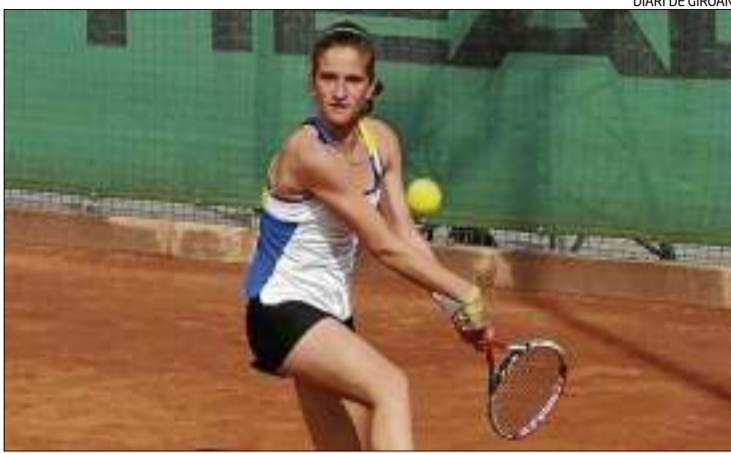
DIARI DE GIROAN