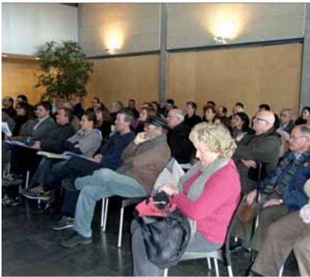
Una seixantena de persones vinculades al sector del comerç van assistir a la trobada ■ EL PUNT AVUI