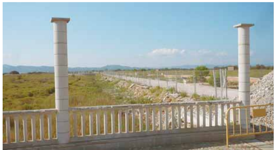
El passeig marítim de la Pletera, a l'Estartit ■ A.V.

L'Ajuntament de Torroella de Montgrí va entregar a Costes per escrit la proposta per refundre en un sol projecte el passeig del Molinet i la desurbanització de la Pletera, per tal d'obtenir una subvenció global de 3 milions d'euros, a través d'un projecte Life, de la Unió Europea. Aquesta és la via prevista per convèncer l'administració perquè desencalli el desenrunament de la Pletera. Sense oblidar el Molinet. El Life es presentaria amb el títol de Projecte de restauració ambiental dels ecosistemes costaners del litoral de l'Estartit , de manera que això permetés englobar tant l'execució del passeig del Molinet com les accions pendents en la zona de la Pletera. Es buscava amb les accions també la reparació del sistema dunar i la restitució de la zona d'aiguamolls, a banda de la desurbanització de la zona, amb el lògic desenrunament. Si Costes accepta la proposta, l'estalvi global seria d'un milió i mig d'euros. En el cas que el govern local i l'espanyol acceptin la via europea per obtenir la subvenció, el projecte