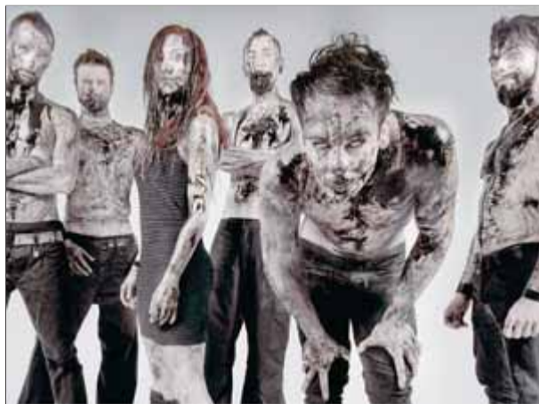
Morphium, fills de les tenebres

Aquesta serà la segona vegada que Morphium actua al Hell and Heaven Metal Fest, ja que els gironins també hi van actuar en l'edició del 2011. Ara hi tornen per obrir la gira americana del seu nou disc, Crònica de una muerte anunciada (Mass Records / Música Global), que durant els mesos de maig i juny passa-