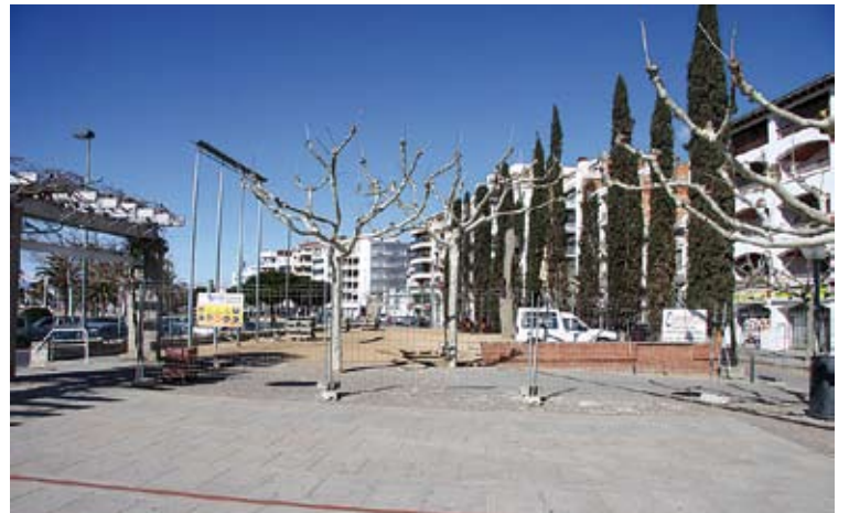
43.000 EUROS. L'import de l'adjudicació a una empresa local

Les obres iniciades comporten l'enderroc de la plataforma situada a la vessant nordoest de la plaça, a fi de donar uniformitat i coherència a l'espai i situar-lo en una mateixa rasant a la de les dues voreres adjacents, tant a la banda de mar, Avinguda de Rhode, com a la banda de muntanya. Per