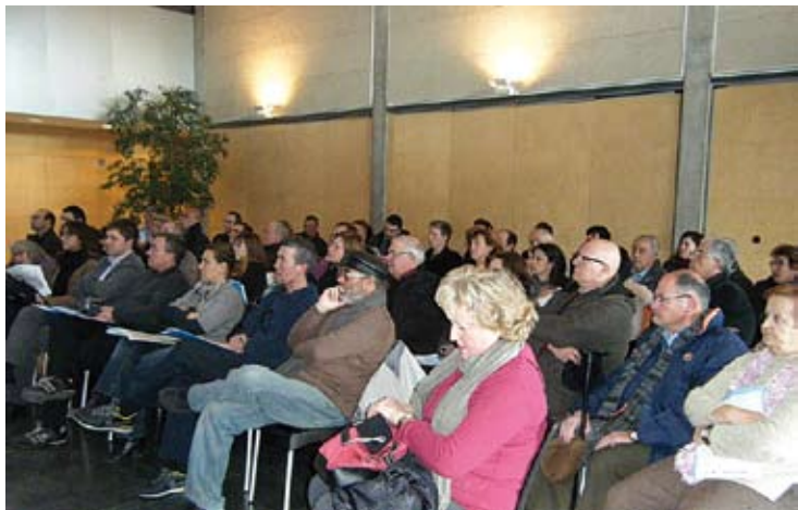
LA SETMANA PASSADA. Una seixantena de persones del món del comerç