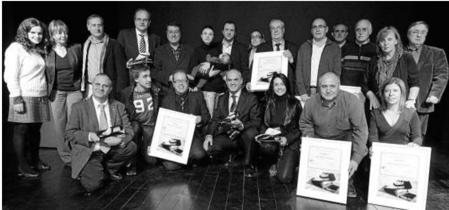
Foto de família de tots els premiats.