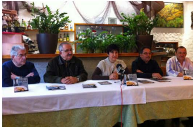
Presentació de la campanya amb la presència de restauradors de la població.