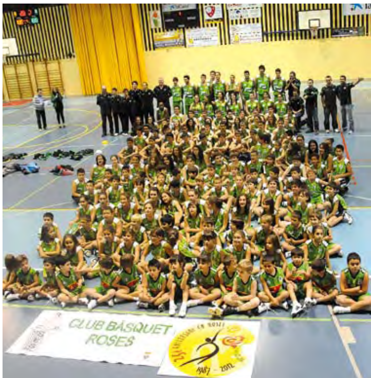
PRESENTACIÓ. El club va reunir els jugadors dels 14 equips ÀNGEL REYNAL