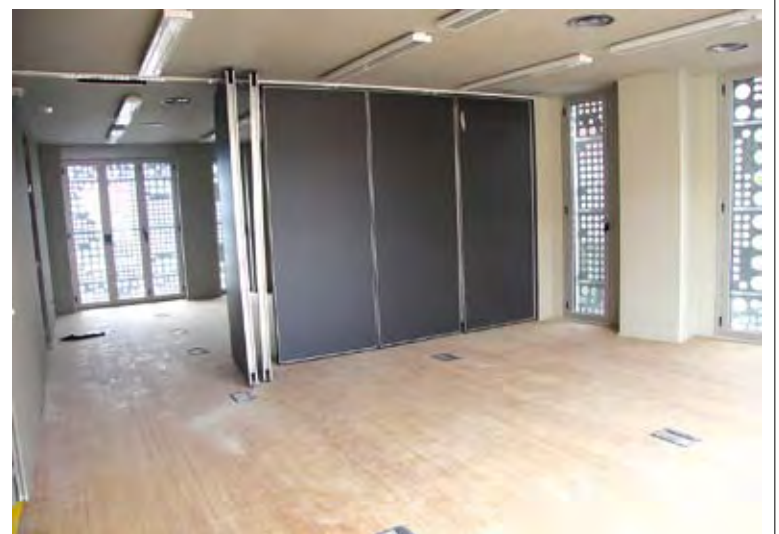
INTERIOR DE CA L'ANITA. Encara està per decidir l'ús de l'equipament