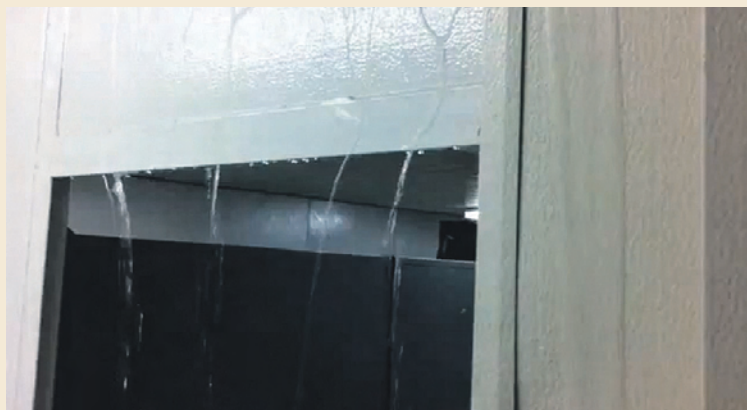
TESTIMONI. Dos vídeos mostren les columnes d'aigua i el terra inundat www.youtube.com

■ El Sindicat de Polícies de Catalunya (SPC) i el Sindicat de Mossos d'Esquadra de Comissions Obreres (SME-CCOO) han denunciat el mal estat en què es troba la comissaria de districte de la Jonquera, que es va inaugurar fa només tres mesos. La gota que va fer vessar el got va ser la inundació que van patir les instal·lacions la matinada del 21 d'octubre: l'aigua procedent de l'abundant pluja que va caure es va filtrar per les juntes del sostre i les parets