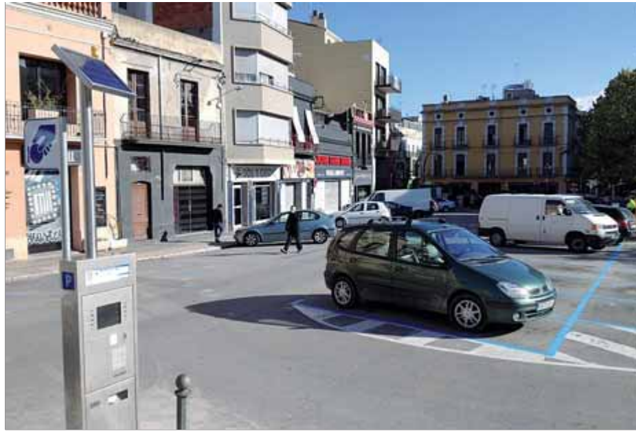
Una imatge de la plaça del Sol, on els aparcaments ja són de zona blava ■ EL PUNT AVUI

Precisament, ahir ERC va anunciar que al ple d'avui presentarà al·legacions a les ordenances fiscals del 2013, en què demanarà que s'ajorni la implan-