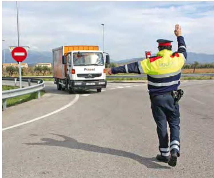
PONT DE MOLINS. Controls la setmana passada aprofitant la rotonda d'accés al poble.

A Pont de Molins al quilòmetre 762 de l'N-II, la setmana passada diversos agents dels Mossos