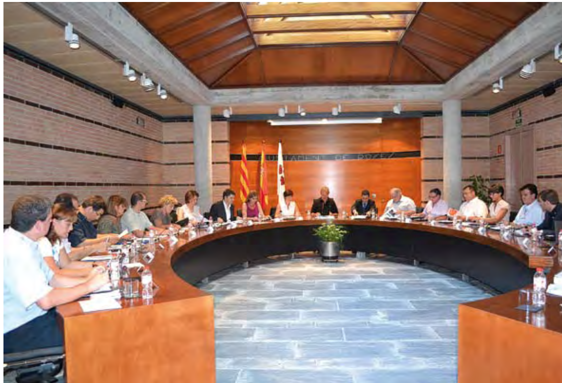
PLE DE ROSES. CiU governa amb el suport del PP, grup que té la regidoria d'Hisenda

Tot i que segons la darrera dada coneguda (setembre 2012) la taxa anual de l'IPC general ha pujat un 3,4%, augment al qual s'ha de sumar el recent increment de l'IVA, que en el cas del consistori rosenc suposa un augment d'un 500.000 euros a l'any en la despe-