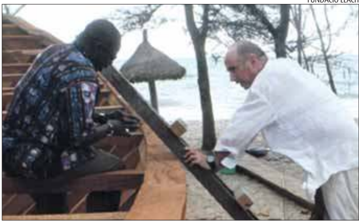
EL NÚMERO 1 FUNDACIÓ LLACH

▶ Aquest és un tema polièdric. Els permet començar, allà, encara que sembli estrany, ja que tenen molta cobertura telefònica. La informàtica serà una gran eina pedagògica gràcies als ordinadors i les impressores que hem aconseguit i que els hi portarem. Si un nen o una nena pot avançar en els estudis, quan arribi a Dakar, la gran capital, estarà perdut perquè allà treballen a la manera europea de les grans metròpolis. Els nens del poble estan condemnats al fracàs si abans no han treballat amb equips informàtics. En un