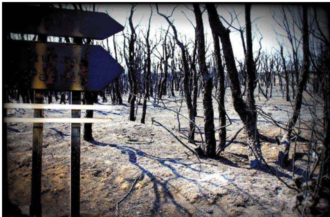
EL DECORAT. Una esfereïdora imatge del bosc de Capmany

Diuenge 21 d'octubre, a les dotze del migdia, s'inaugurarà l'exposició d'instal·lacions escul-