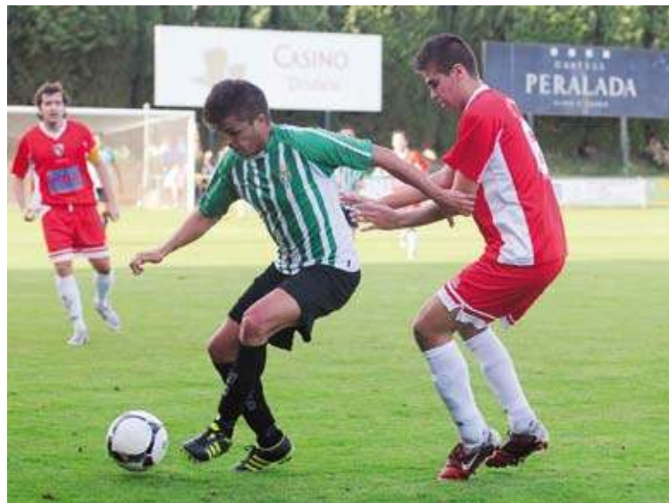
EN RATXA. El Peralada va saber resistir 82' en inferioritat numèrica

A la represa els locals van estirar les seves línies, tot i jugar amb 10, i van arribar en diverses oca-