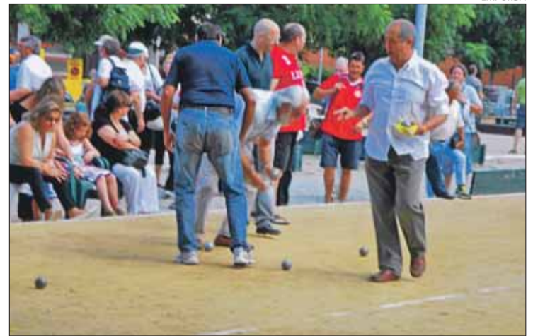
Felip Puig, en una trobada de petanca a les Franqueses, el juliol passat.

A la matinal del dia 27 (de 9 a 14 hores), hi haurà partides de tripletes amb polítics i jugadors de clubs de petanca a les pistes del CP Figueres Natació, situades just al costat del Poliesportiu municipal. Per una banda hi haurà partides entre Puig -el seu equip