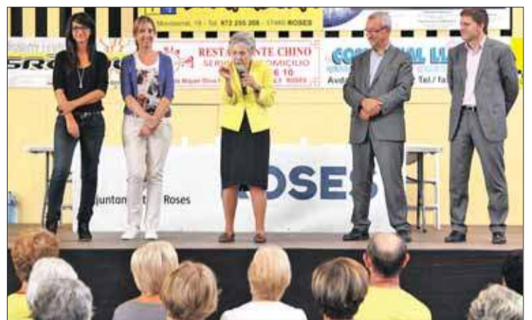
Ferrusola va presidir l'acte inaugural. MONTSENYEMPORDÀ

Les activitats s'han dividit en cinc grups (cadascun dels quals realitza dues sessions setmanals), que permeten la pràctica esportiva a persones de la tercera edat, millorant la seva qualitat de vida, salut i relacions socials.