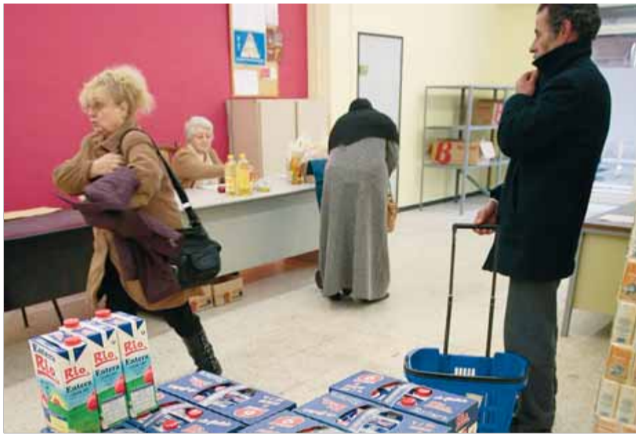
Usuaris al centre de distribució d'aliments de Salt, en una imatge d'arxiu

Aquestes són algunes de les dades que la responsable del programa d'aliments de Càritas de Girona, Dolors Juliol, va donar a conèixer ahir amb motiu de la signatura, al CDA de Salt, d'un conveni entre Dipsalut i Càritas per mitjà del qual la institució aportarà 40.000 euros per