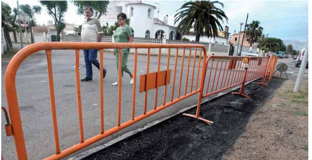
Les obres del clavegueram es van projectar el 1998 i s'acabaran el 2012. A la imatge, les obres de la tercera fase

L'alcalde de Castelló, Xavi Sanllehi, recorda que aquesta gran inversió s'ha hagut de fer per l'herència d'una urbanització feta sense cap planificació abans de la democràcia. I destaca que un cop acabada aquesta inversió, que es