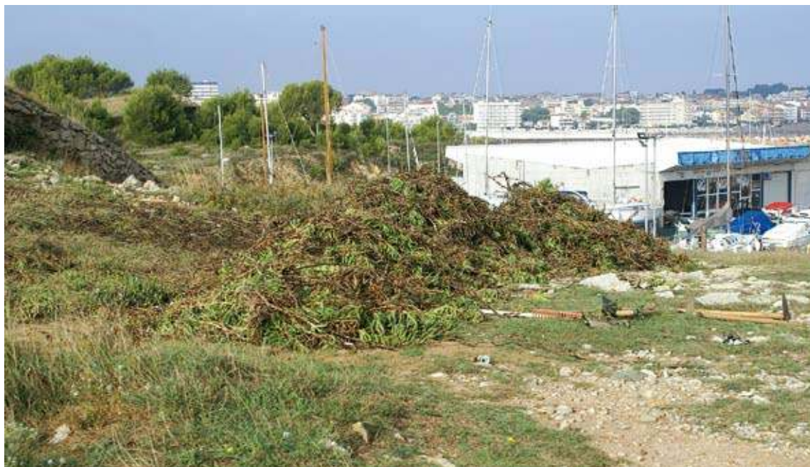
PRIMERA FASE. S'estan arrancant les espècies invasores, que es deixen apilonades perquè es vagin assecant

Les actuacions, que se centraran al terme municipal de l'Escala, per-