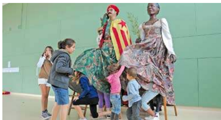
NAVATA. Divendres l'escola va estar oberta durant tot el matí

■ Diverses institucions de l'Alt Empordà van decidir obrir les portes el dia 12 perquè no consideraven oportú celebrar la festa de la Hispanitat. És el cas, per exemple, del CEIP Joaquim Vallmajó de Navata, on l'AMPA va organitzar diverses activitats per a la mainada. Van fer tallers, danses tradicionals, ballada de gegants i capgrossos o xerrades, entre altres activitats lúdiques i educatives. I van cloure la jornada amb un dinar de