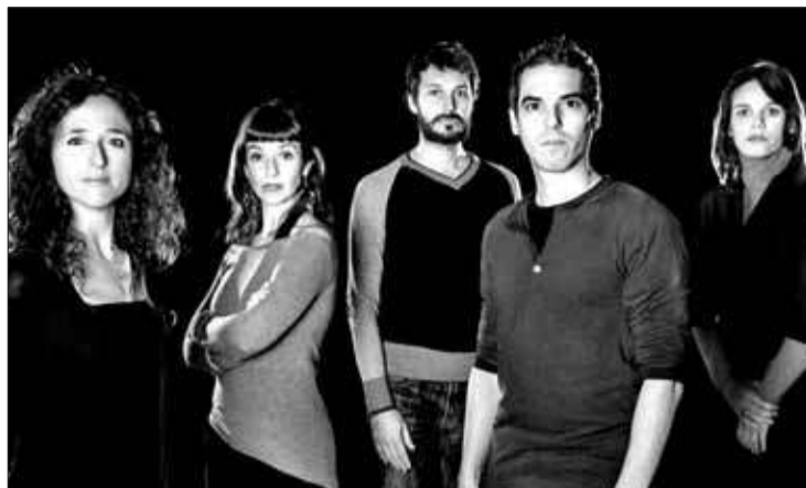
Actors i director, en una imatge promocional de l'obra.