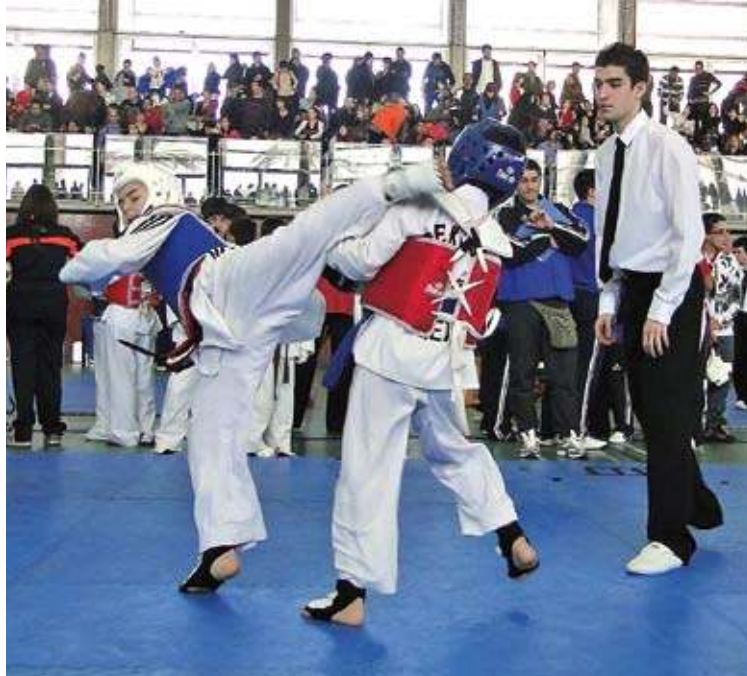
COMPETICIÓ. Una imatge d'un dels combats disputats al català infantil