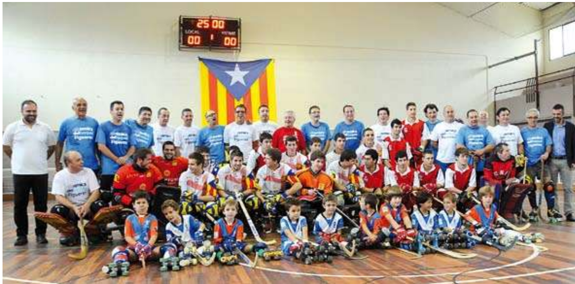
JORNADA FESTIVA. Els jugadors veterans amb els de les seleccions de Girona i Catalunya i els dels CH Figueres