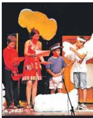
Un muntatge de l'Aula.

Els cursos que ofereix l'Aula són de teatre infantil, per a nens de 7 a 12 anys, els divendres de