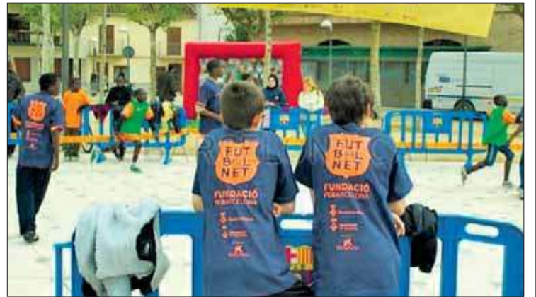
Diferents localitats catalanes acolliran la segona edició de FutbolNet.

La temporada passada, la Fundació del Barça va organitzar una festa de final de temporada al Mini Estadi on van participar 300 beneficiaris del projecte i les seves famílies.