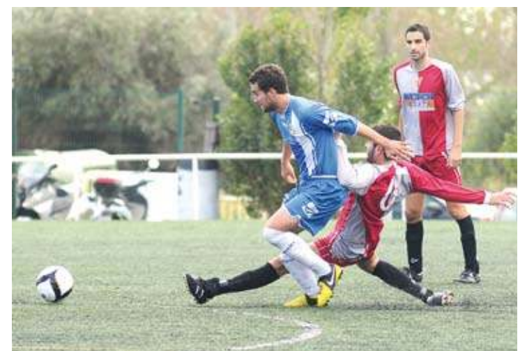
MAL INICI. El Base Roses ha perdut els últims cinc partits de lliga