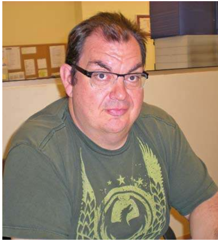
SANÉS. ERC creu que en el primer any de mandat de CiU “no s'ha millorat res” G. V.

→ PARATGE DE TUDELA “ALLÀ S'HAN PERDUT BOUS I ESQUELLES I L'APARCAMENT ARA ESTÀ TANCAT”