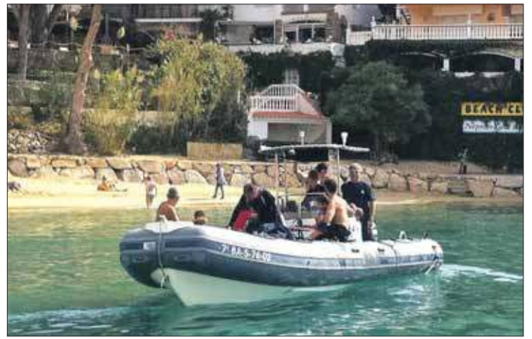
El Club Badia de Roses netejant Canyelles Petites. EMPORDÀ