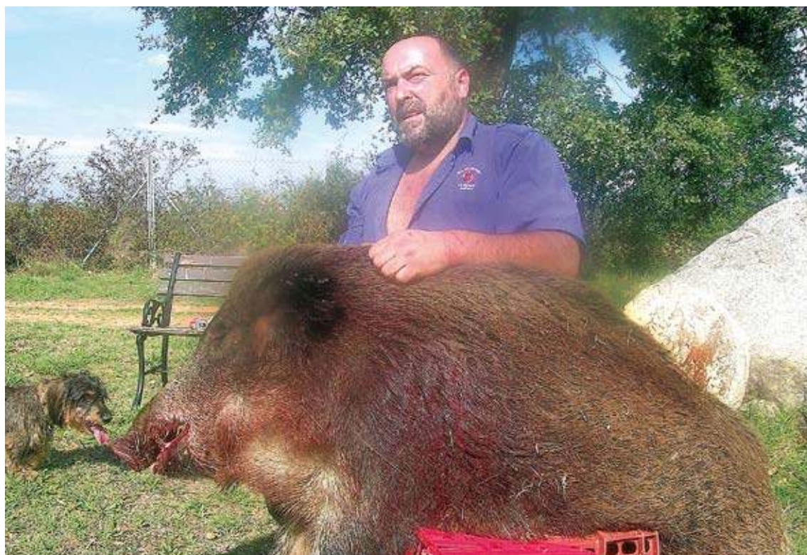
SENGLAR DE 130 QUILOS. Abatut la setmana passada per la Colla de Caçadors de Bàscara

La concessionària de l'autopista deixa clar que, malgrat que el pas de senglars per la via en els últims dies s'hagi produït en un parell d'ocasions, "no és un fet habitual" i s'incideix en què, quan es detecta la presència d'animals que podrien envair la calçada s'opta