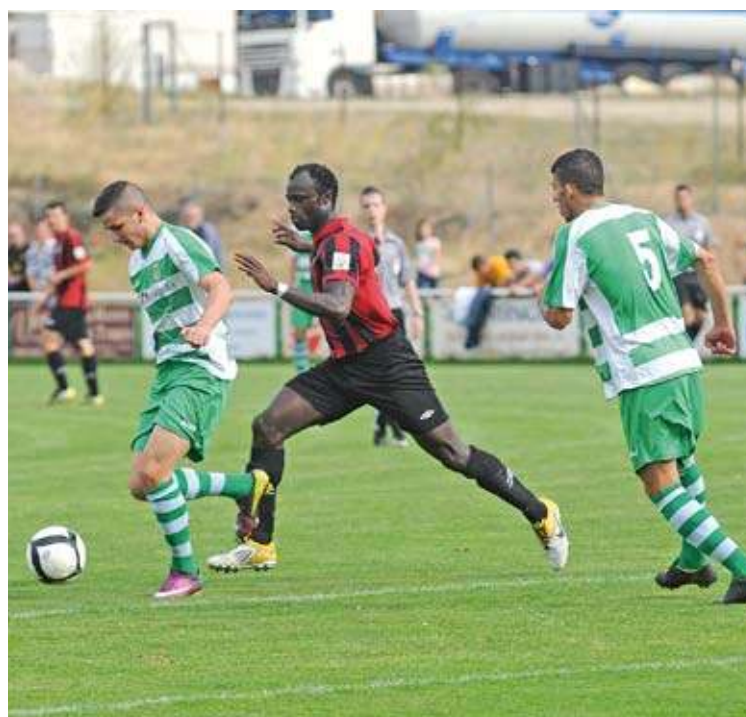
LÍDER SÒLID. La Jonquera va guanyar amb solvència a Santa Coloma