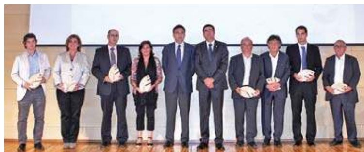
COSMOCAIXA DE BARCELONA. Lliurament dels guardons el passat 4 d'octubre HN